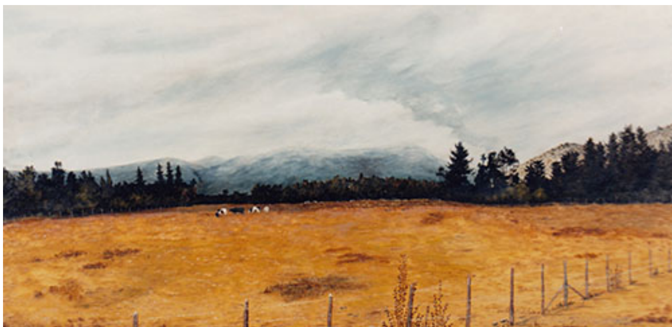
POTRERO EN BUCALEMU