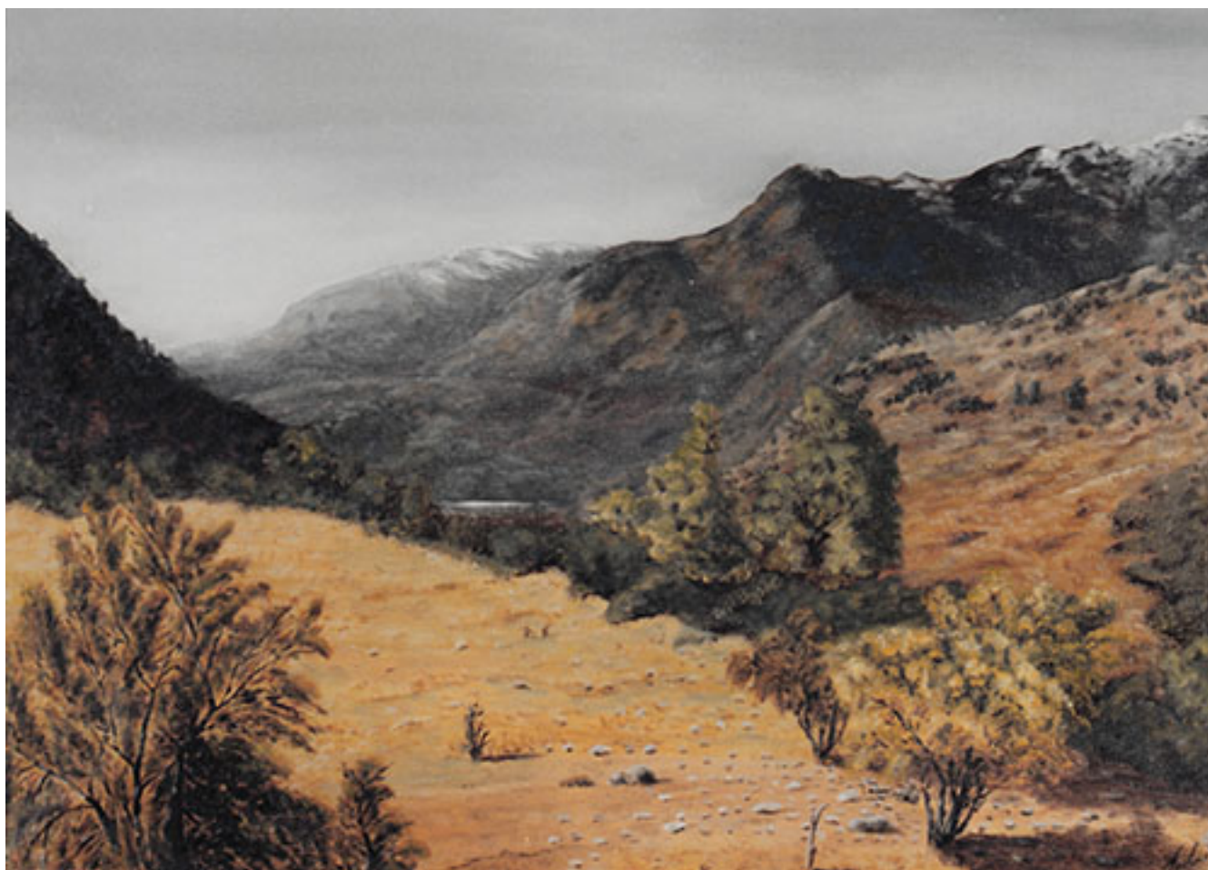
RINCÓN EN EL CAJÓN DEL MAIPO