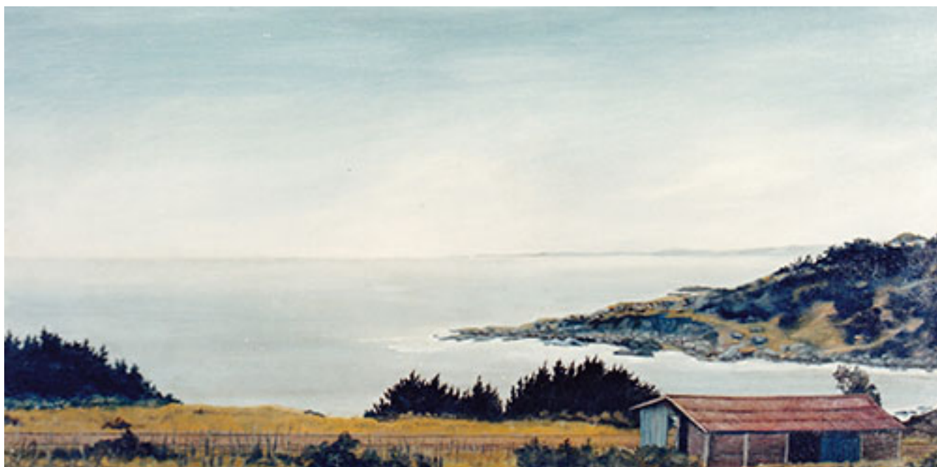
PUNTILLA DE CARTAGENA