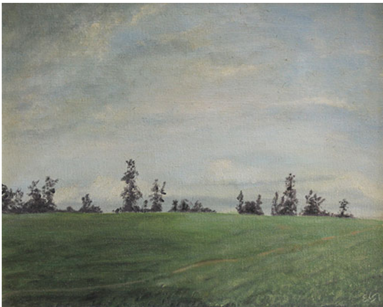
POTRERO EN AYENTEMO