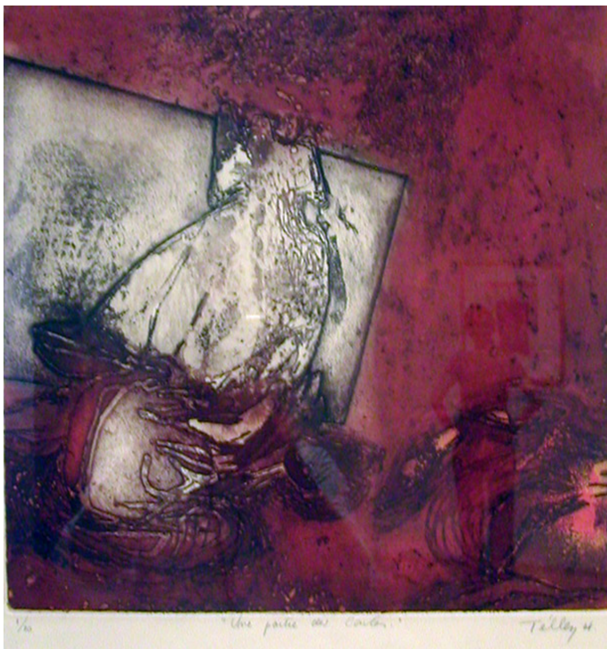
UNE PARTIE DES CARTES