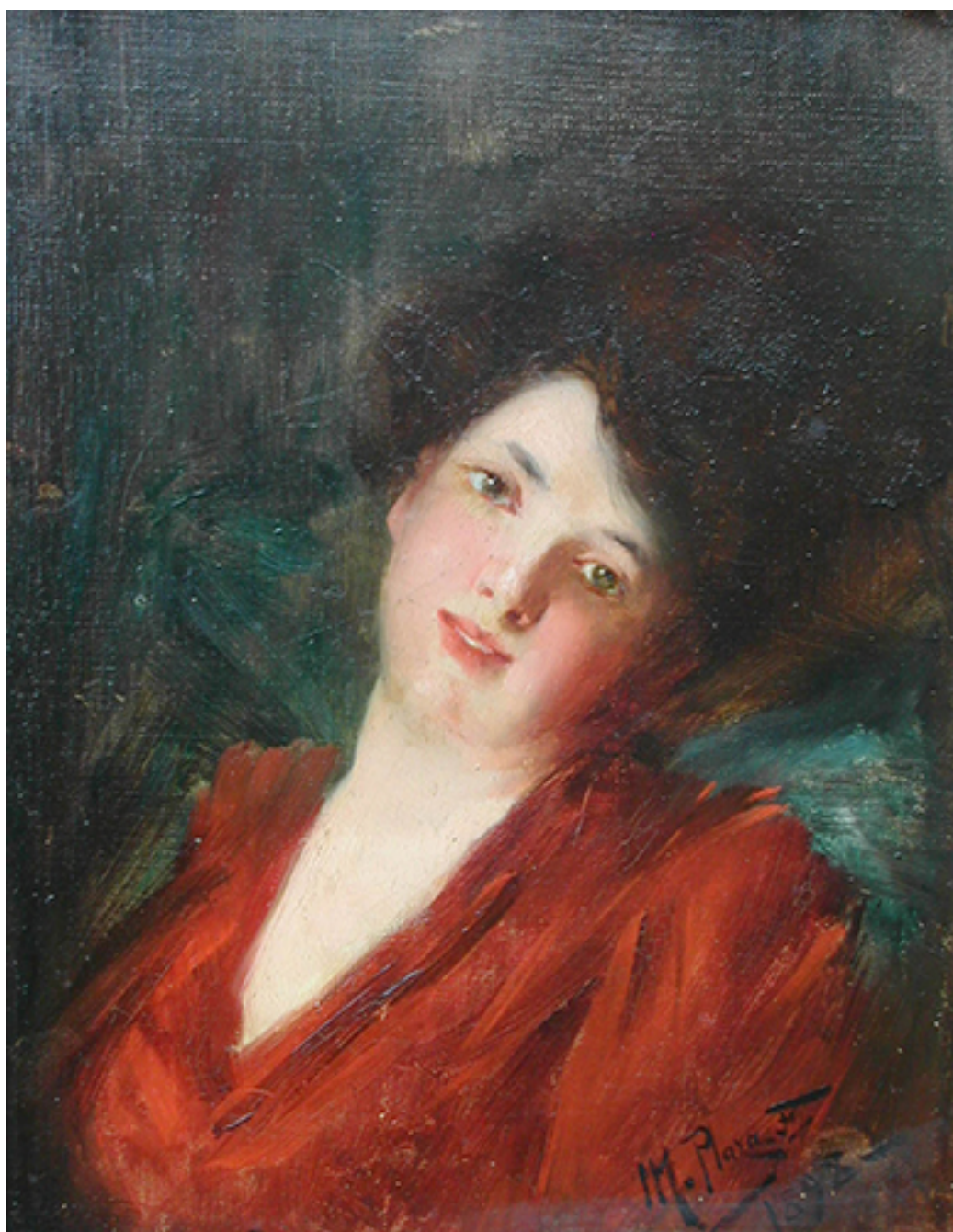
CABEZA DE NIÑA

ZAMORANO PEREZ Pedro, CORTÉS LOPEZ Claudio y MUÑOZ ZÁRATE Patricio, 2006. Pintura chilena 1920-1960: algunas categorías y periodizaciones. Universum [en línea]. Talca: Universum, vol. 1, no. 21 pp. 2 -29 [consulta junio de 2018] Disponible en: https://scielo.conicyt.cl/scielo.php?script=sci_arttext&pid=S0718-23762006000100013