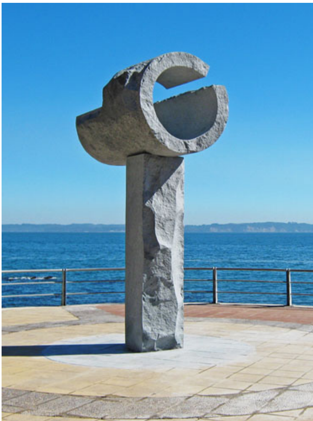
ELOGIO AL ESPACIO