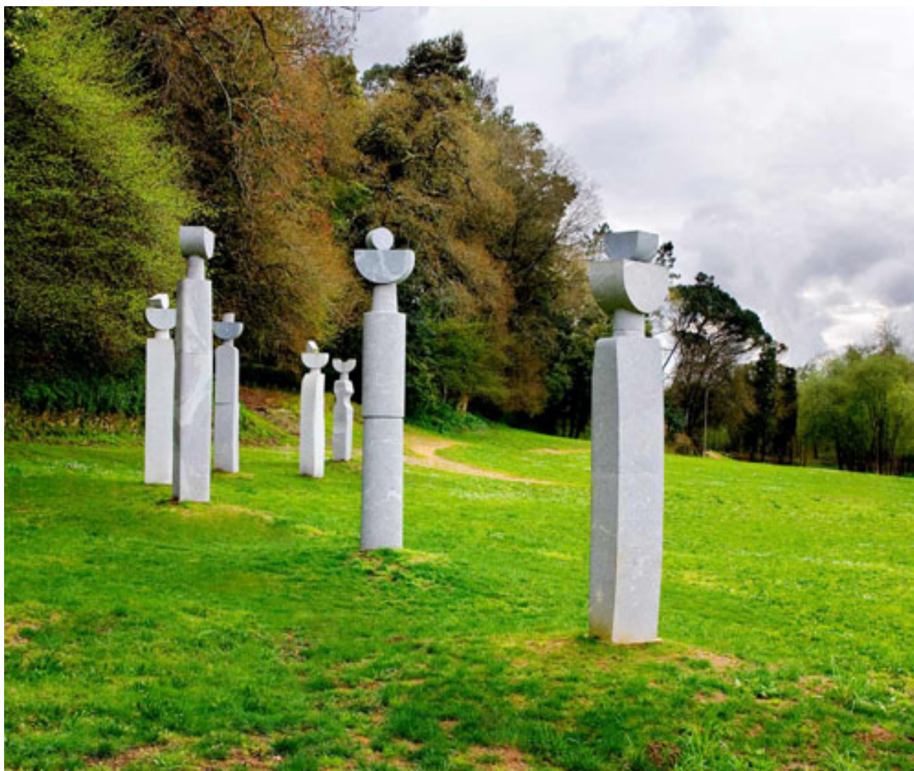
CONJUNTO MARÍA DA FEIRA