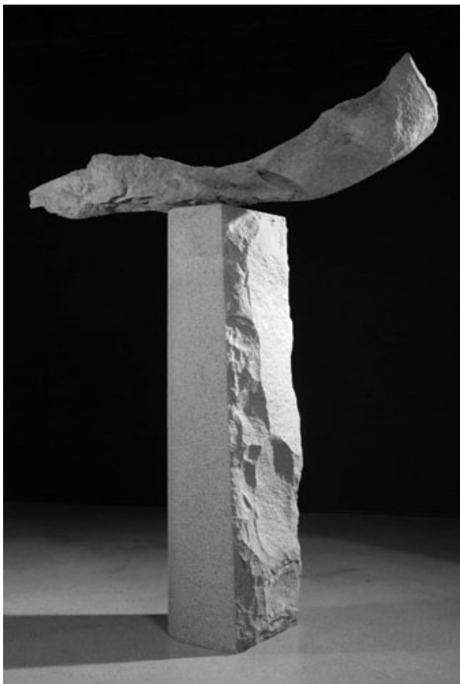
ESPÍRITU DEL SILENCIO