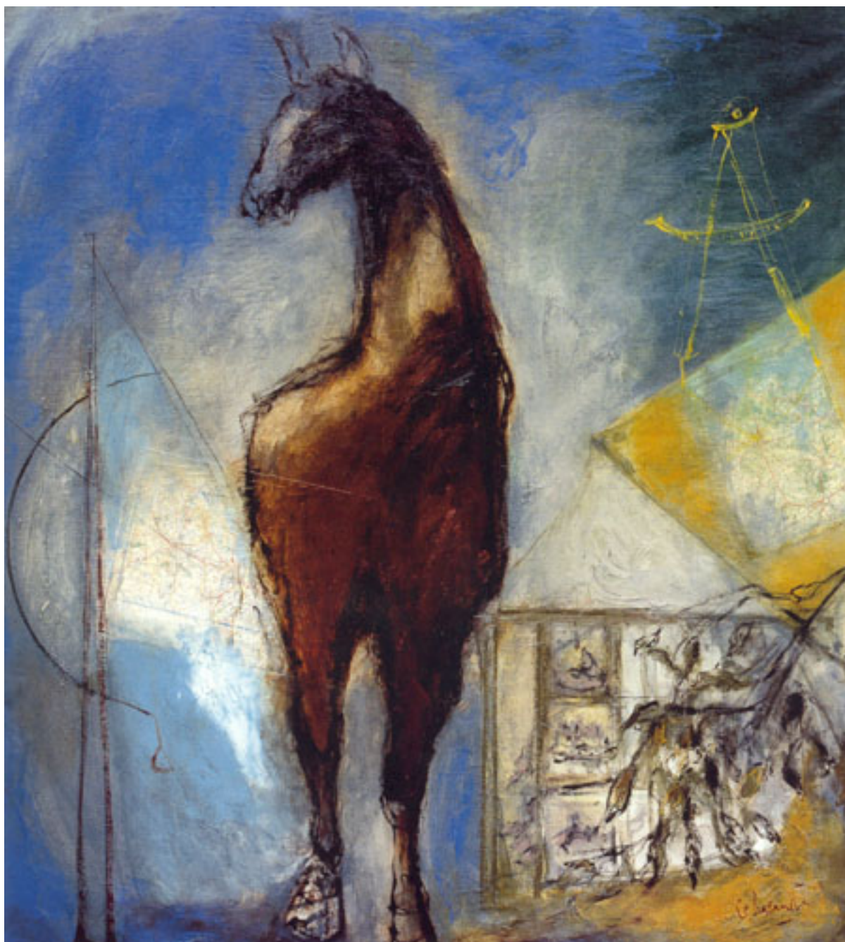
VOYAGE A CHEVAL