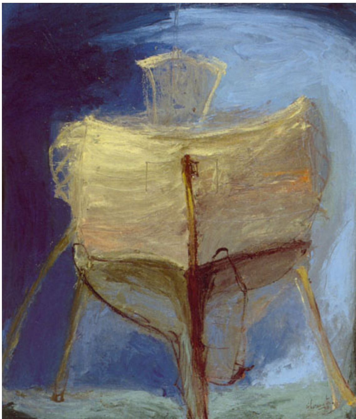
LE DOS DE LA BARQUE