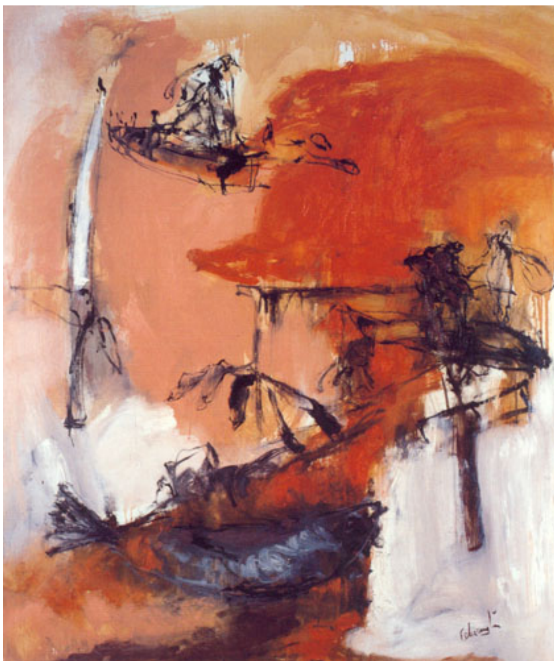
POISSON AU FROND ROUGE