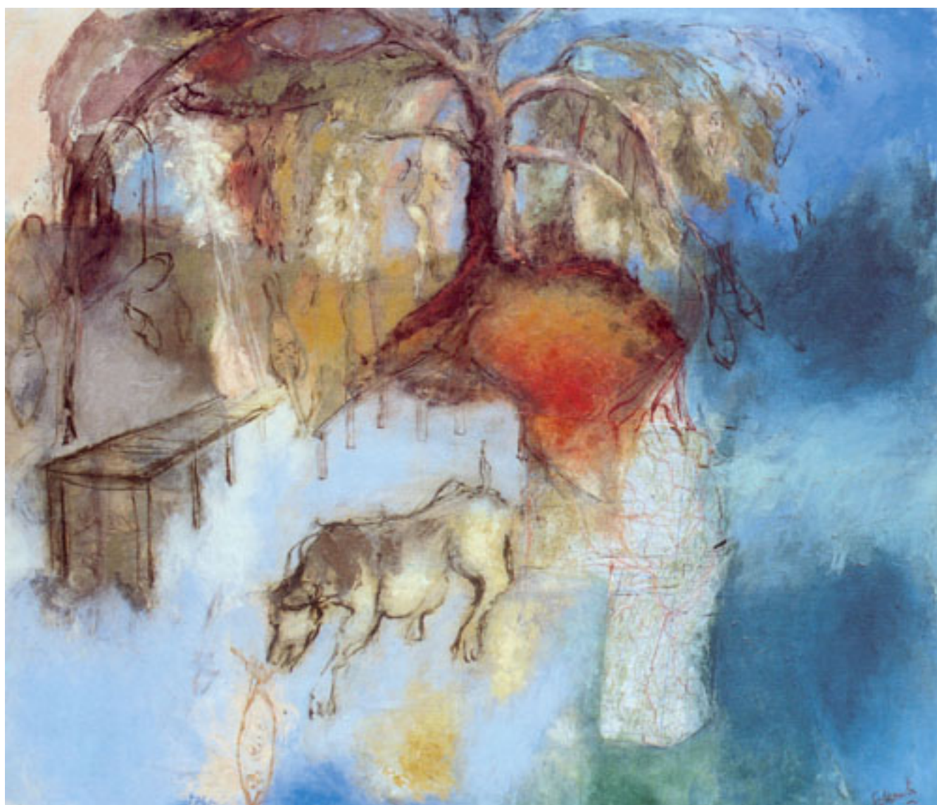
L'ABRE AUX POISSONS