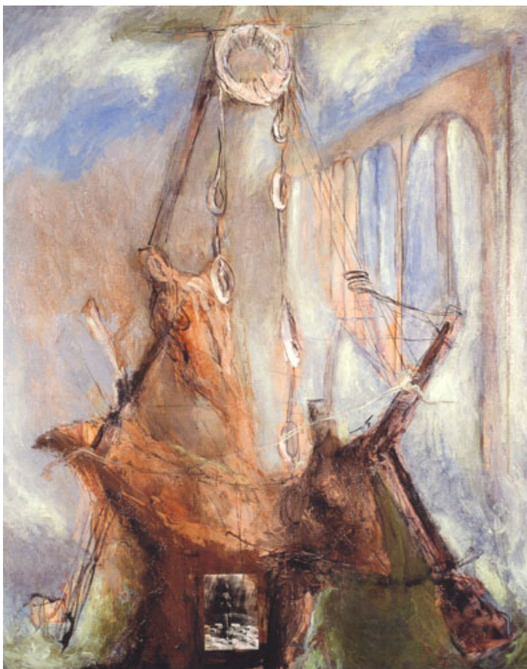
LE Puits de la Vierge II

(Imágenes de obras enviadas y autorizadas por el artista, 09/09/2011)