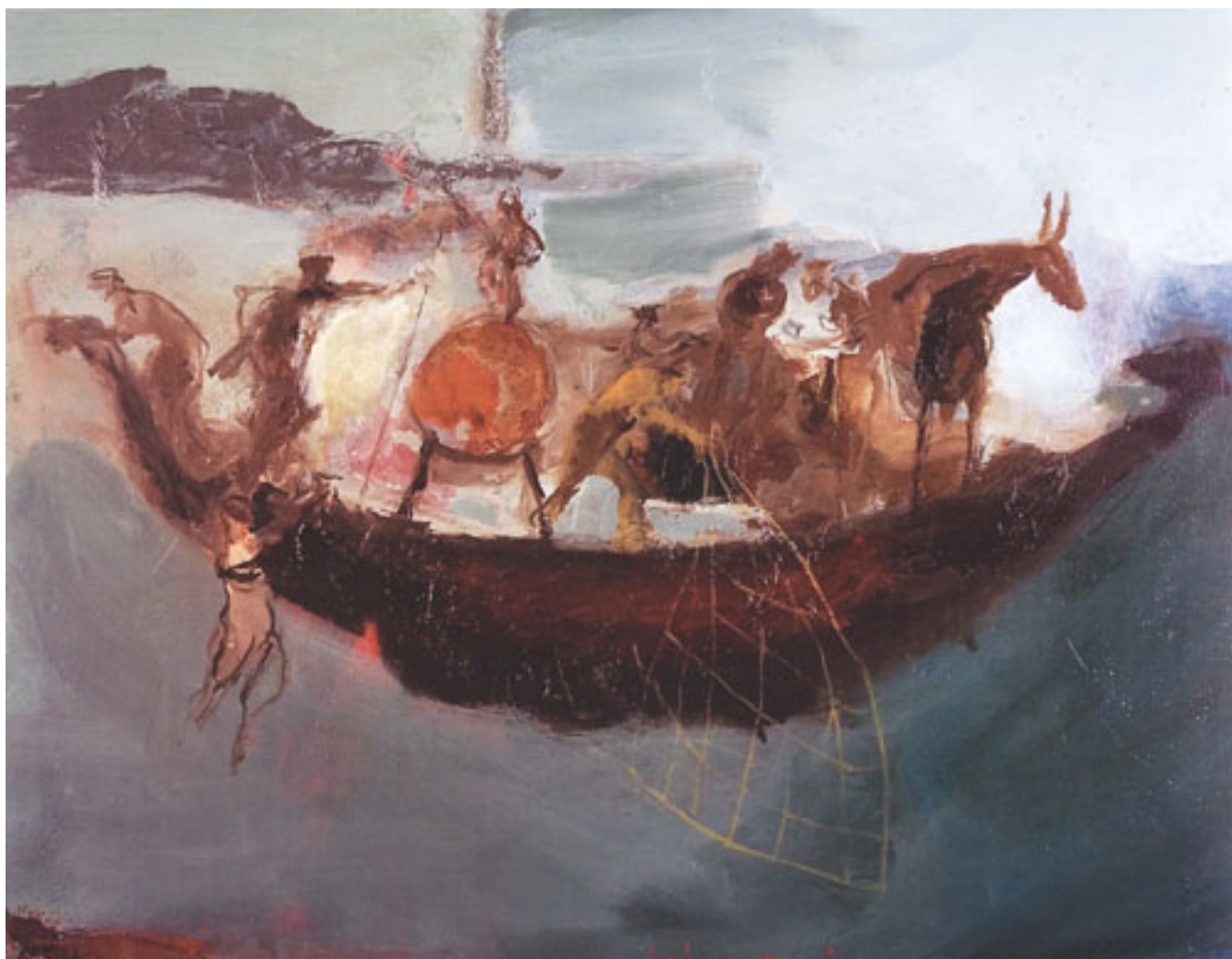
DEPART A L'AUBE