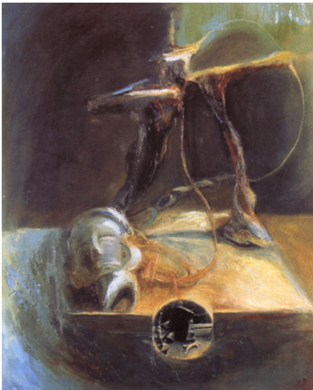
EL ARQUERO DE LOGOS