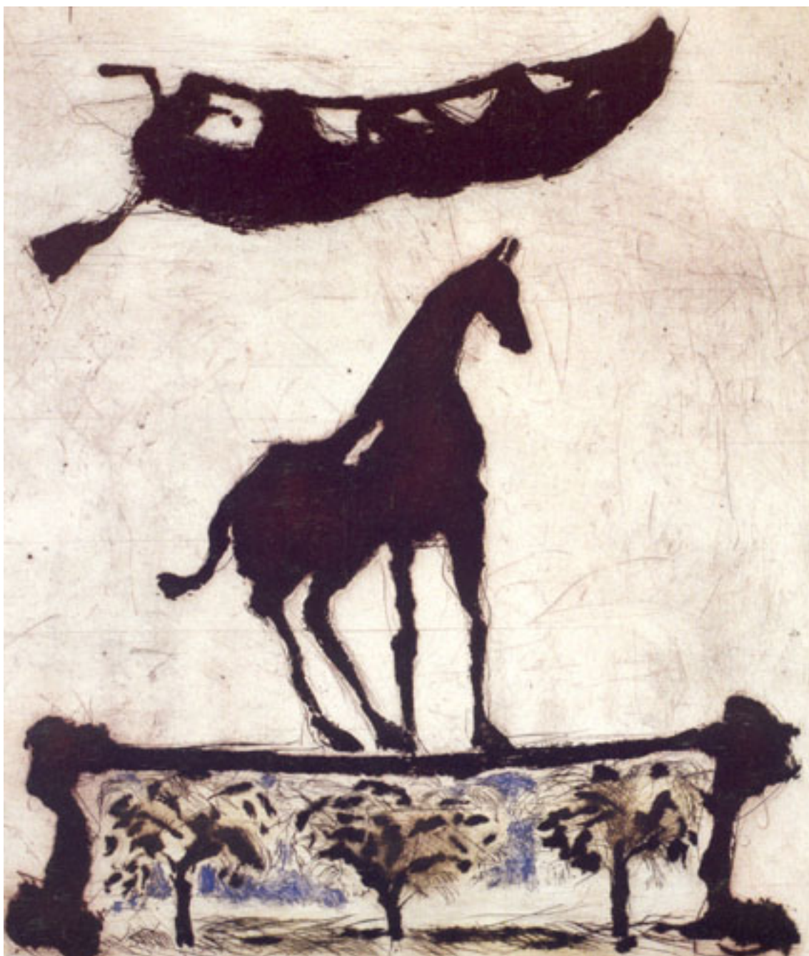
BARQUE CHEVAL ET ARBES