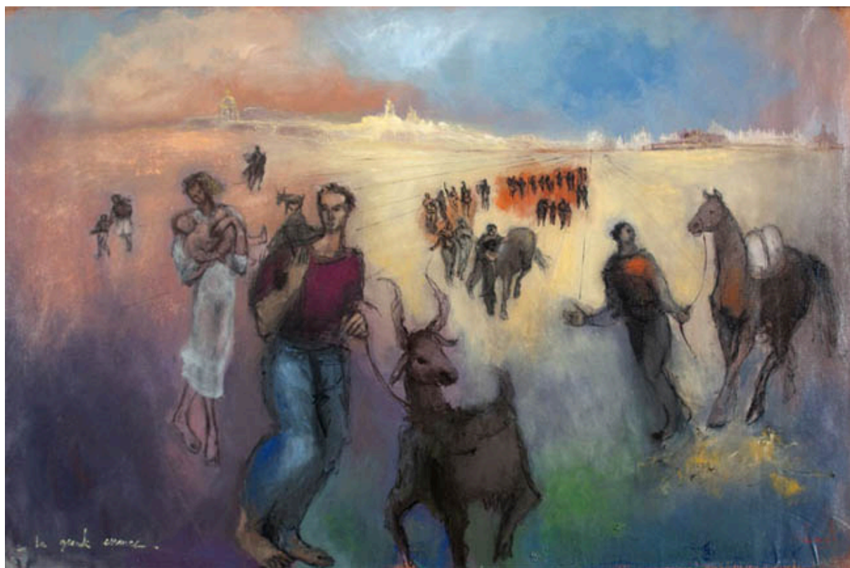
LA GRANDE ERRANCE