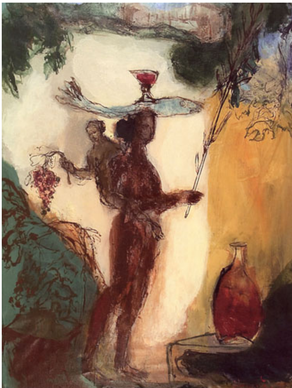
LA DAME A LA COUPE