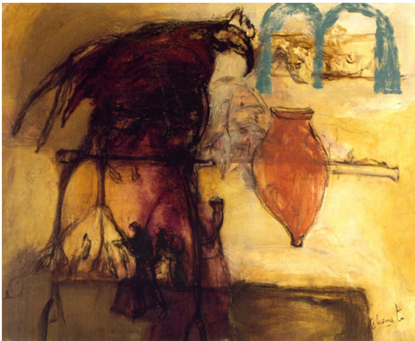
L'AIGLE ET LE VASE