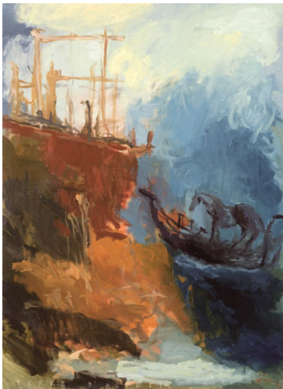
TERRE D ACCUEIL