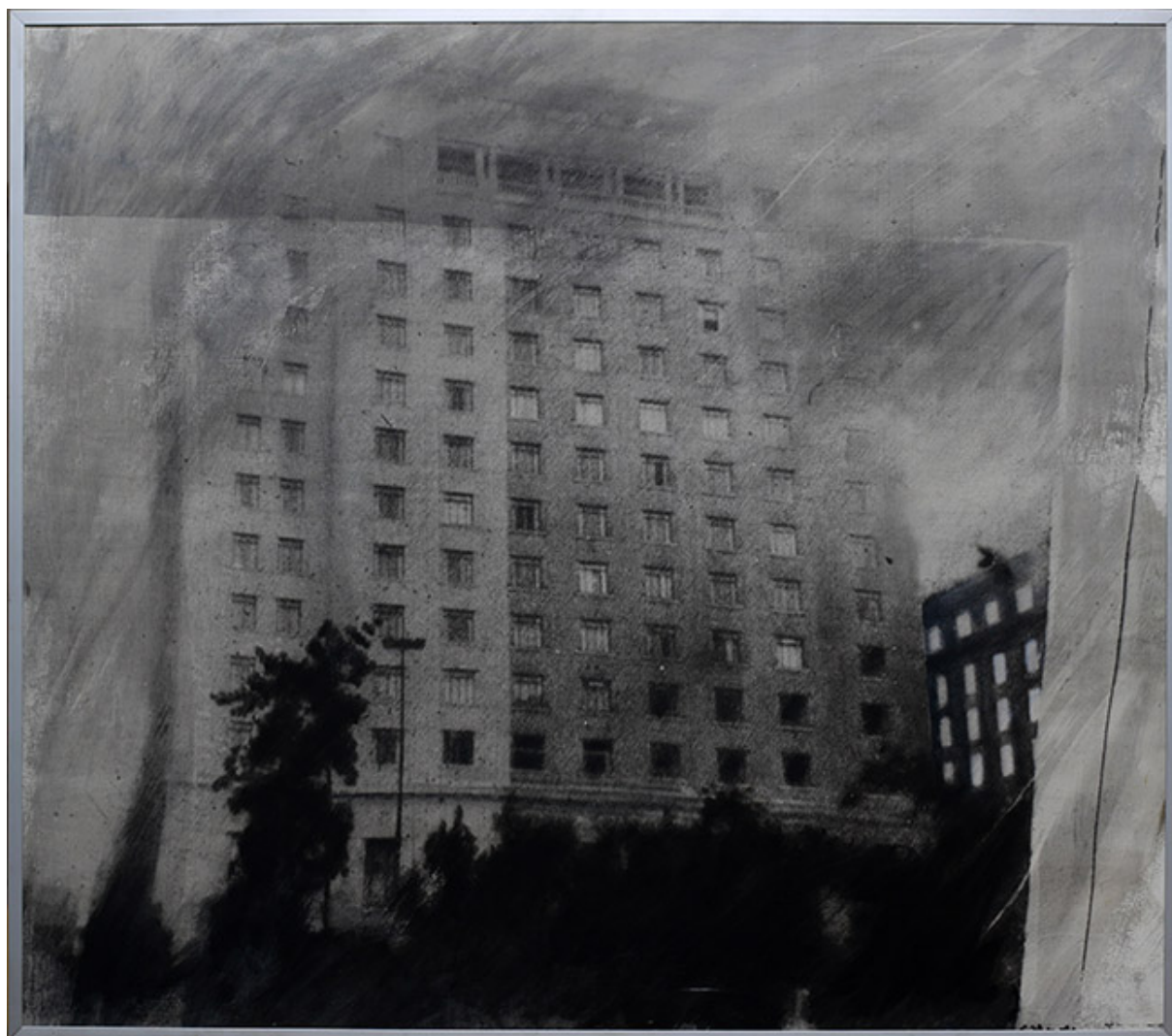
HOTEL CARRERA, DE LA SERIE PICTOGRÁFICA DE SANTIAGO