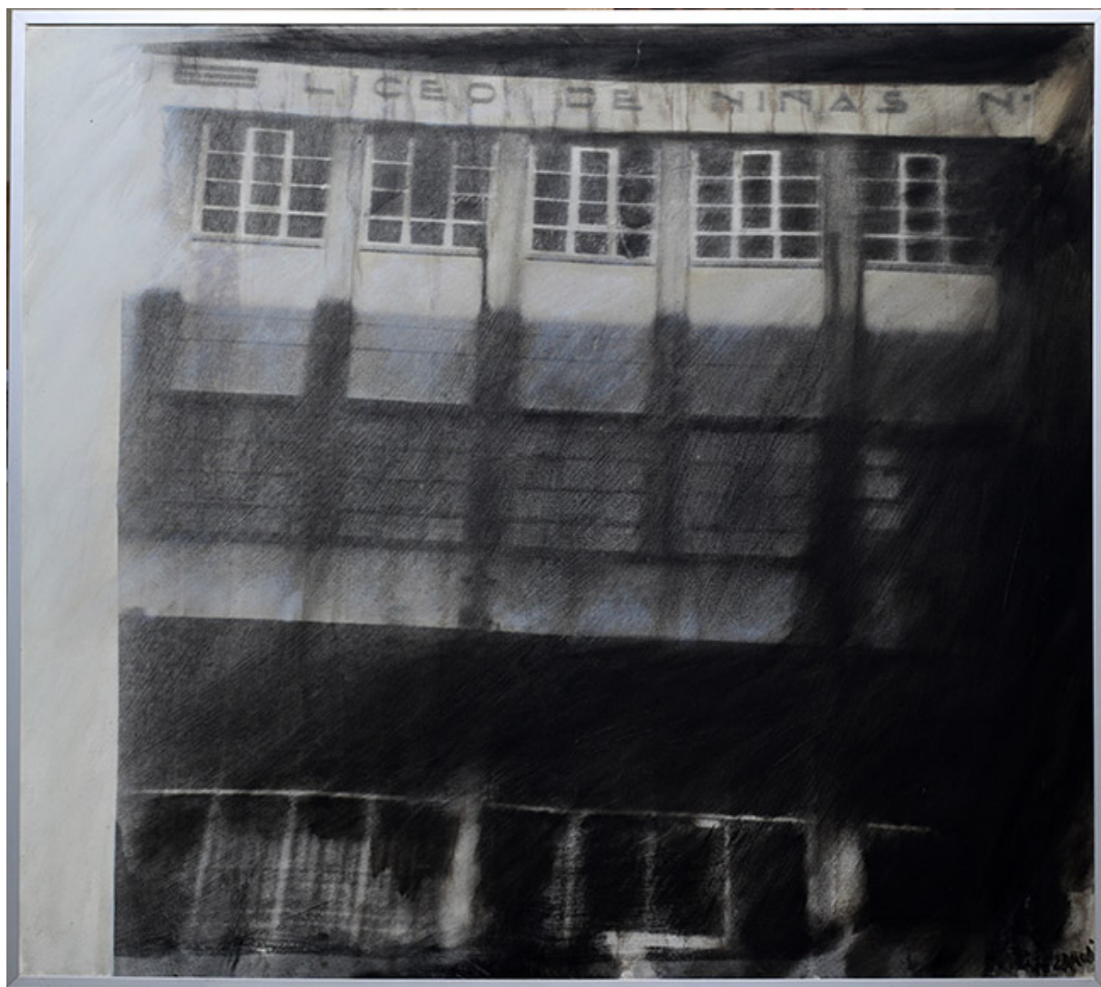
LICEO DE NIÑAS, DE LA SERIE PICTOGRÁFICA DE SANTIAGO