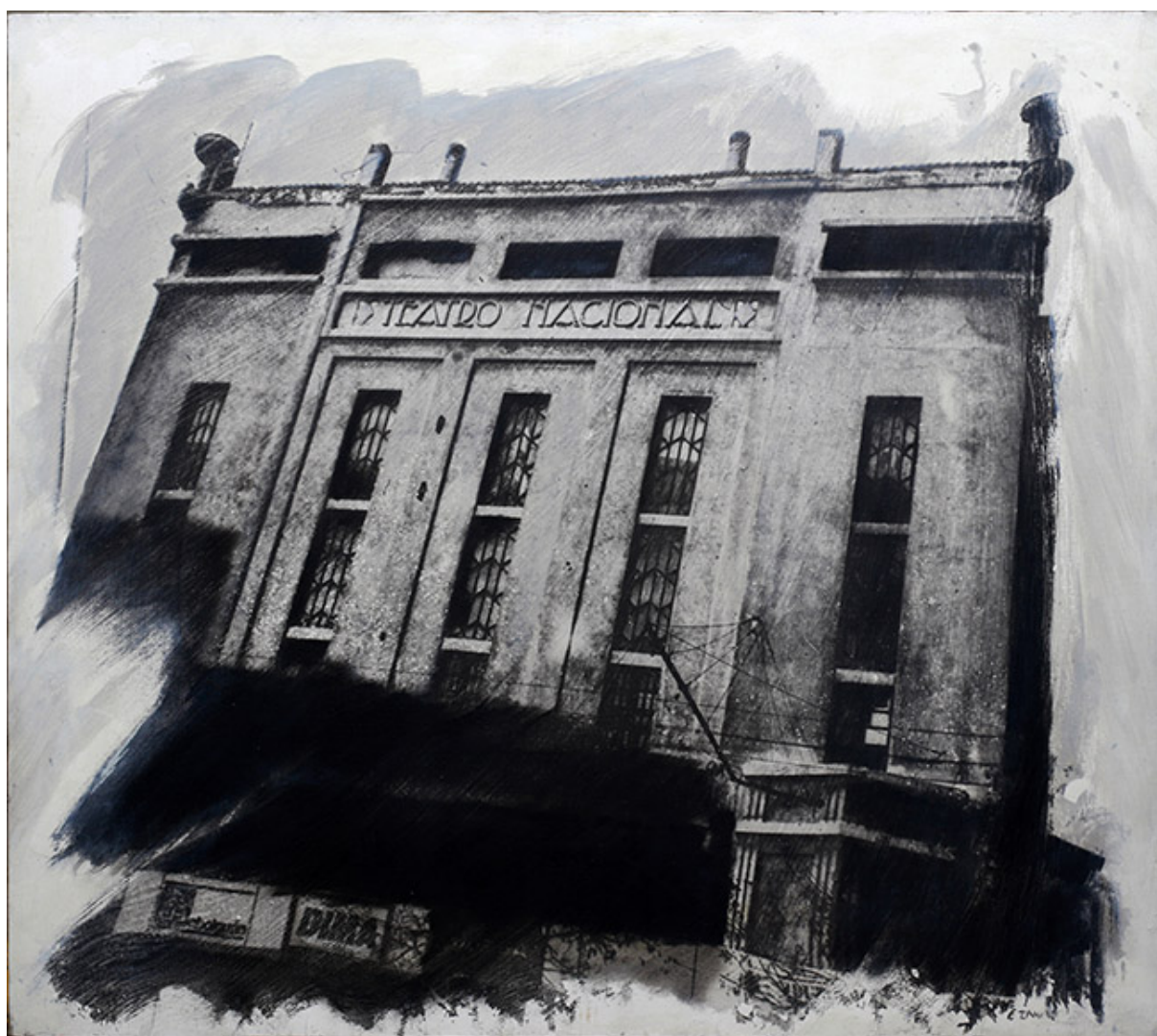
TEATRO NACIONAL, DE LA SERIE PICTOGRÁFICA DE SANTIAGO