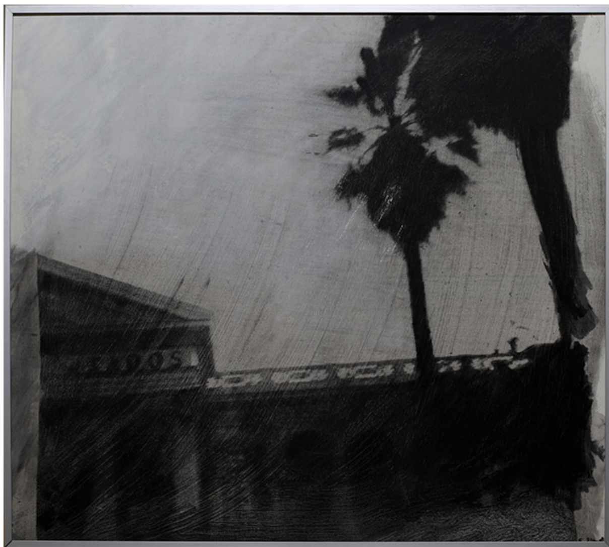
EL CONGRESO, DE LA SERIE PICTOGRÁFICA DE SANTIAGO