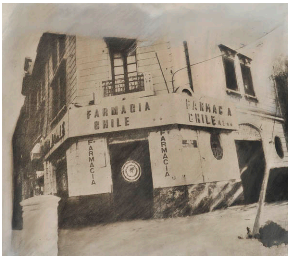
FARMACIA CHILE, DE LA SERIE PICTOGRÁFICA DE CHILE