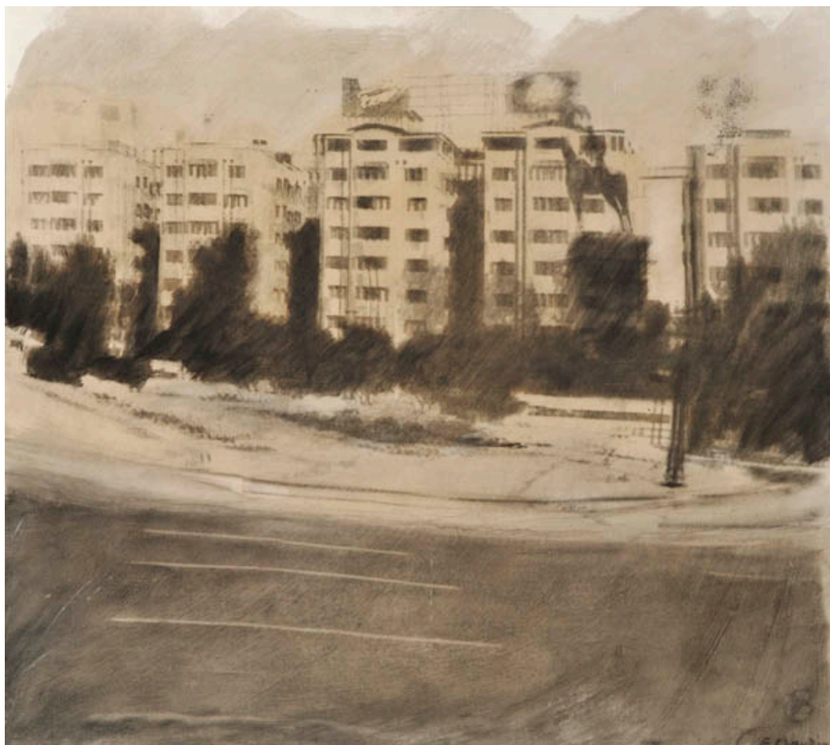
PLAZA BAQUEDANO, DE LA SERIE PICTOGRÁFICA DE SANTIAGO