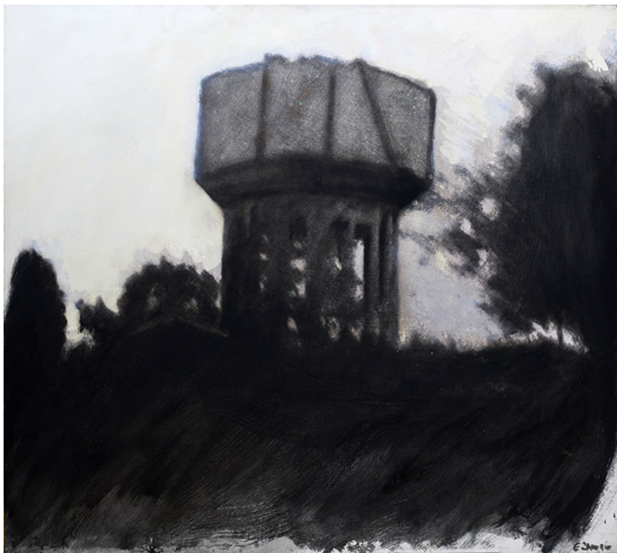
COPA DE AGUA, DE LA SERIE PICTOGRÁFICA DE SANTIAGO