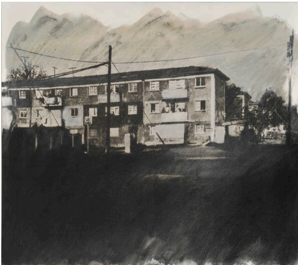
POBLACIÓN JUAN ANTONIO RÍOS, DE LA SERIE PICTOGRÁFICA DE SANTIAGO

WAISSBLUTH, Verónica, 2007. Cuño y estampa en torno al grabado chileno II . Santiago de Chile: Entel.