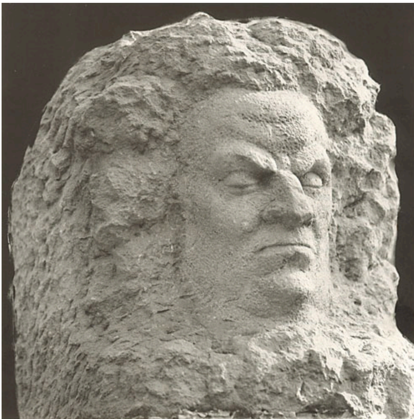
CABEZA DE AUGUSTO D'HALMAR