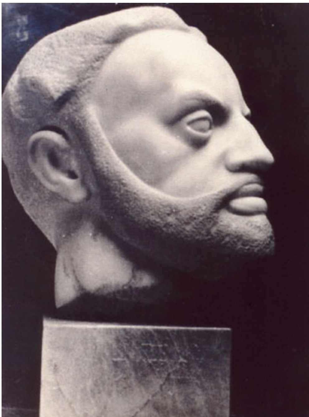
MONUMENTO A CALVO MAQUENA