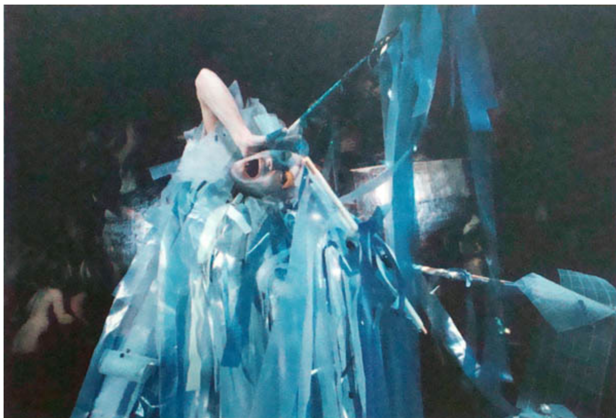
FIGURE D'ACQUA (registro fotográfico de performance)