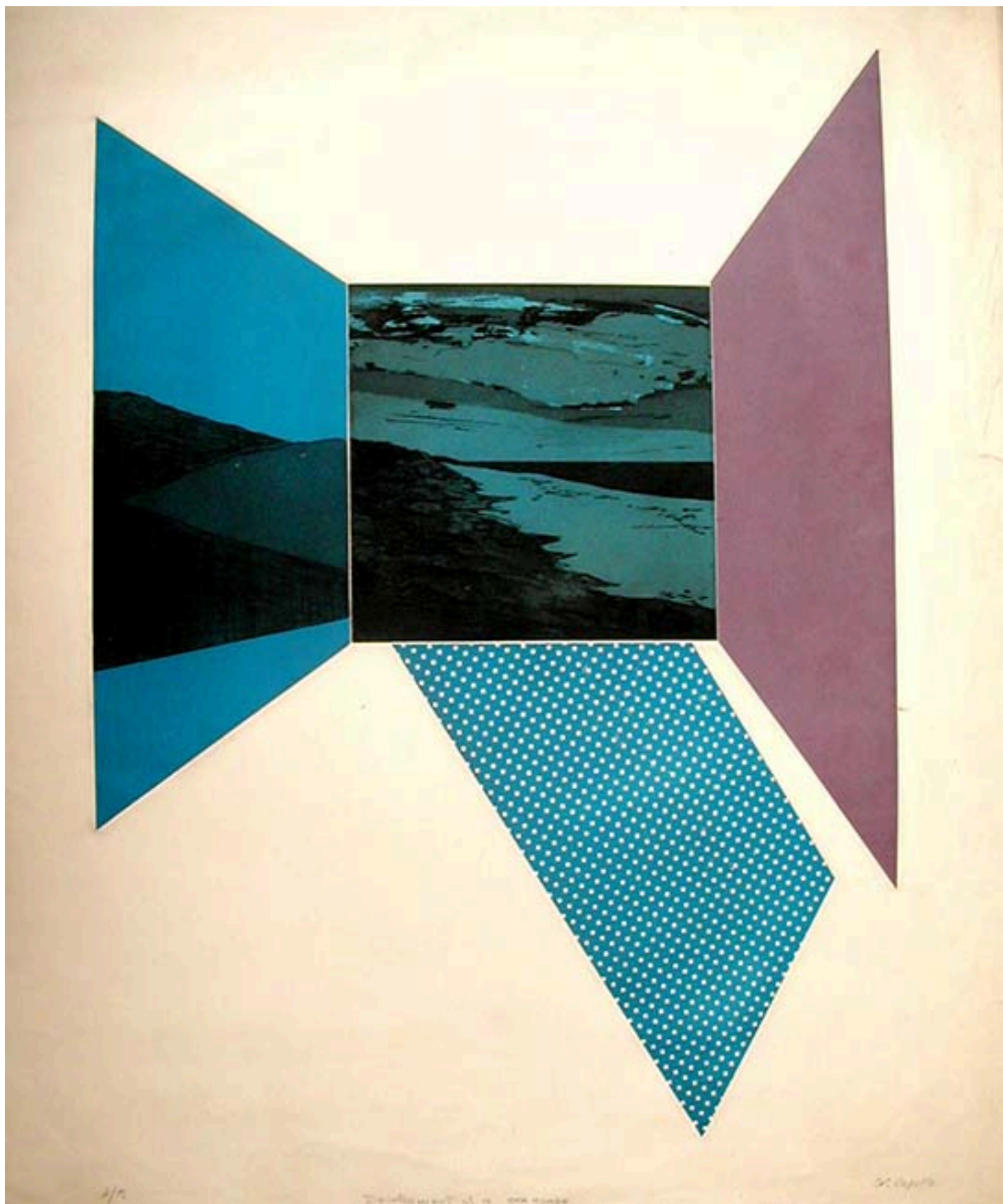
DEVELOPMENT OF SEA SERGE