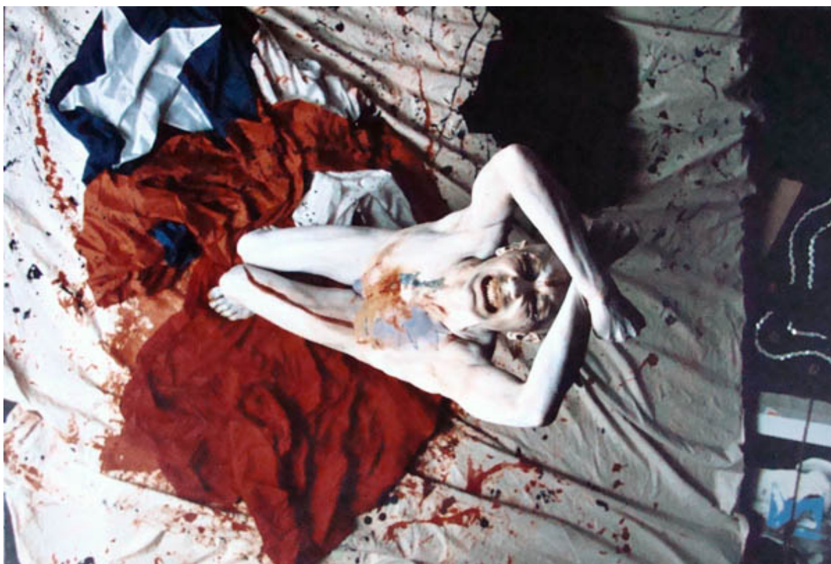
LA PARTIDA (registro fotográfico de performance)