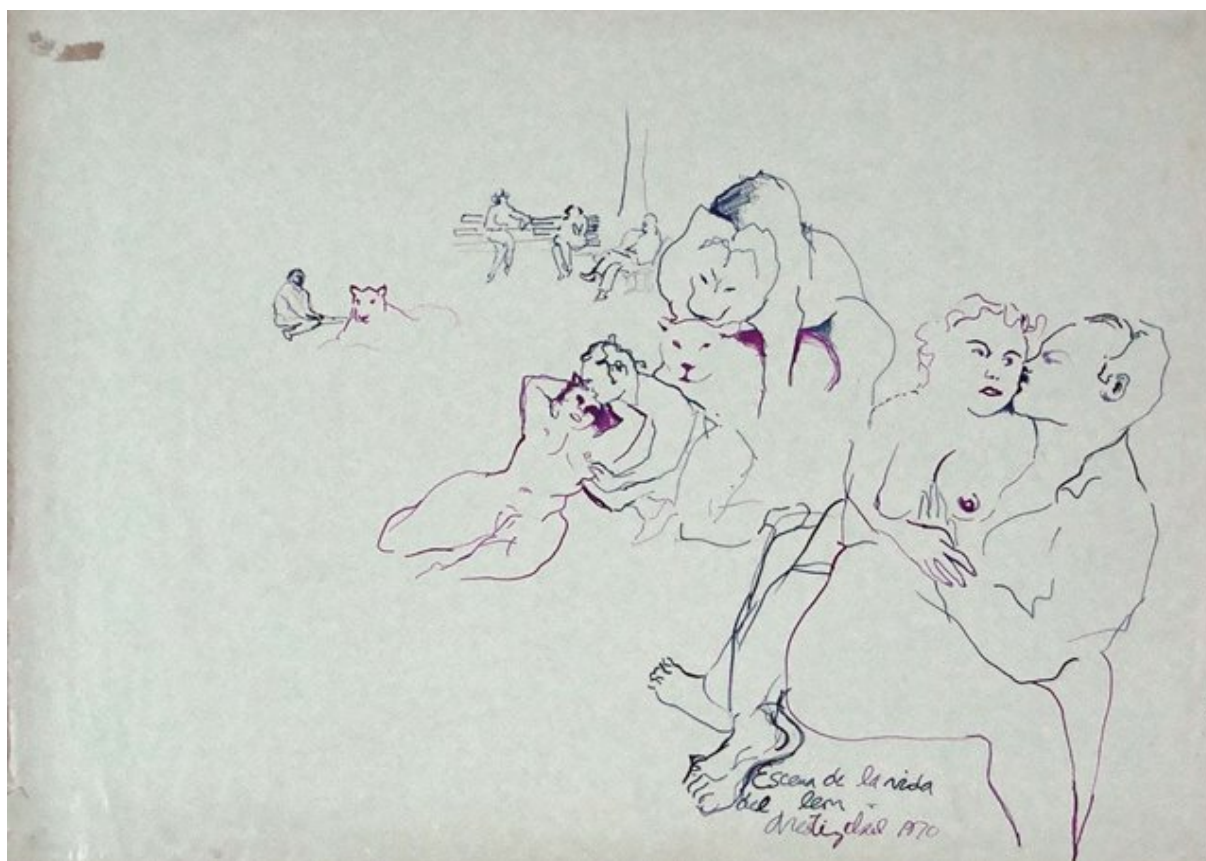
ESCENA DE LA VIDA DEL LEÓN

UNIVERSIDAD DE CHILE. Exposición de Arte Contemporáneo. Santiago, 1968.