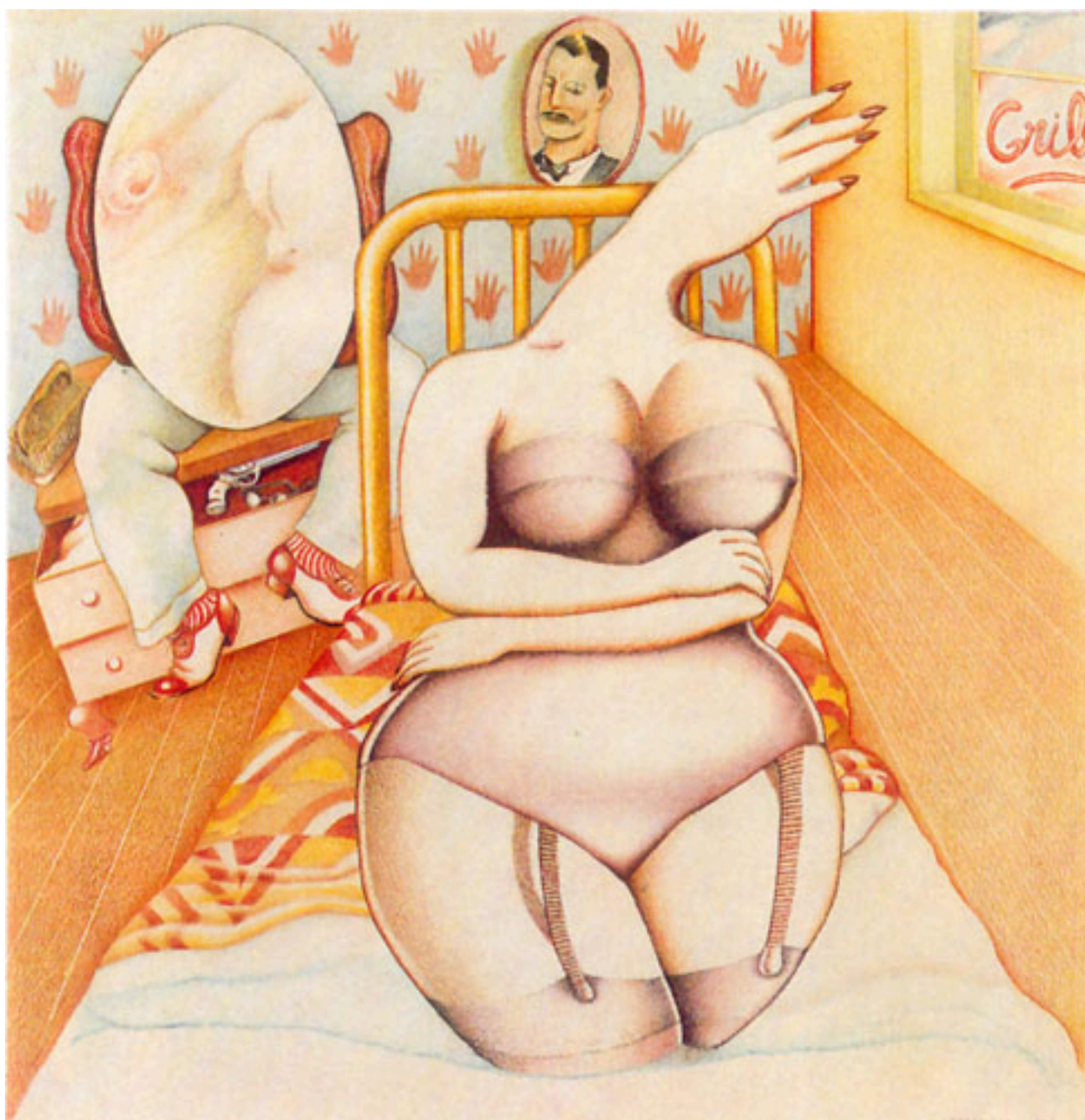
ELLA CANTABA BOLEROS