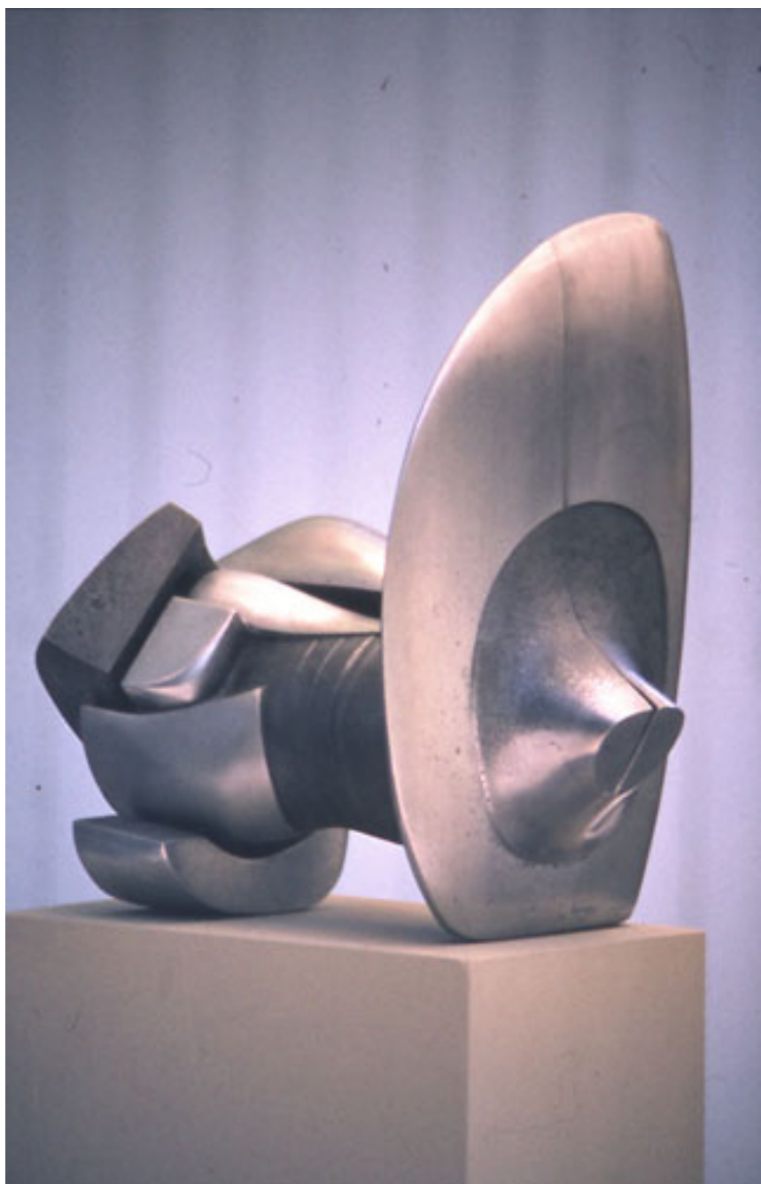
ARTEFACTO PARA DISUADIR