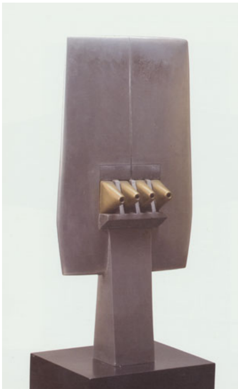
DE LA SERIE ANCESTRO