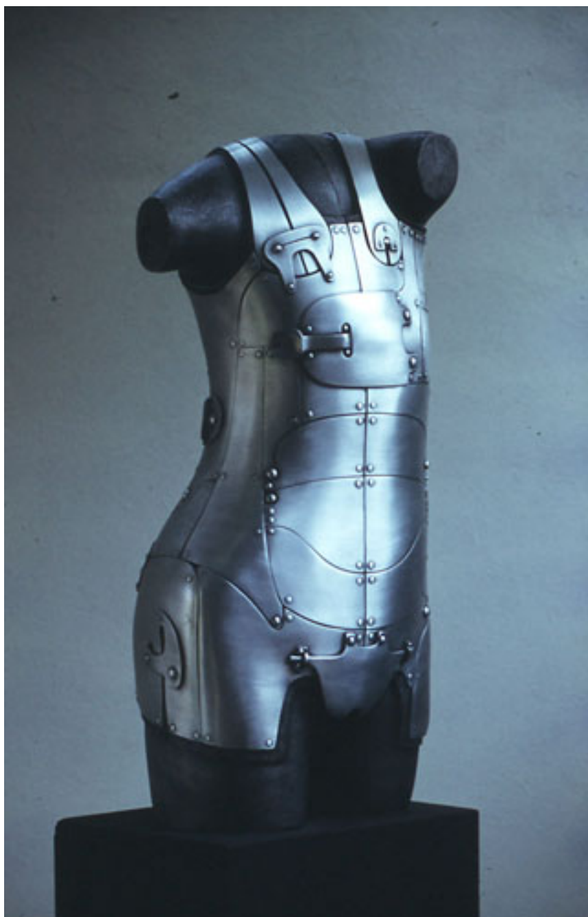
MI AMOR AGUERRIDO N°1