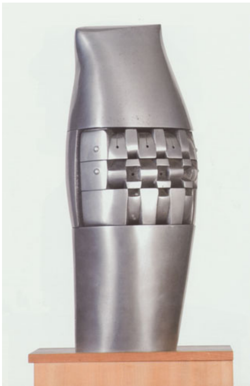
CABEZA BELIGERANTE I