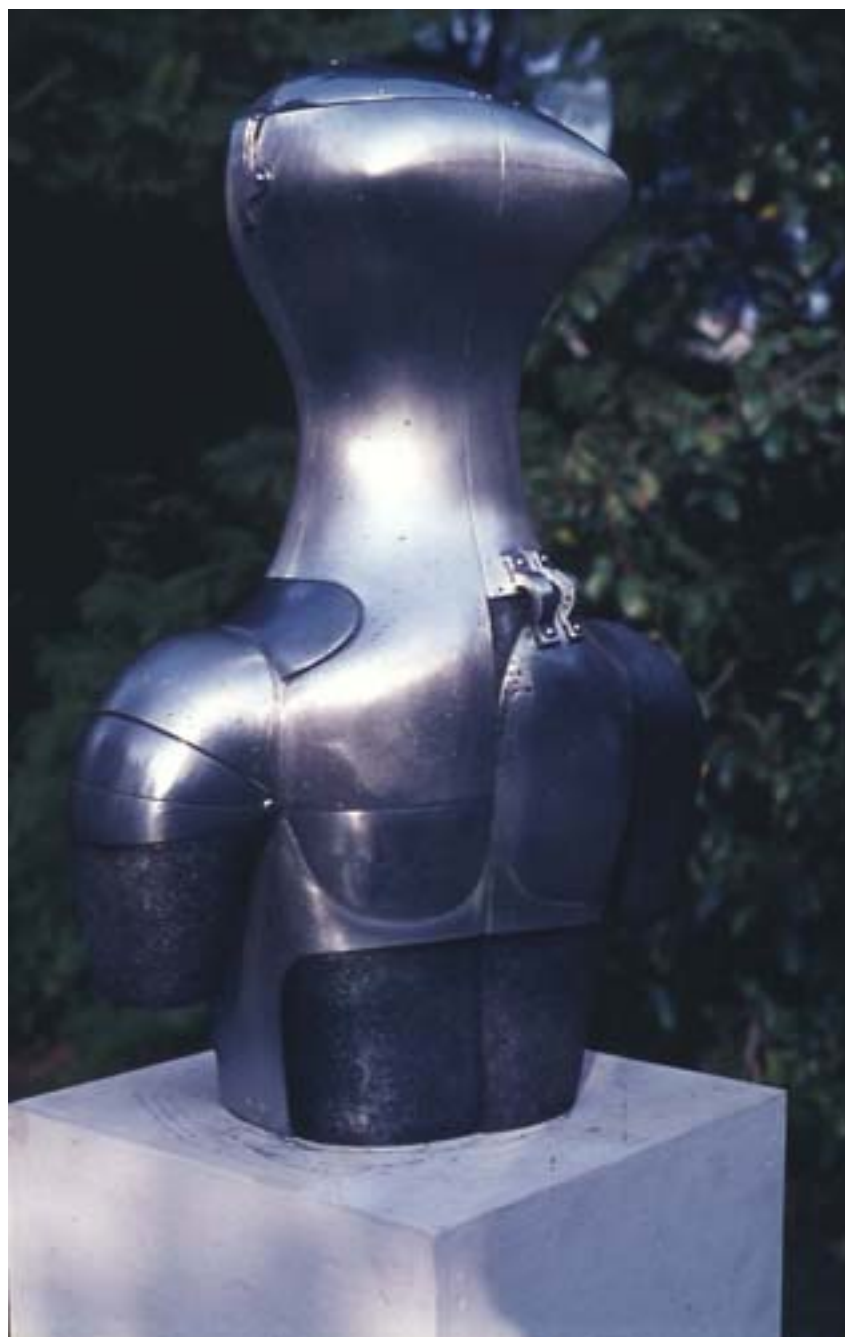
EL ABUELO SOLÍA IR A LA GUERRA