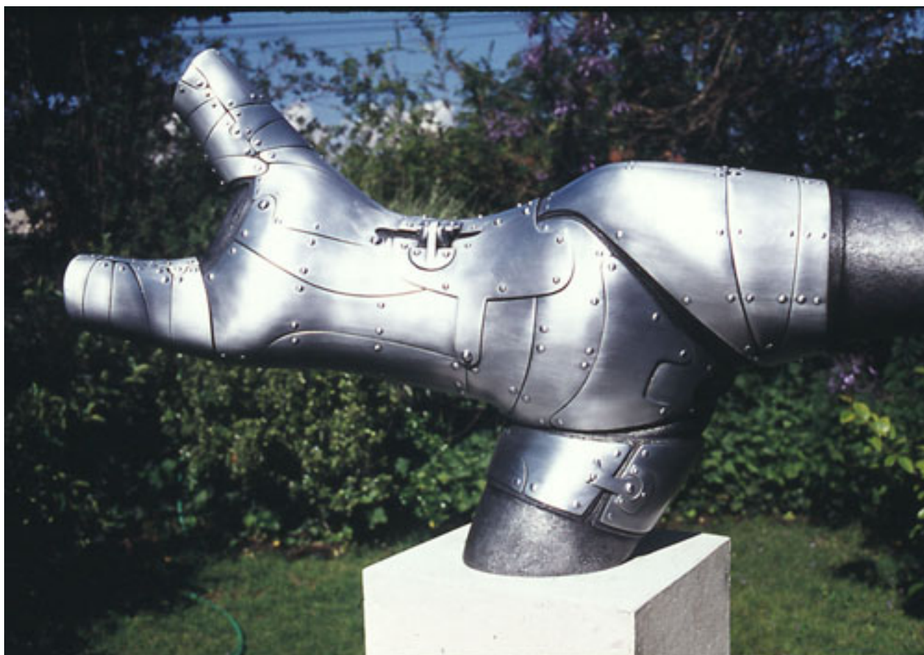
MI AMOR AGUERRIDO N°2