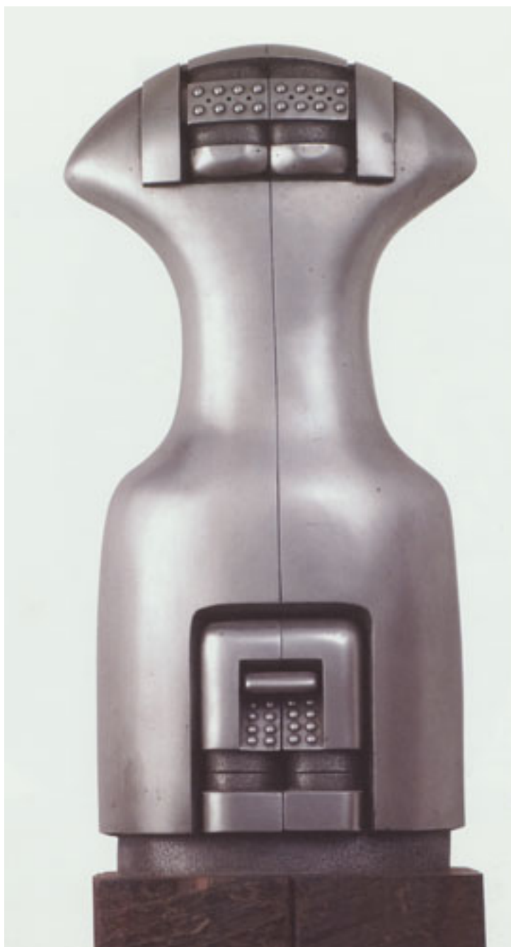
BLINDAJE PARA UN TORSO