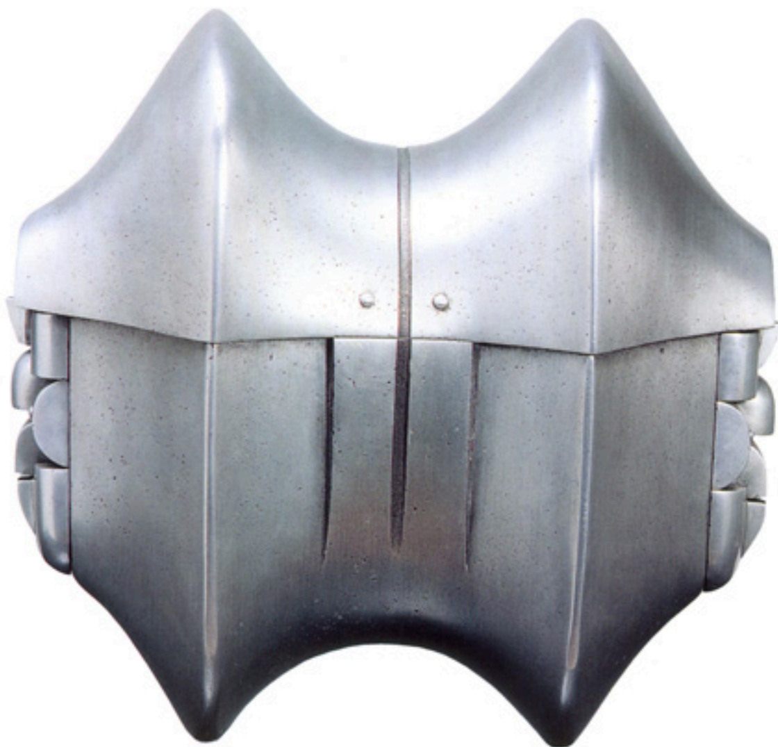
BLINDAJE PARA MI EGO