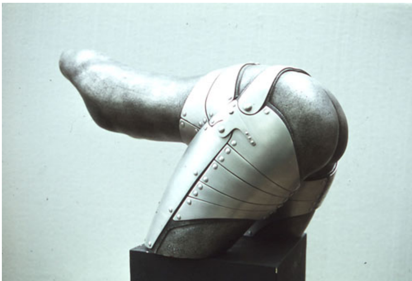
MI AMOR AGUERRIDO N°4