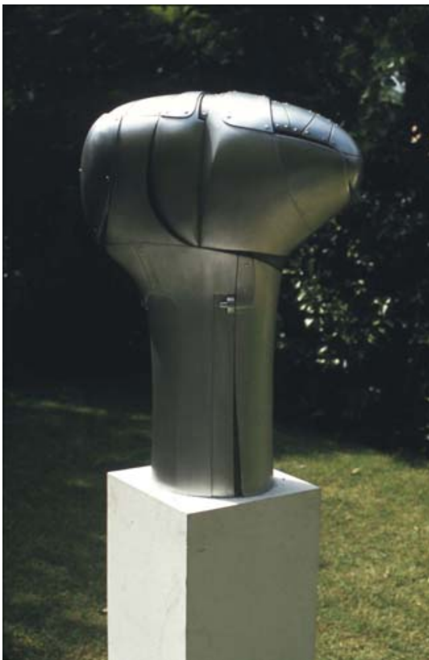
BLINDAJE PARA UN ORGANISMO