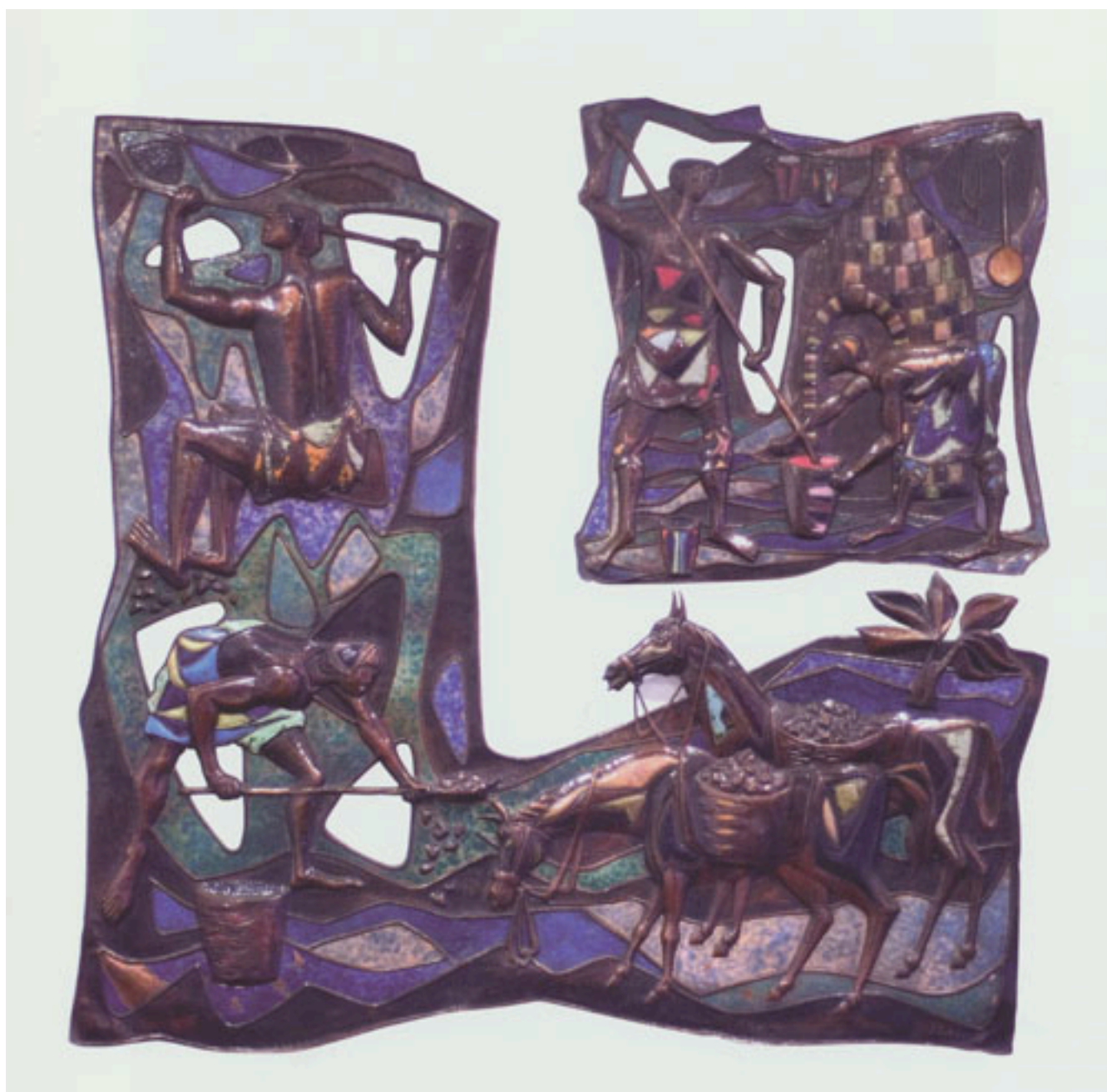
MURAL EL MINERO CHILENO