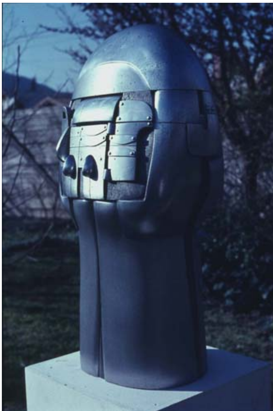
UN TESTIGO PARA LA VIOLENCIA