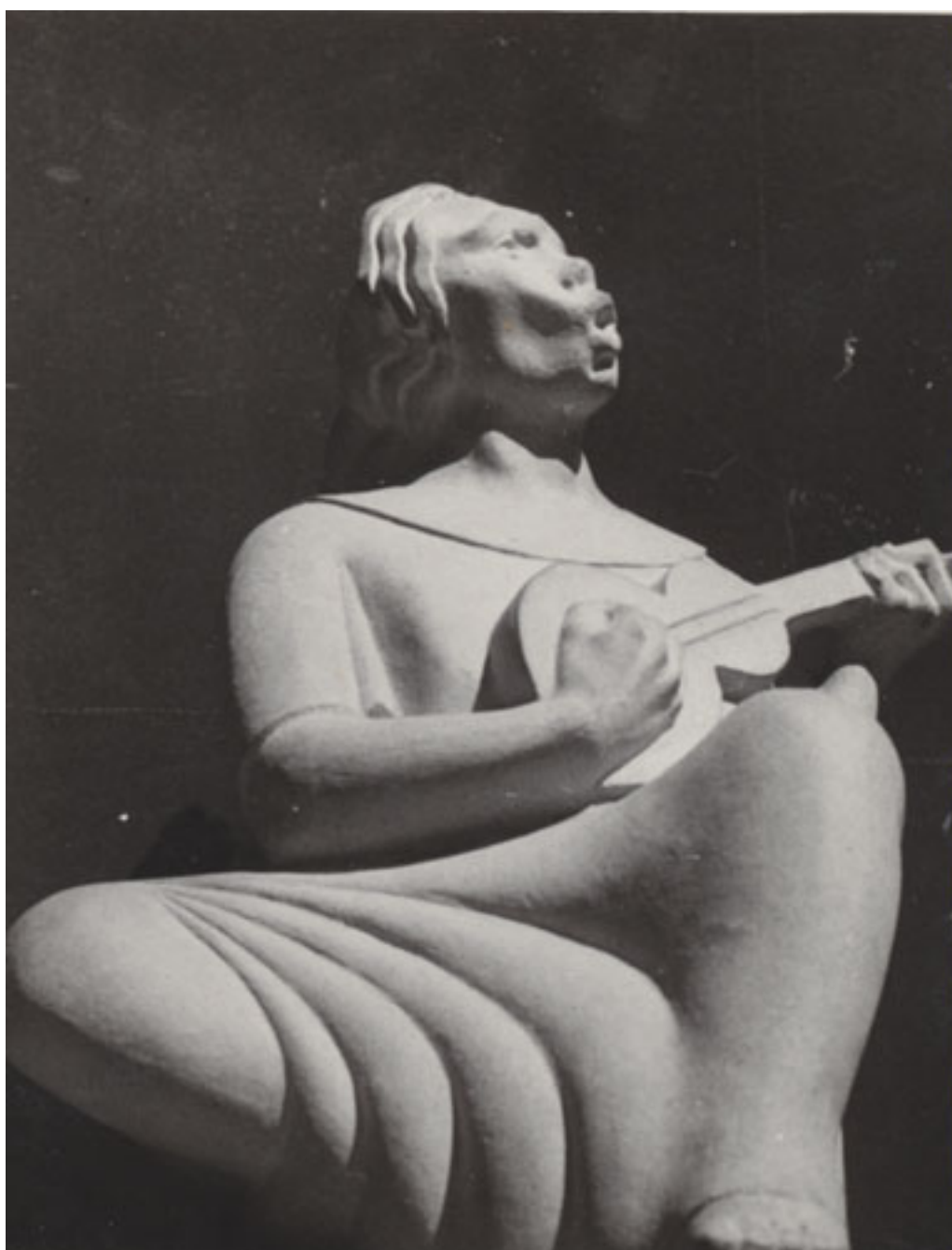
MUJER TOCANDO GUITARRA