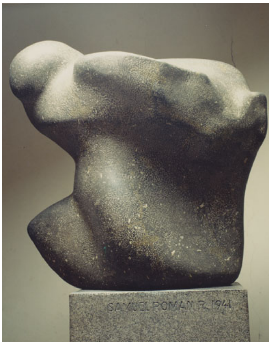
EL VIENTO DE AMÉRICA