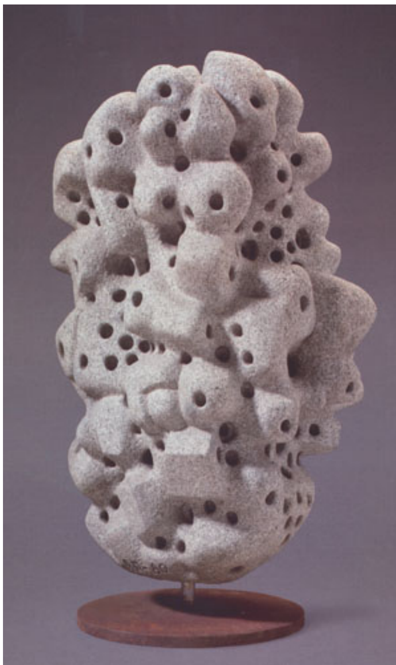
NIDO DE OJOS