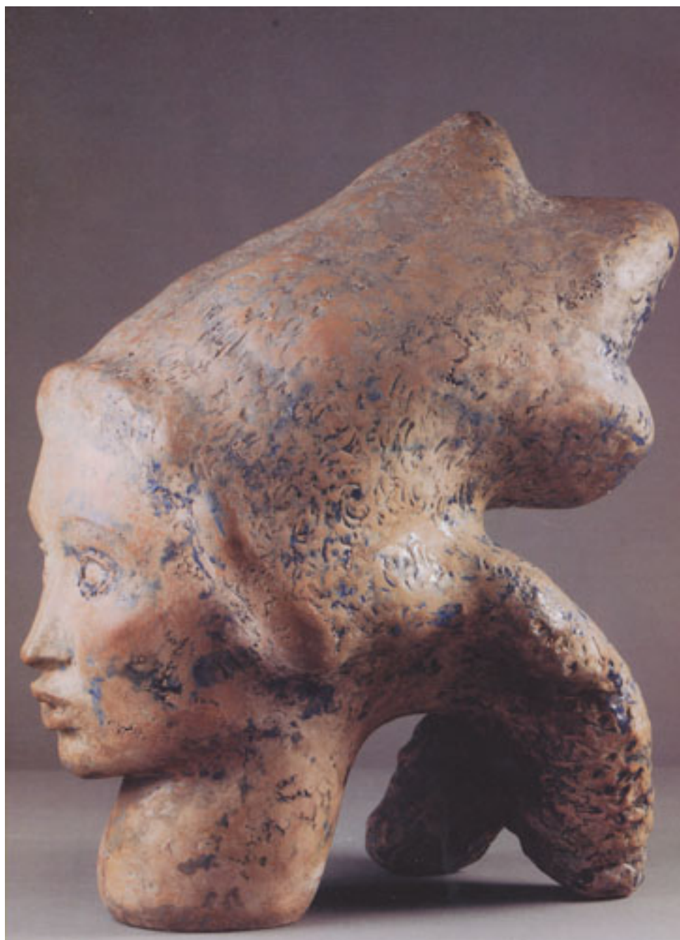
HECHIZO DE FUEGO