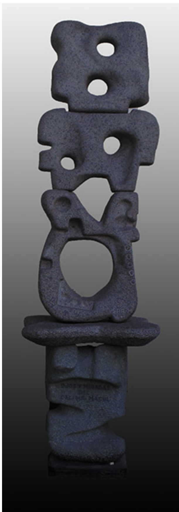
OJOS Y MIRADAS DEL CACIQUE MACUL