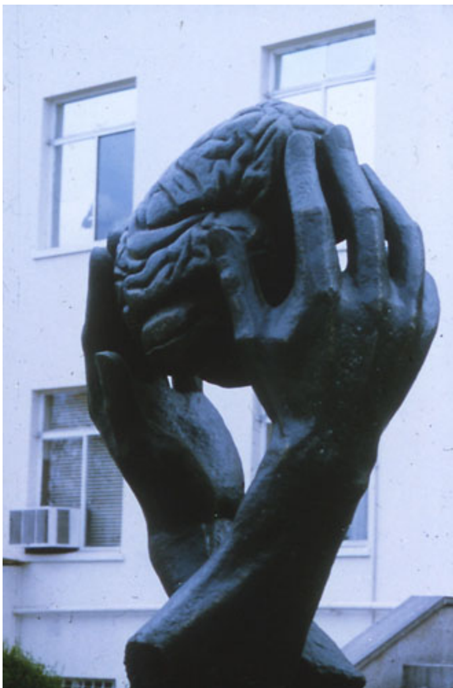
HOMENAJE A LA NEUROCIRUGÍA