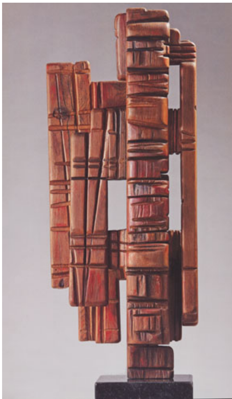
ARIKI (HOMENAJE A HOTU MATU'A)