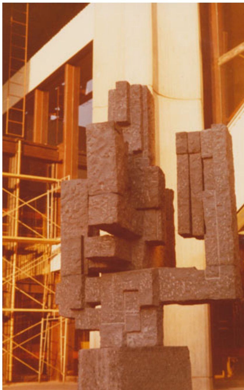
ÁRBOL DE LA VIDA