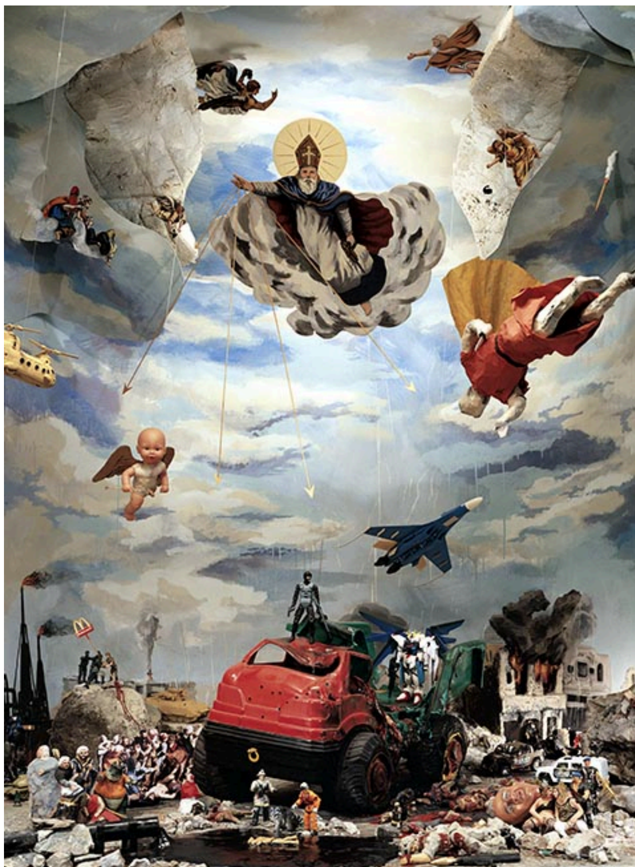
LA CAÍDA DEL ORDEN