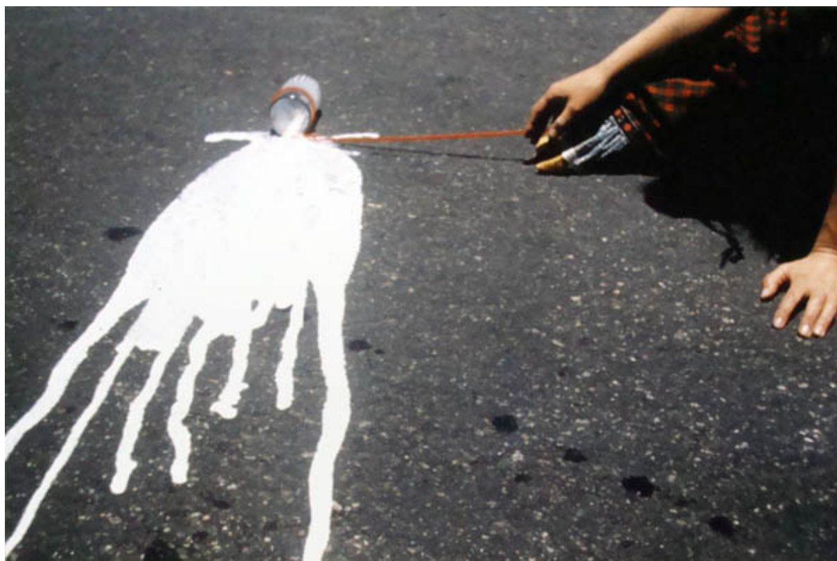
VASO DE LECHE (Registro fotográfico de intervención)