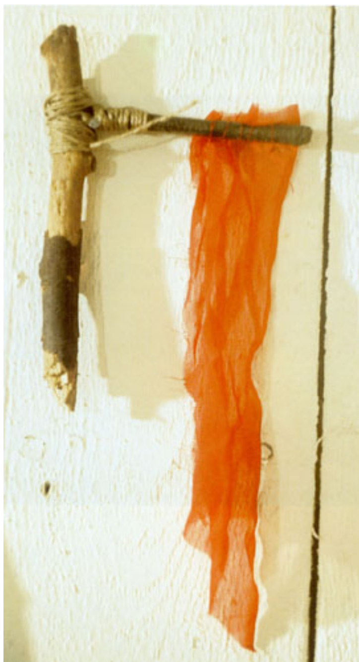
PAÑO E' SANGRE