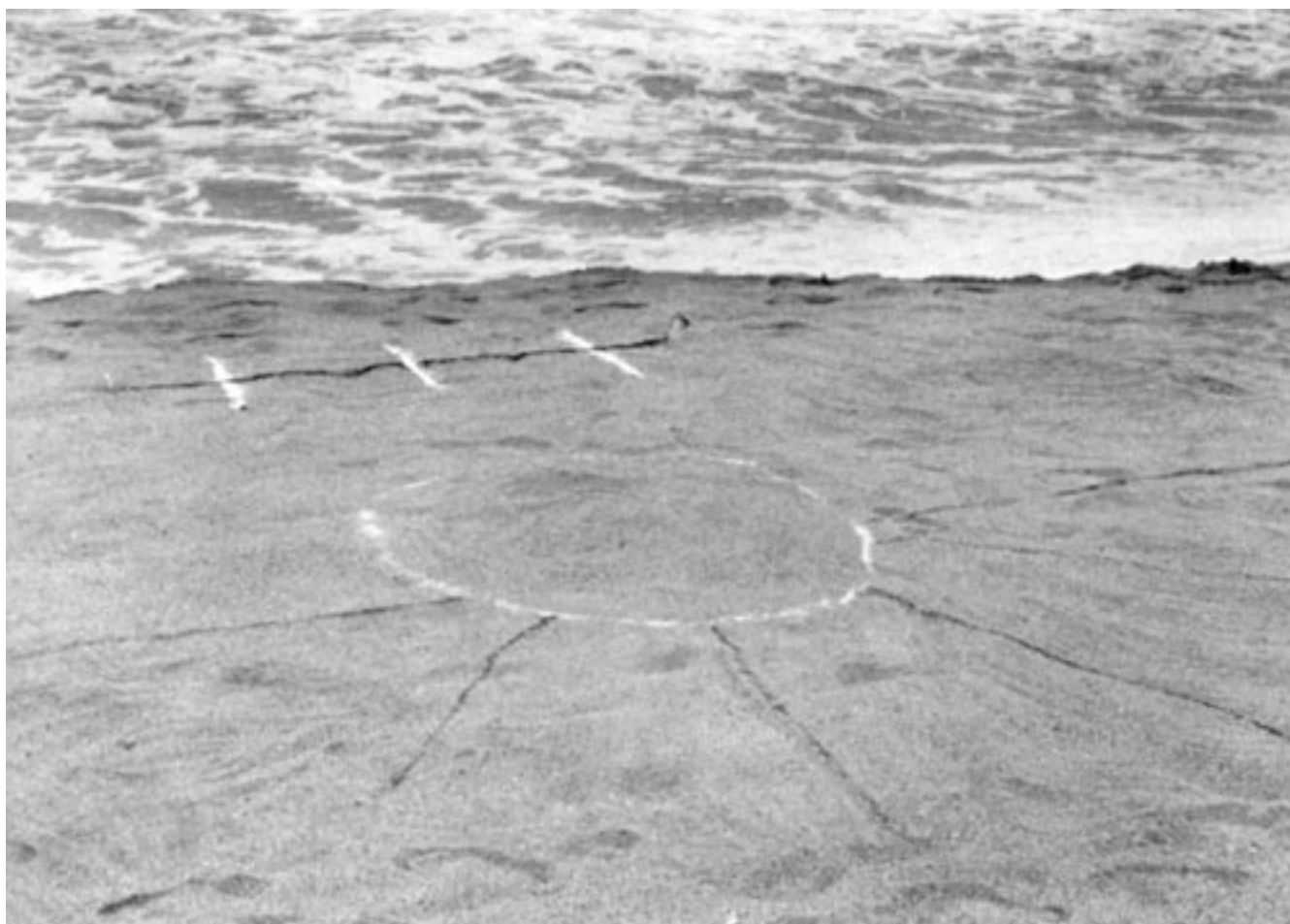
TUNQUÉN (Registro fotográfico de intervención)