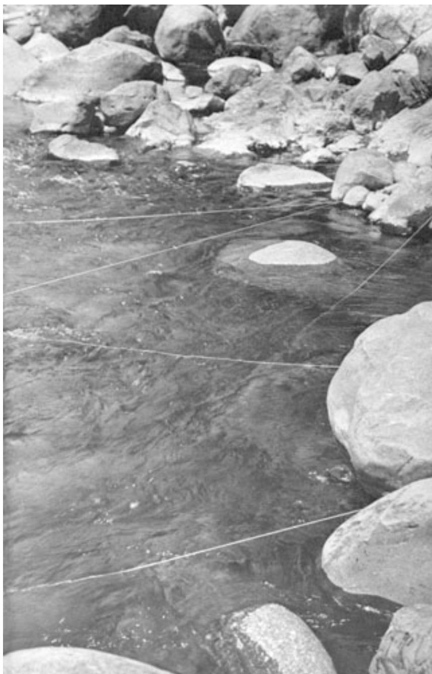
DEBAJO O ENCIMA DEL AGUA (Registro fotográfico de intervención)