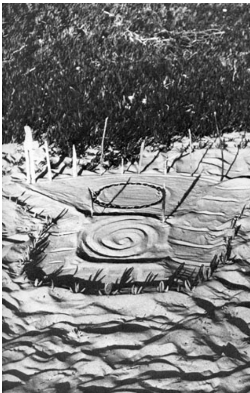
CASA ESPIRAL (Registro fotográfico de intervención)