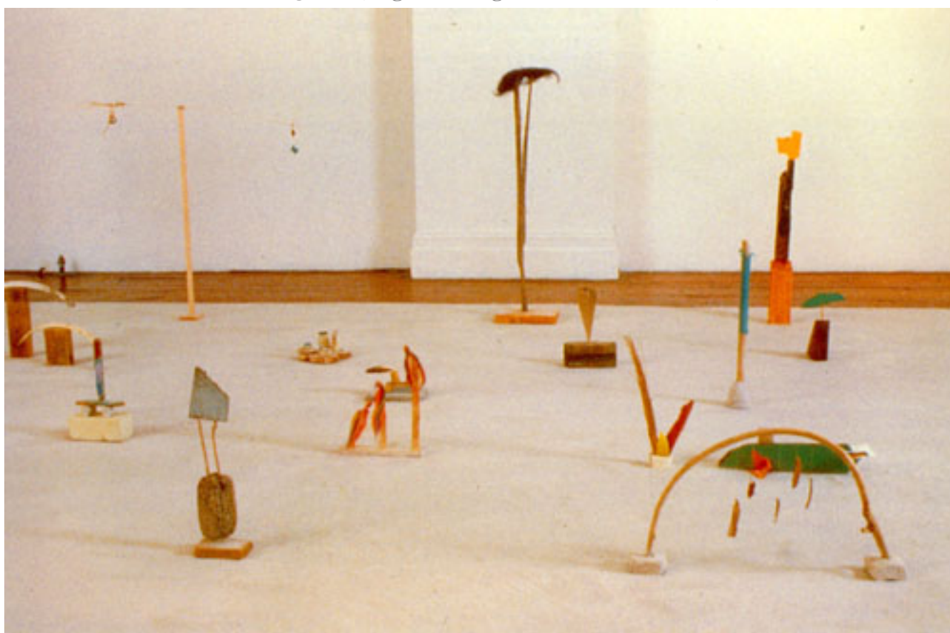
PUEBLO DE ALTARES (Registro fotográfico de instalación)