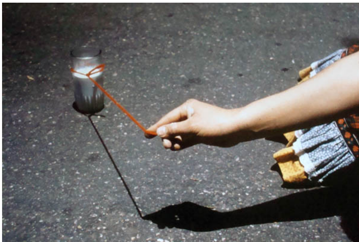
VASO DE LECHE (Registro fotográfico de intervención)