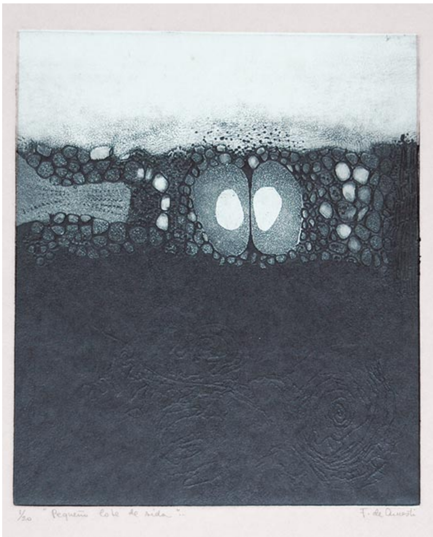
PEQUEÑO LOTE DE VIDA