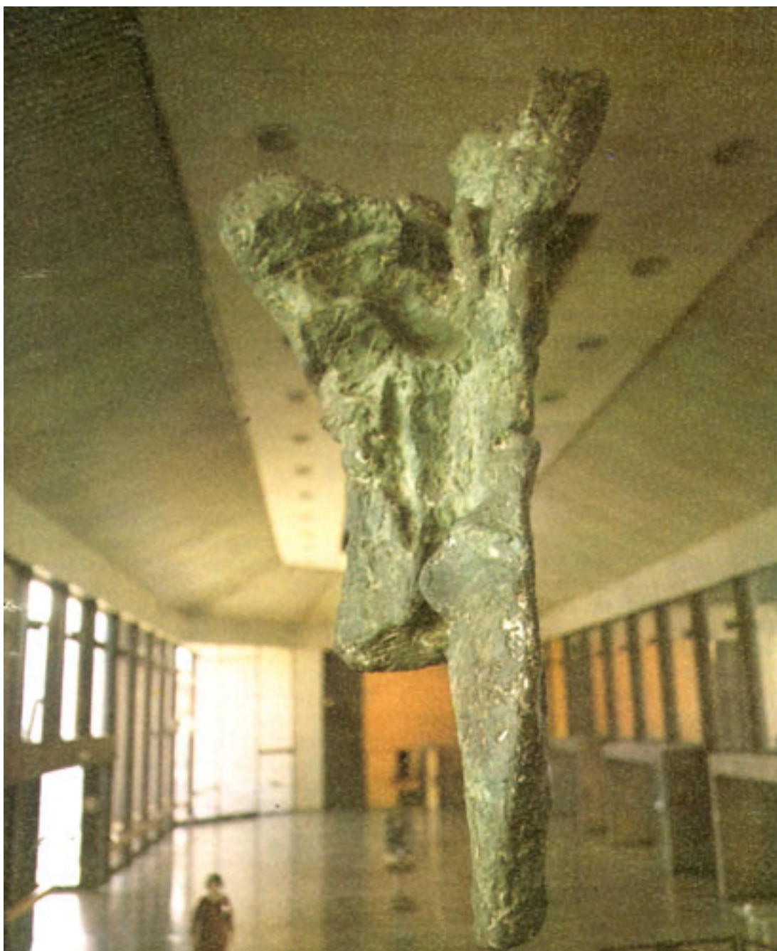
TORSO DE LA VICTORIA