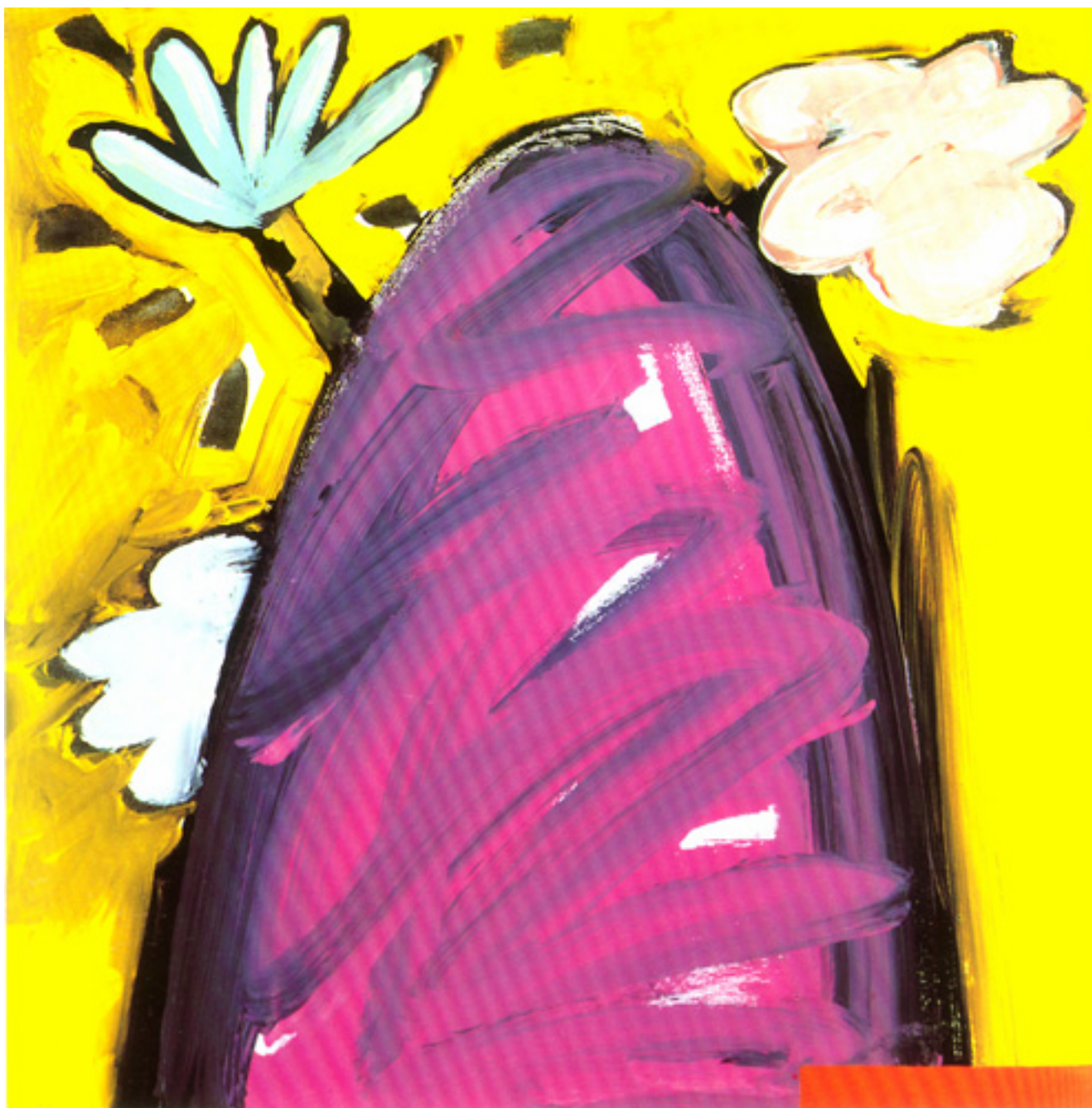
DIARIO, 19 DE AGOSTO 1986