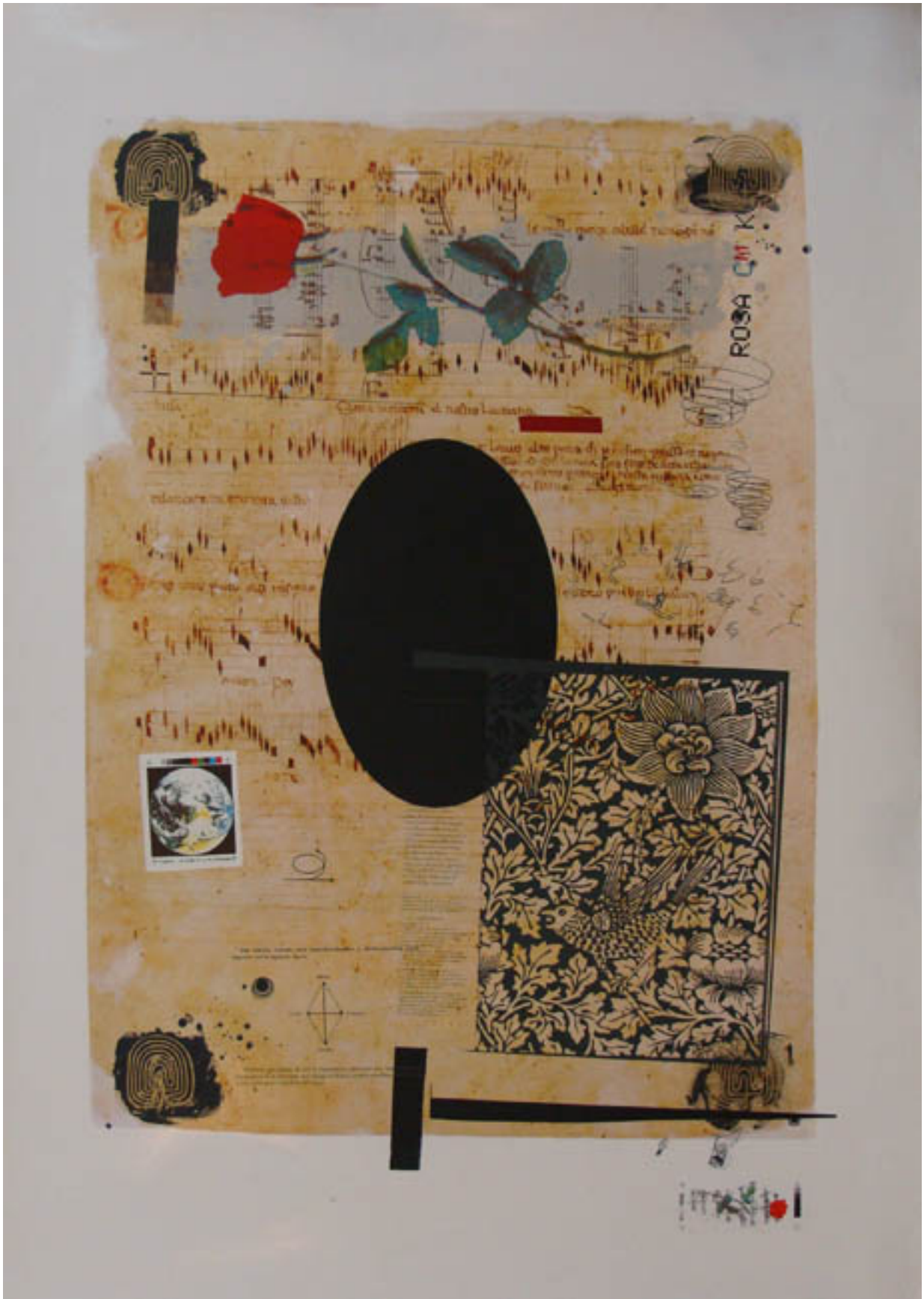
"ROSA" HOMBRE=NATURALEZA, PINCELADA=ALIENTO