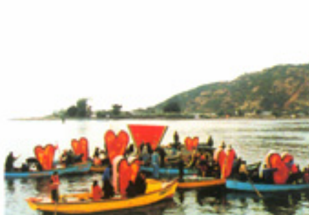
ACTO POÉTICO, PUERTO MONTT