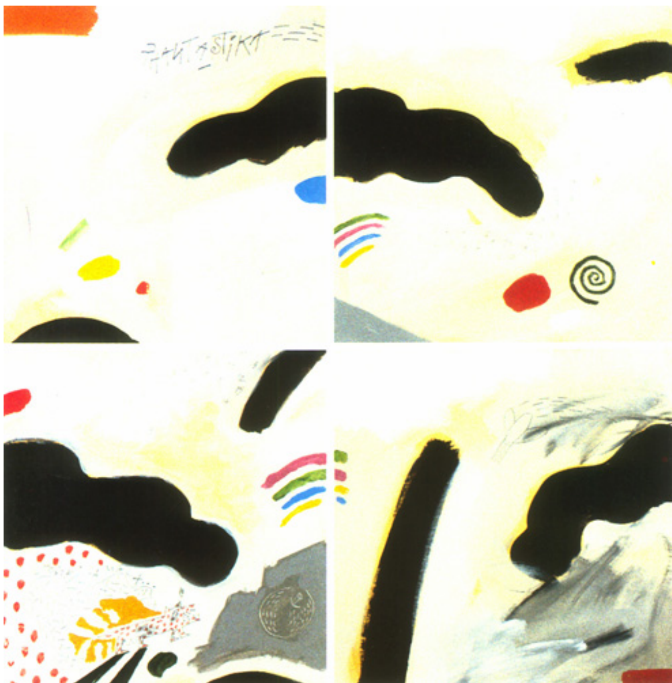
PHANTASTIKA: IL POETA E LA MELA