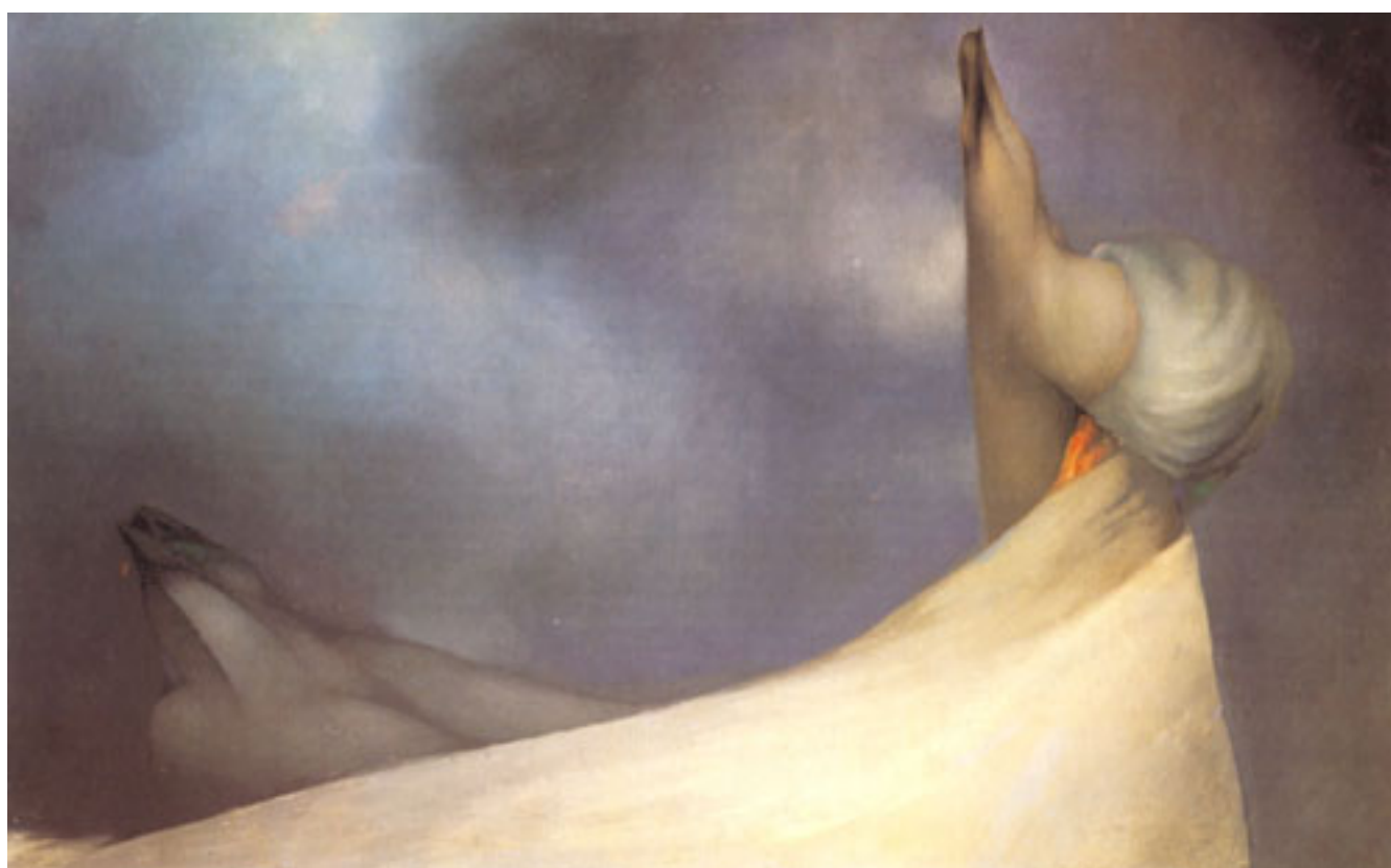
PRISIONEROS DE PIEDRA XXI