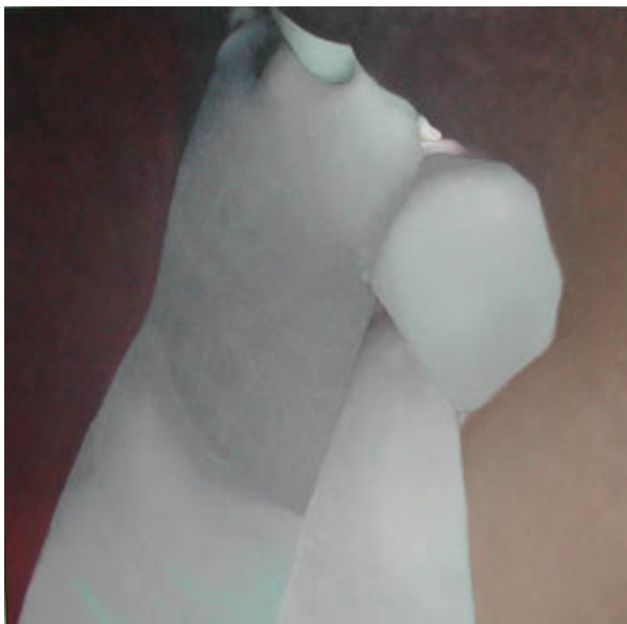
PRISIONERA DE PIEDRA