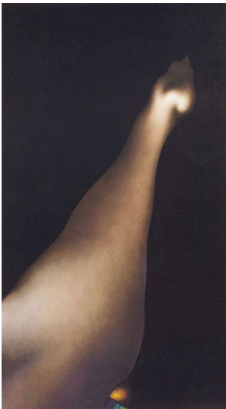
MUJER Y JOYAS