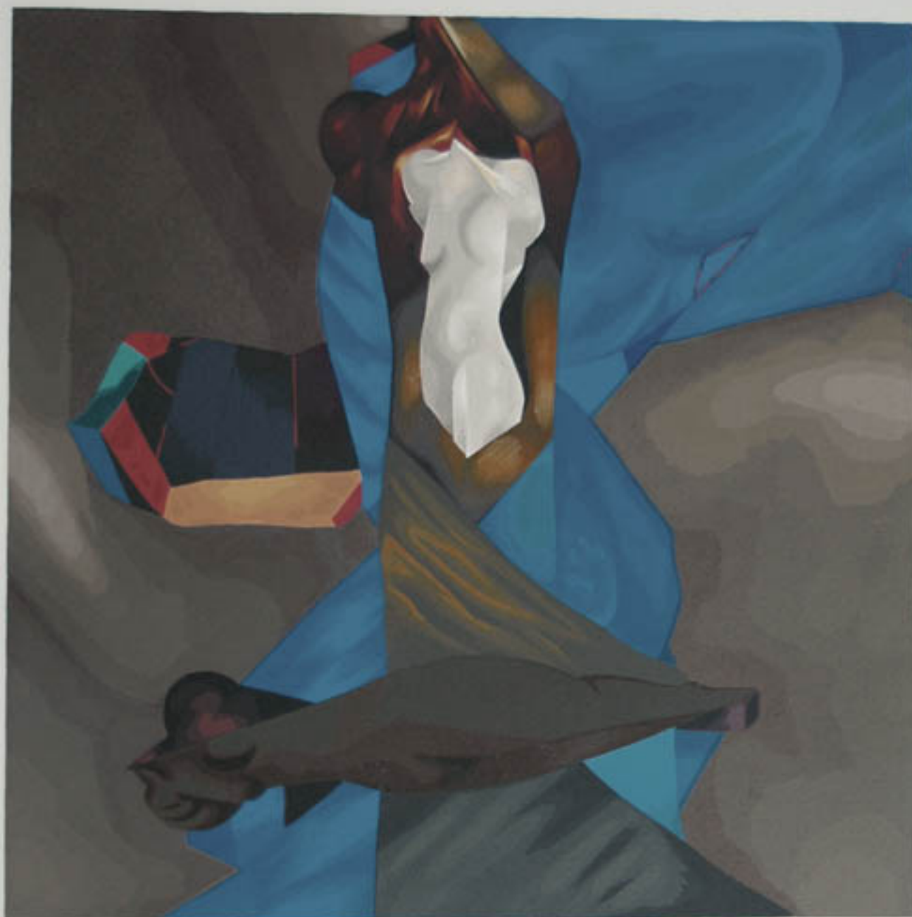
ESTATUA DE COBALTO