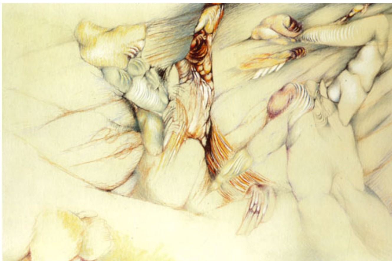
HOMBRES ATACADOS POR MOSCAS