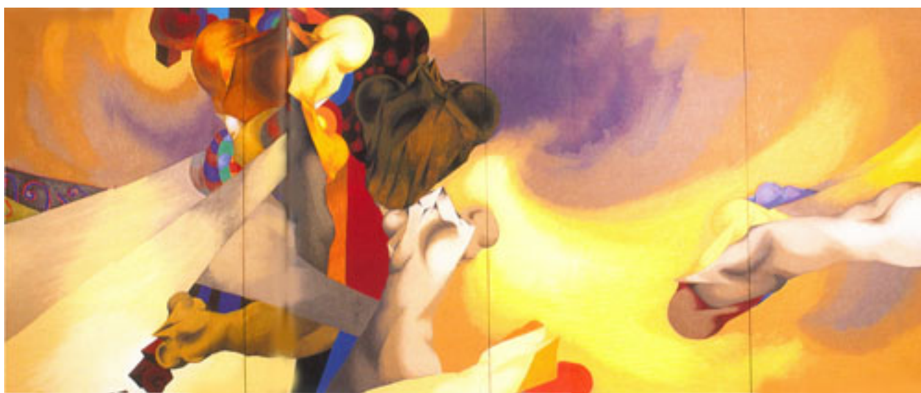
LAS ALAS DEL DESIERTO