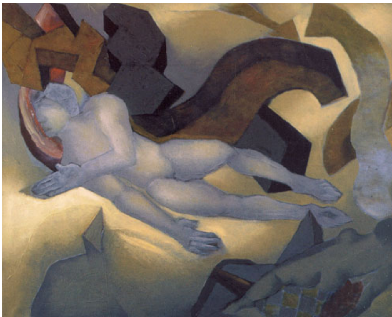
MÁRMOL Y SOMBRA