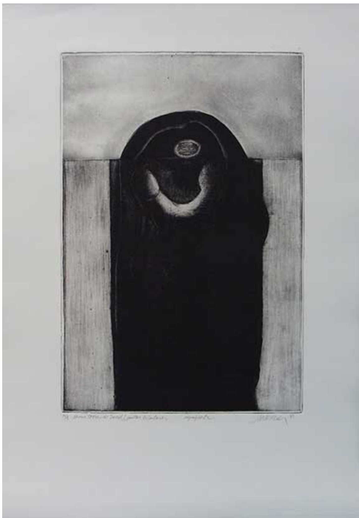
¡COMO TORRE DE DAVID! DE LA SERIE EL CANTAR DE LOS CANTARES