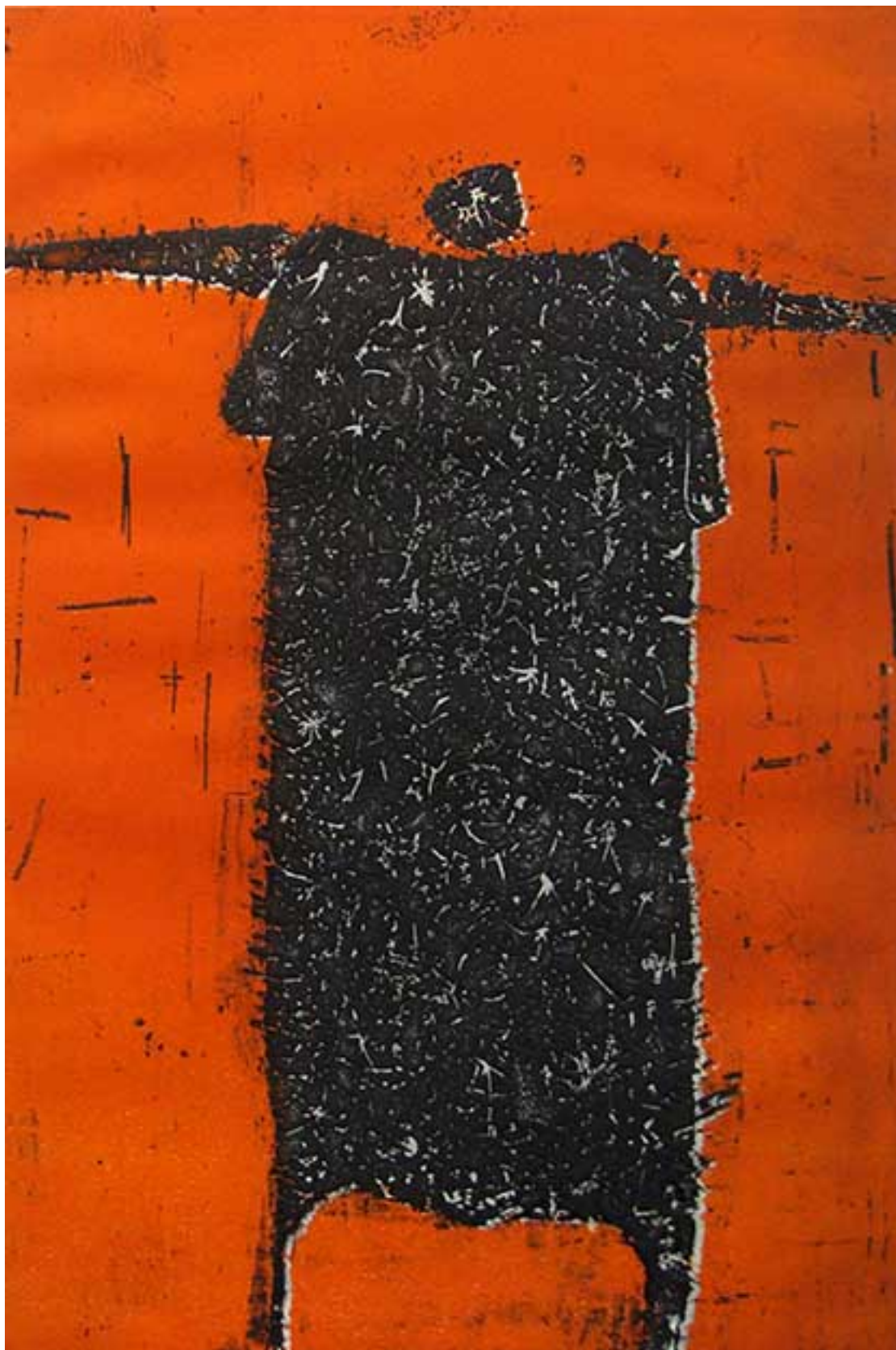
MUTANTE EN ROJO (detalle)

UNIVERSIDAD CATÓLICA DE VALPARAÍSO TELEVISIÓN, UCV Televisión. Demoliendo el Muro [Videgrabación]. Conducción Milan Ivelic y Gaspar Galaz. 1983. DVD V. 8. (Disponible en Sala de Lectura de la Biblioteca MNBA)