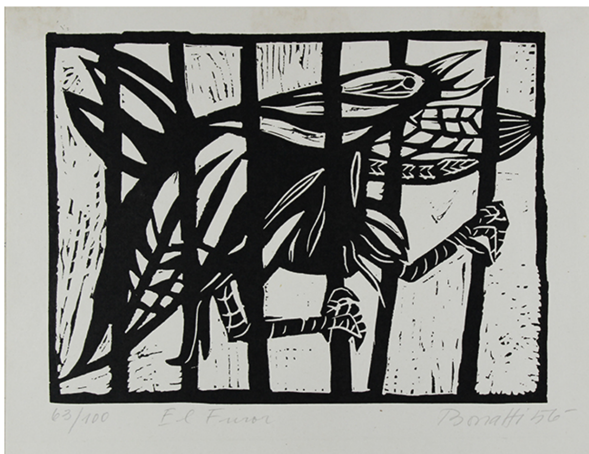
EL FUROR, de la carpeta "5 Grabados Bonatti"