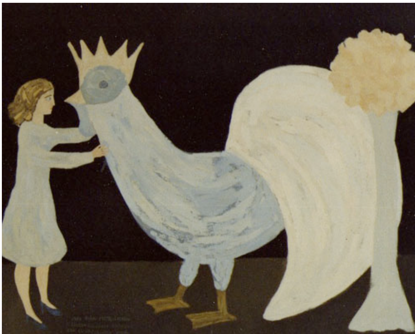
AUTORRETRATO CON GALLO