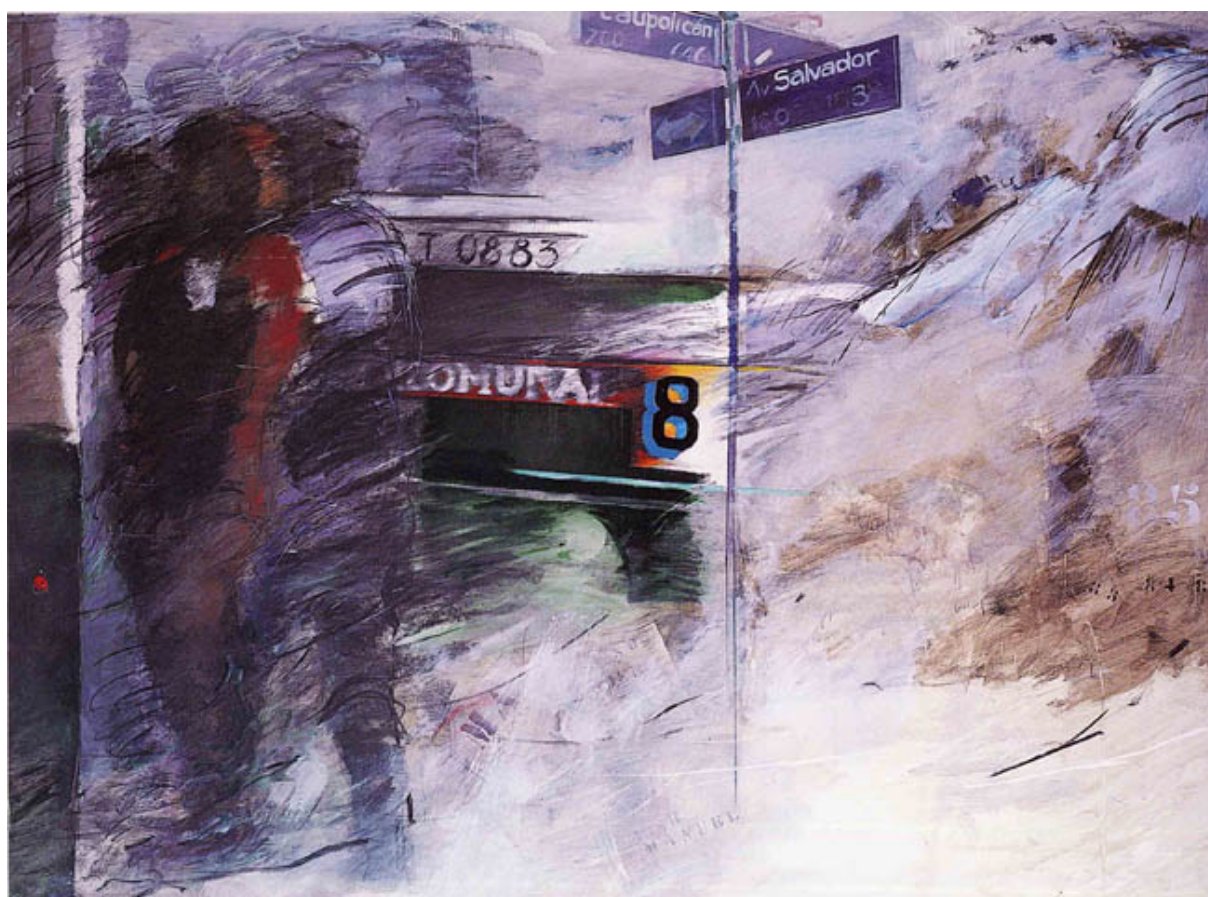
Caupolicán con Salvador