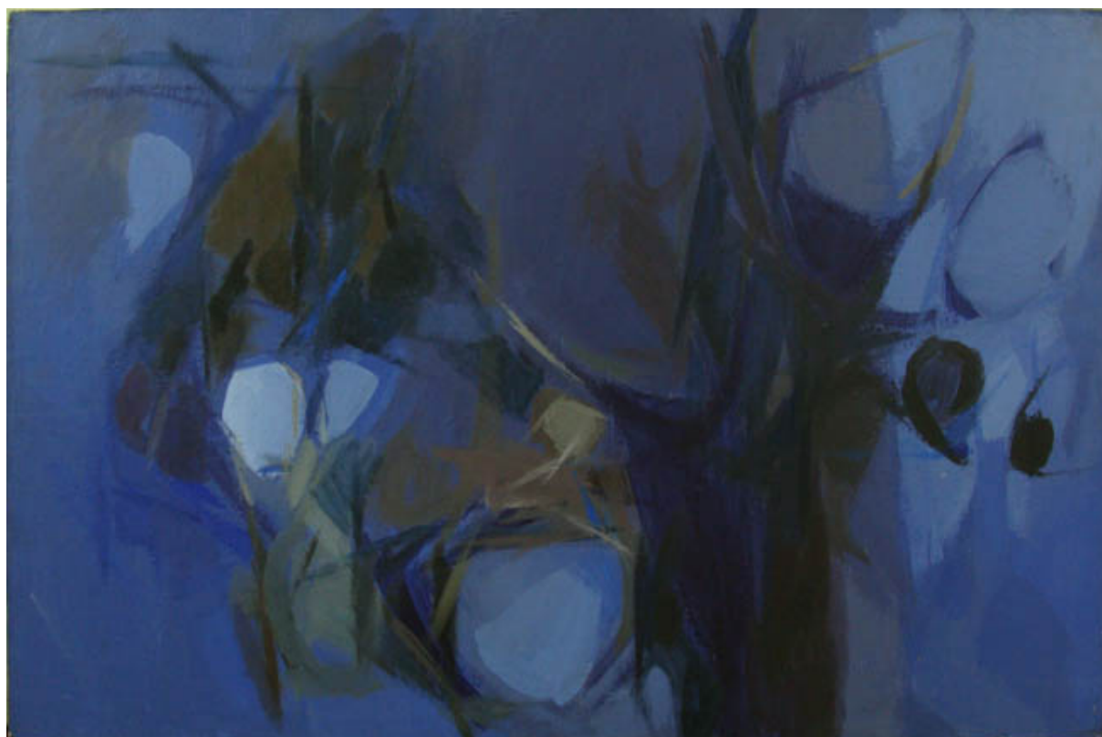
NOCHE EN LA CORDILLERA