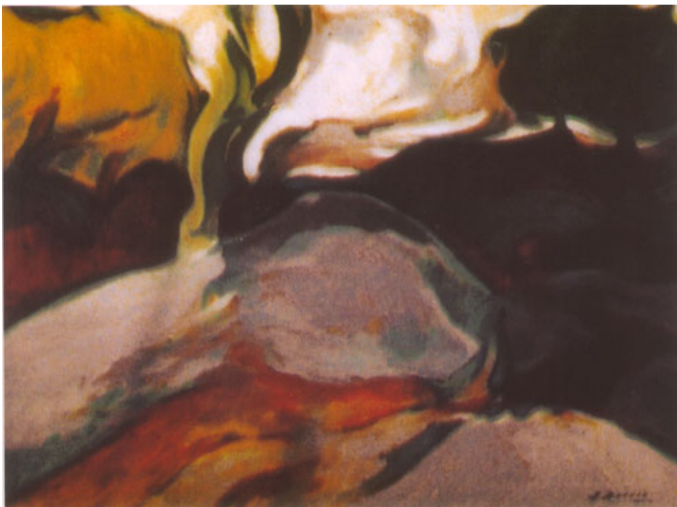
PAISAJE EN OTOÑO