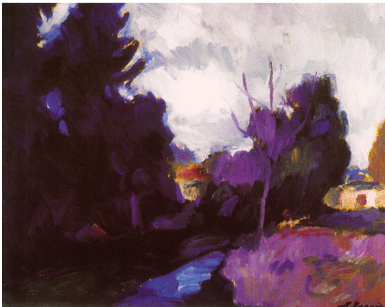
PAISAJE EN LA CONTRA LUZ