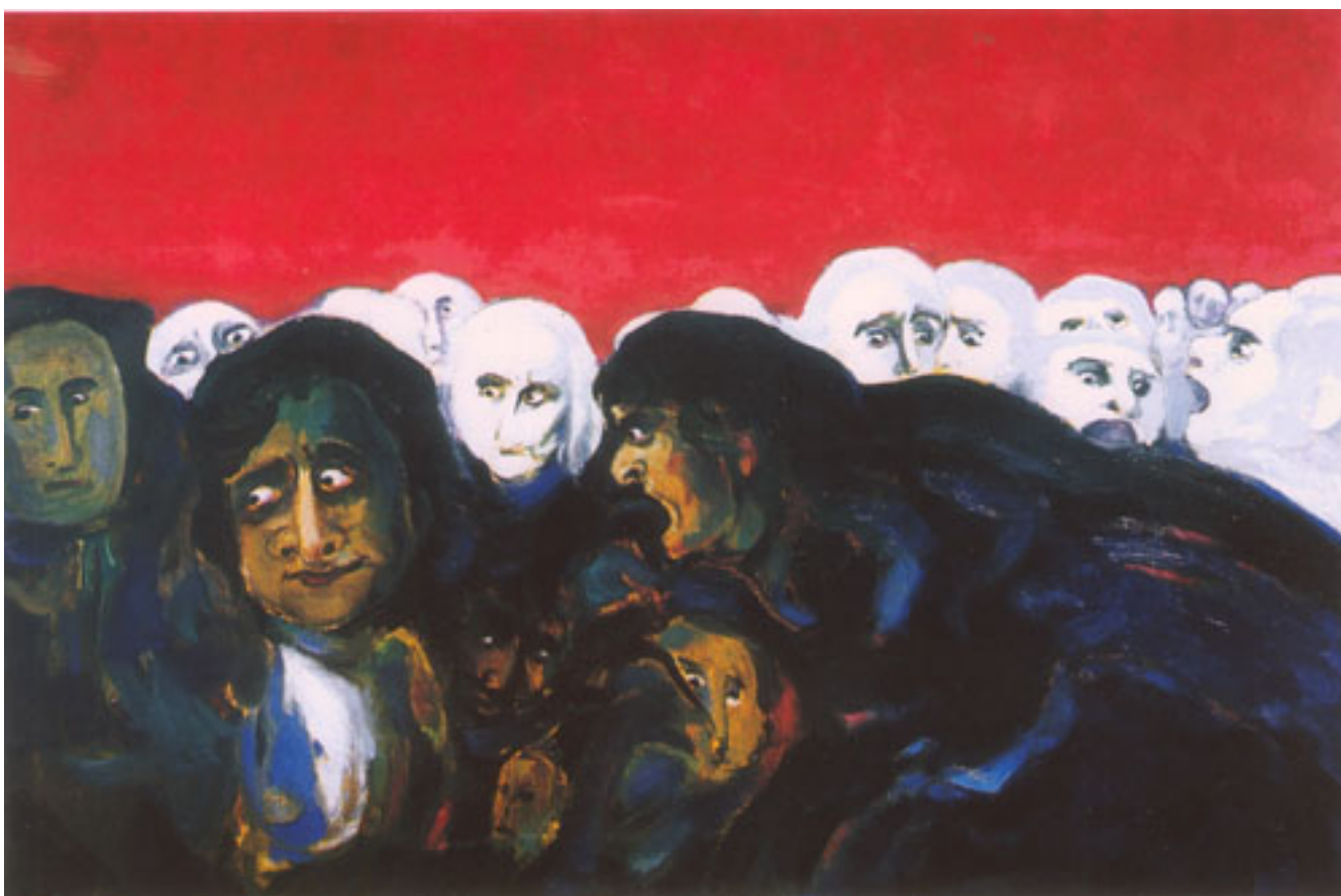
EL ENJUICIAMIENTO I