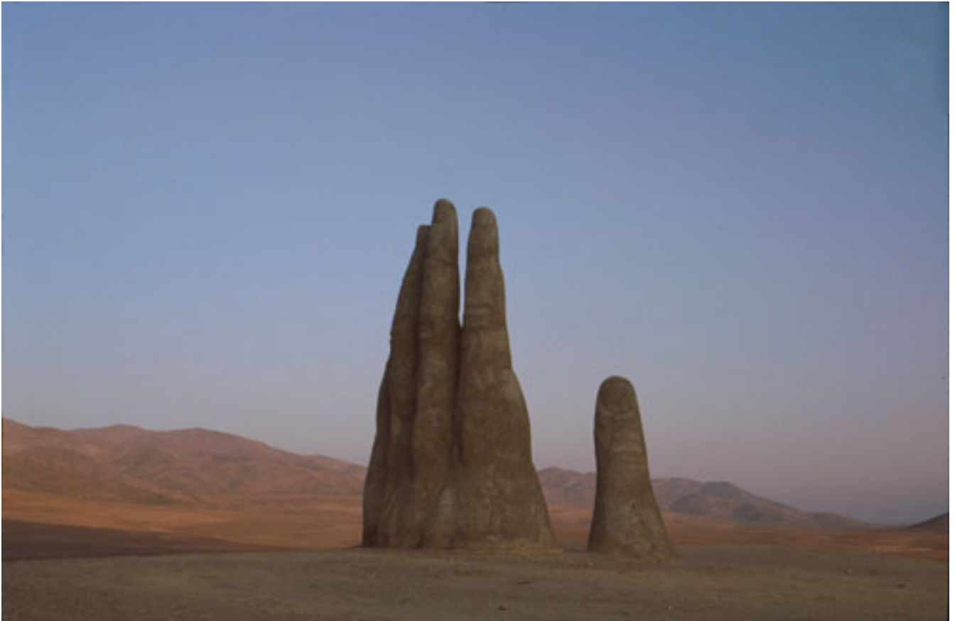
MANO DEL DESIERTO