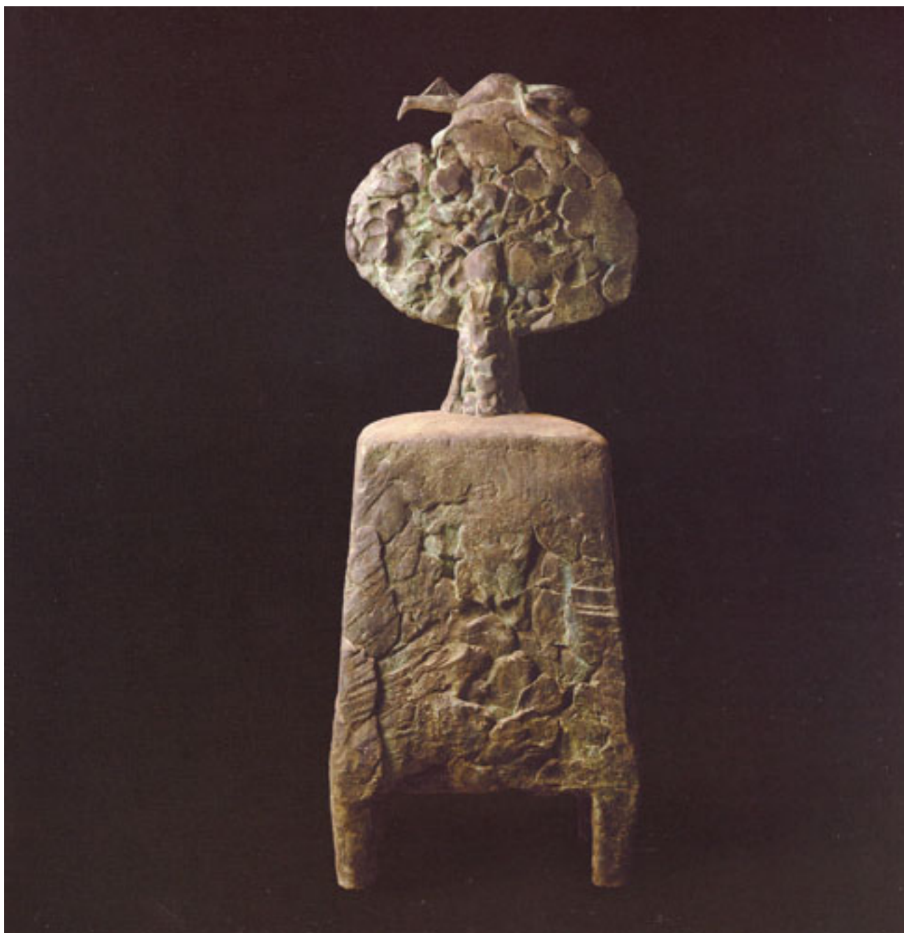
ÁRBOL DE LA VIDA