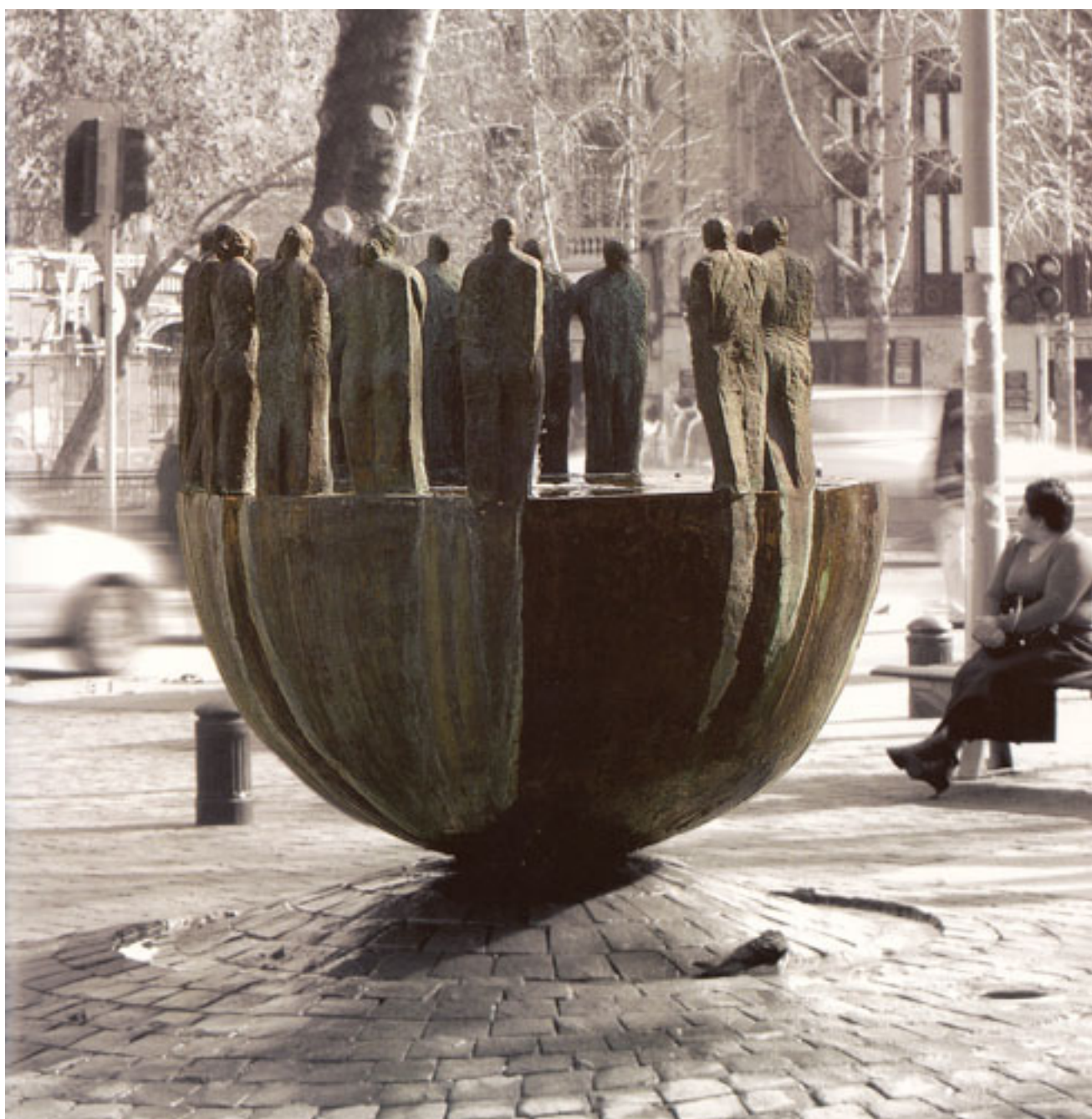
ESFERA DEL ENCUENTRO