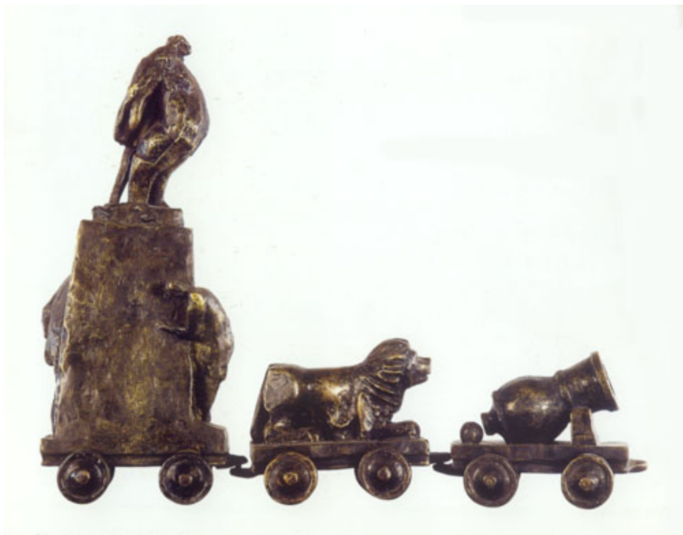
LA GIRA PRESIDENCIAL