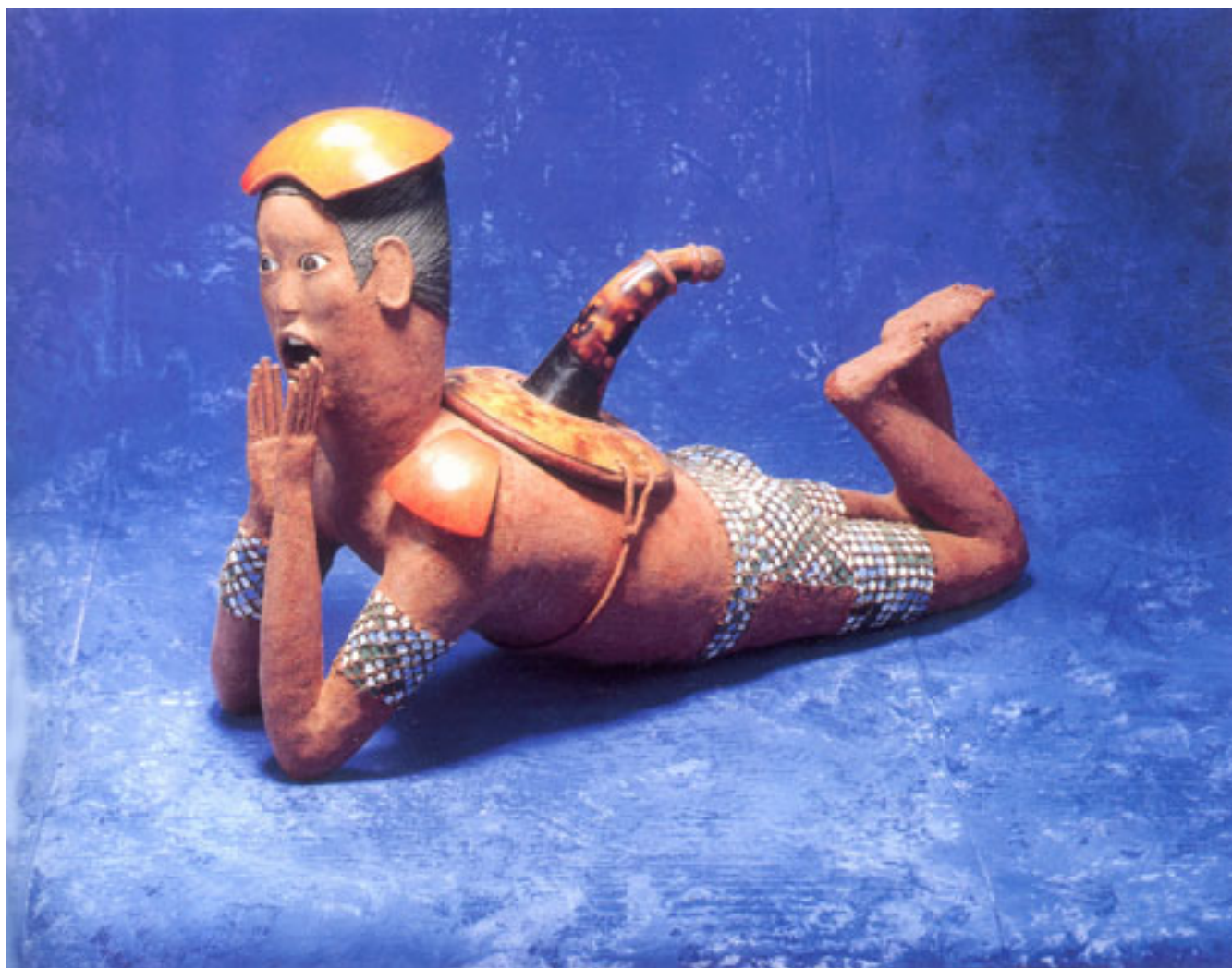
MODULANDO AL ECO