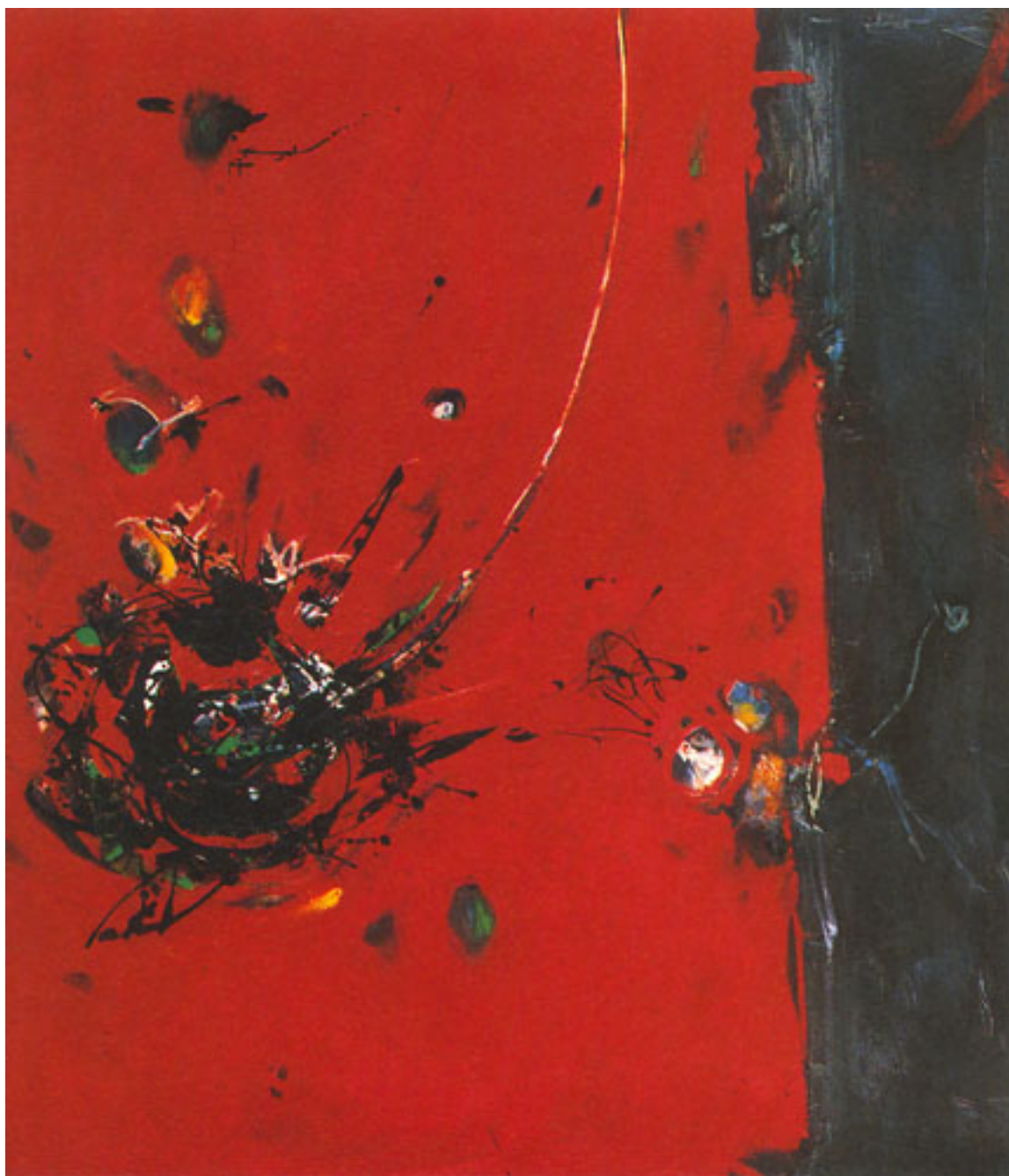
TIEMPO Y MURO