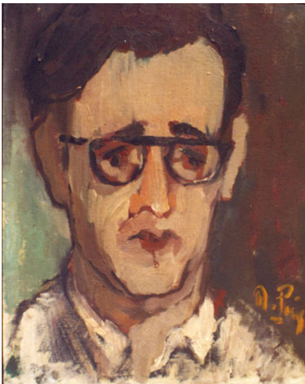
RETRATO DE JOSÉ DONOSO

UNIVERSIDAD DE TALCA, 1986. Forma y espacio movimiento internacional 1955-1985 . Talca: Pinacoteca Universidad de Talca.