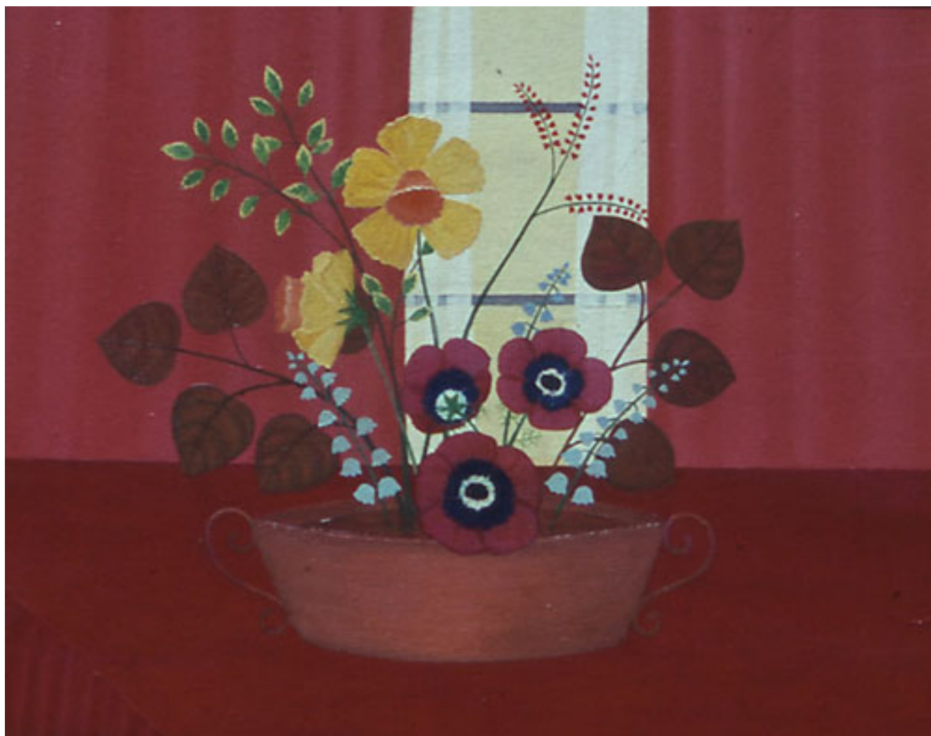
PALANGANA CON RANÚNCULOS