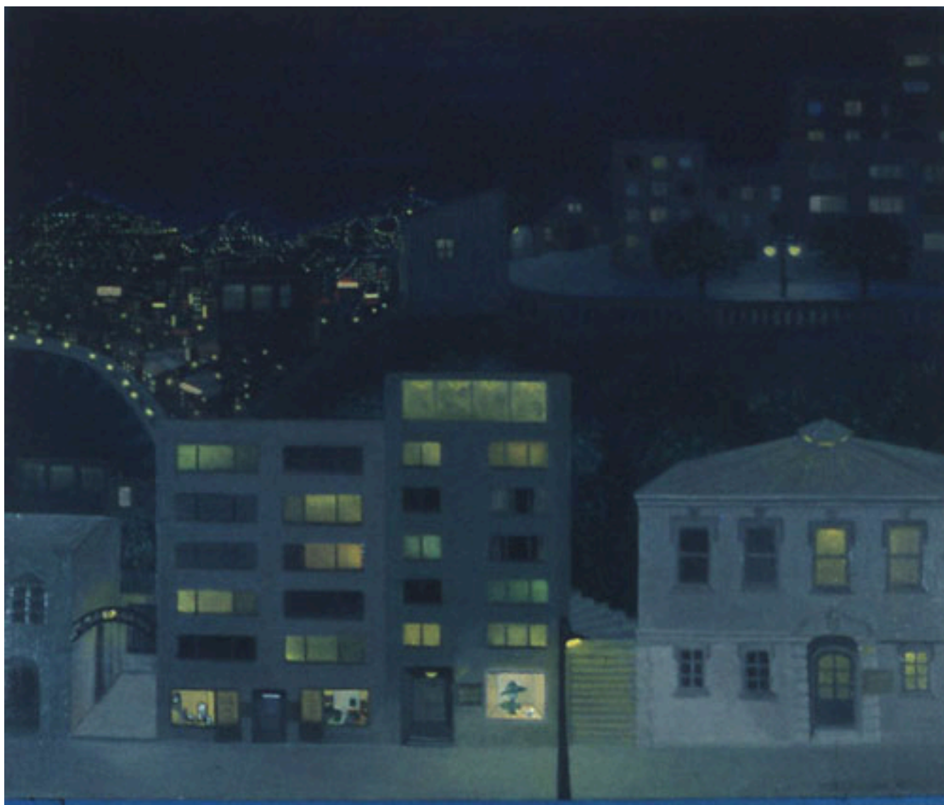
VALPARAÍSO DE NOCHE