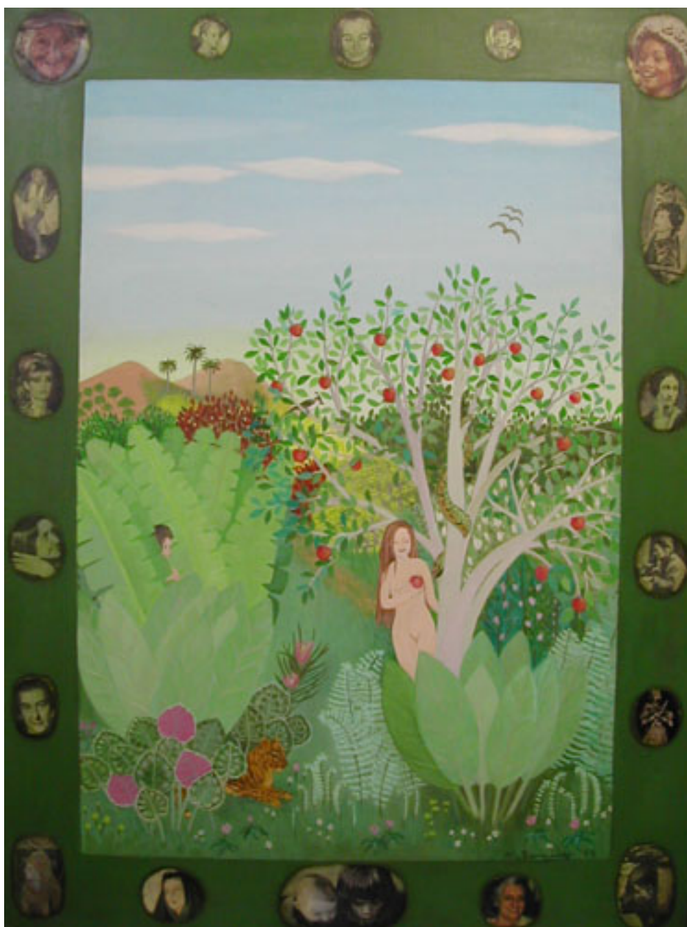
LA MUJER, SUEÑO Y REALIDAD