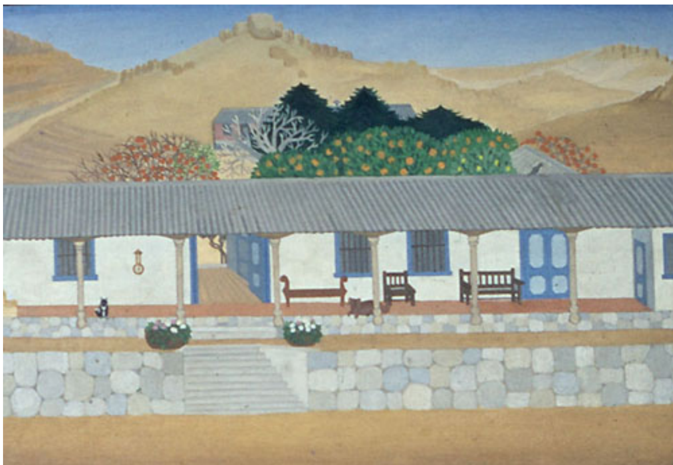
HACIENDA EL BOSQUE