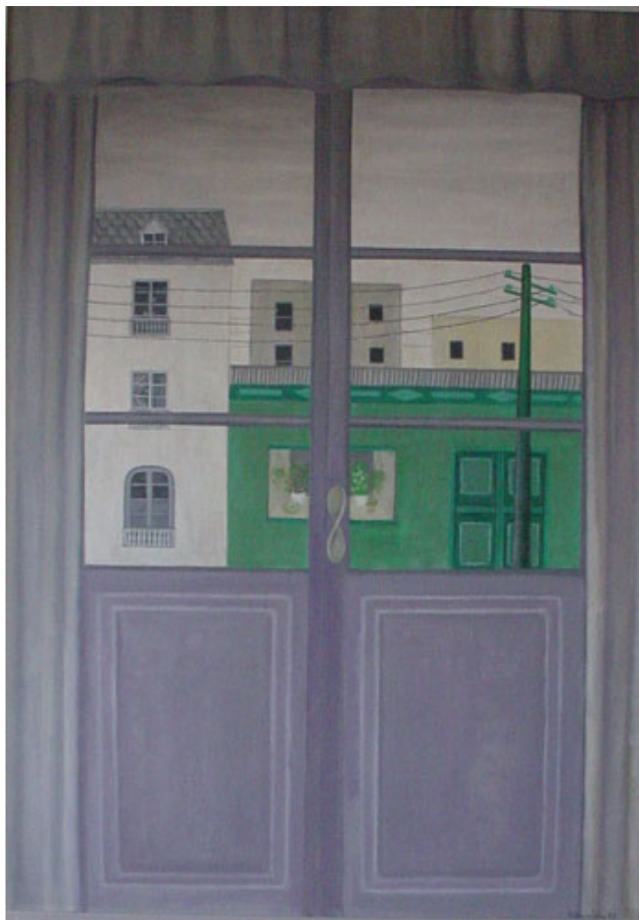
VENTANA HACIA LA AVENIDA FRANCIA DE VALPARAÍSO