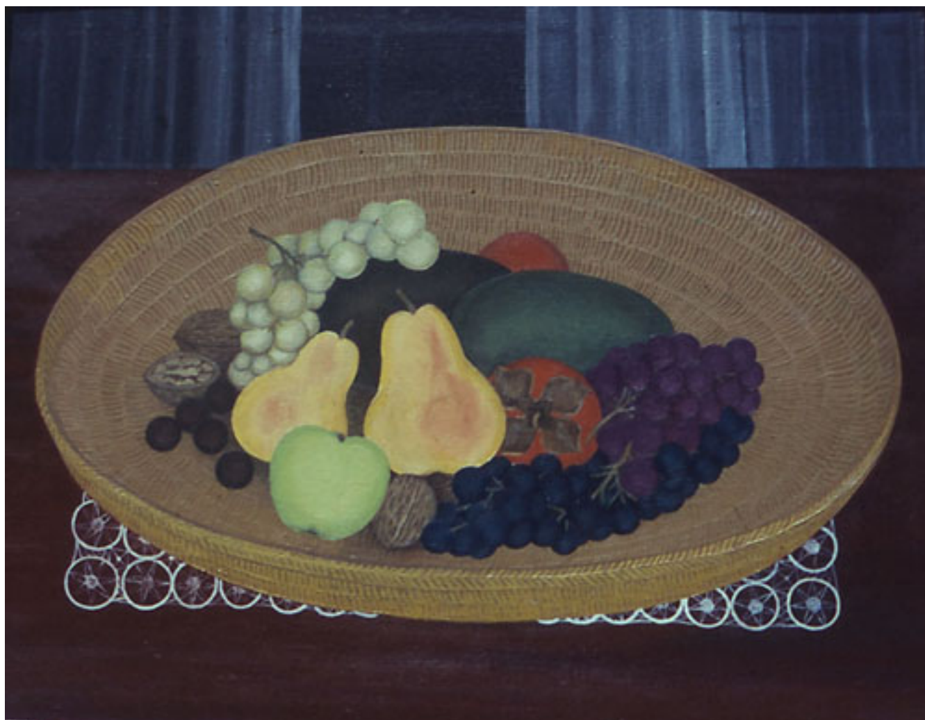
YEPO CON FRUTAS