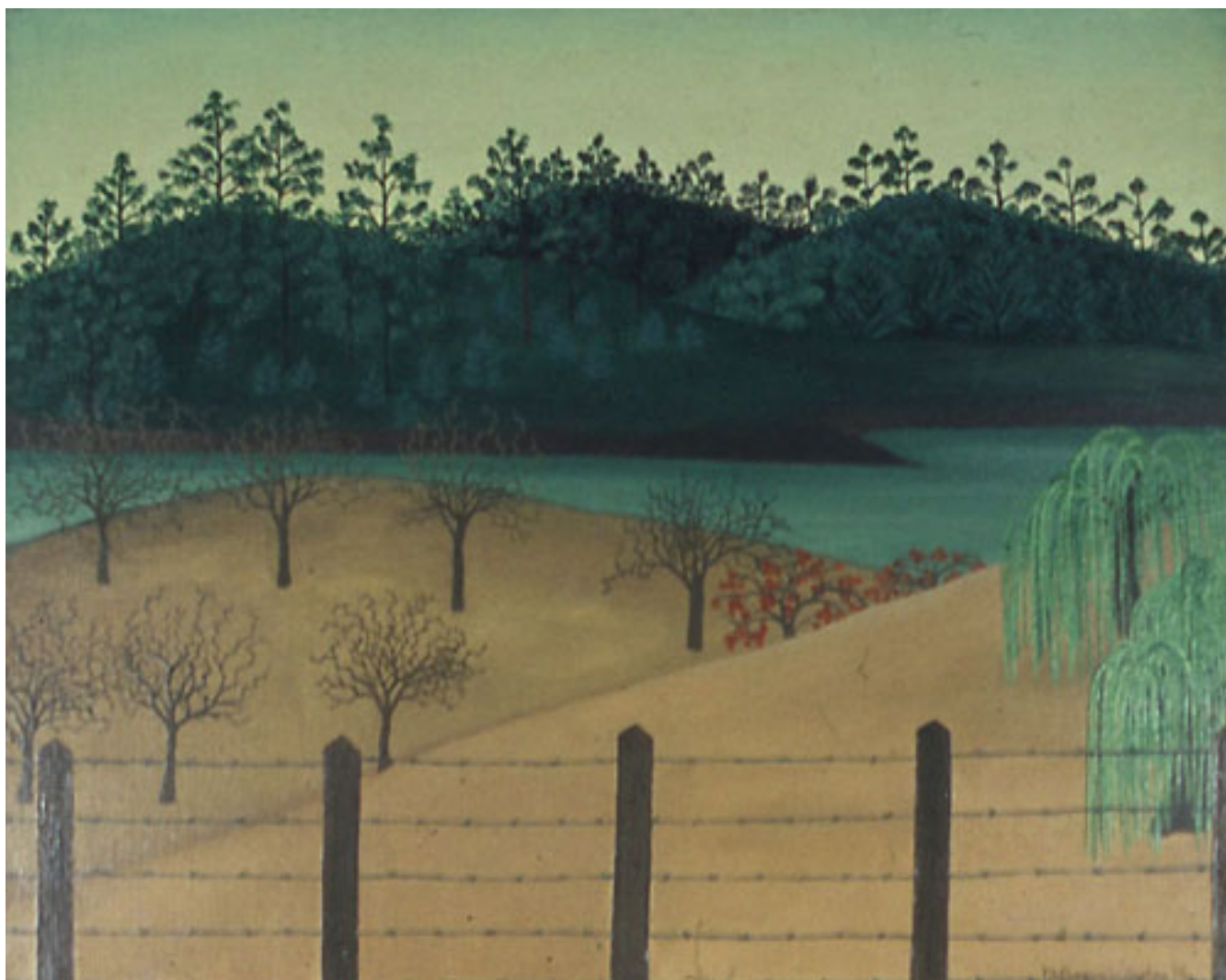
CAMINO A LA COSTA