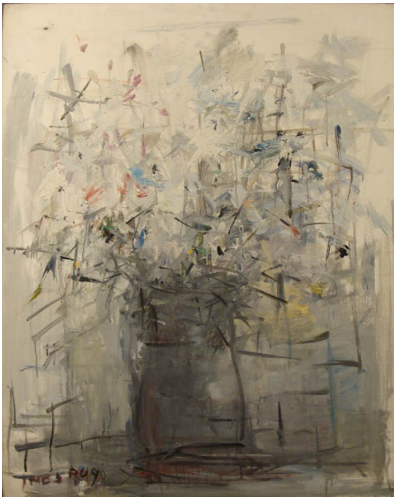
JARRÓN CON FLORES