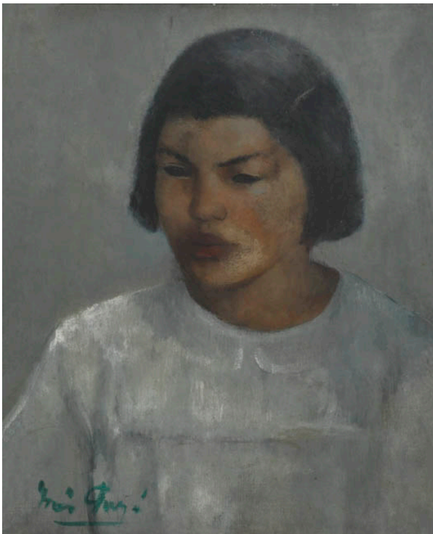
NIÑA DE CAMPO