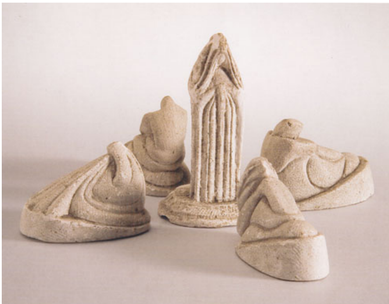
LAS MUJERES DE LA MONTAÑA (maqueta)