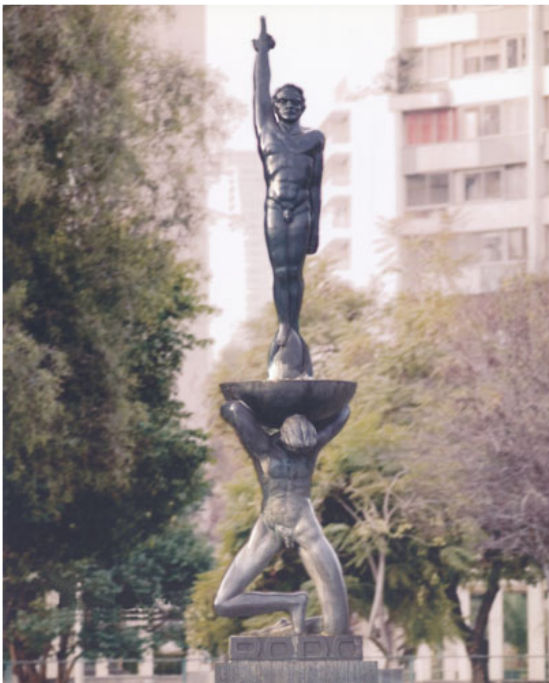
MONUMENTO A RODÓ