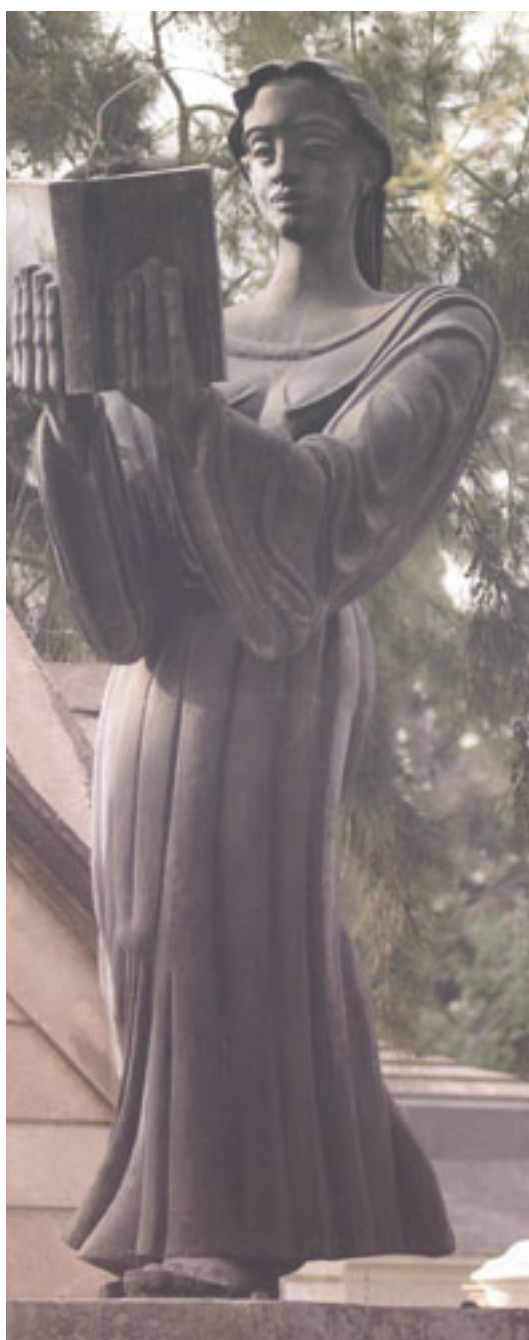
SEPULTURA DE PEDRO AGUIRRE CERDA

BIBLIOTECA/MNBA. Colección de Artículos de Prensa del Artista Tótila Albert publicados en los diarios y revistas entre 1923-2015.Santiago: Archivo Documental Biblioteca MNBA.