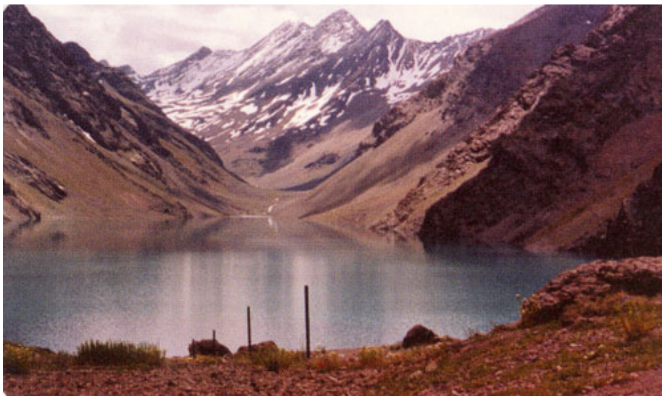
LAGUNA DEL INCA, PORTILLO