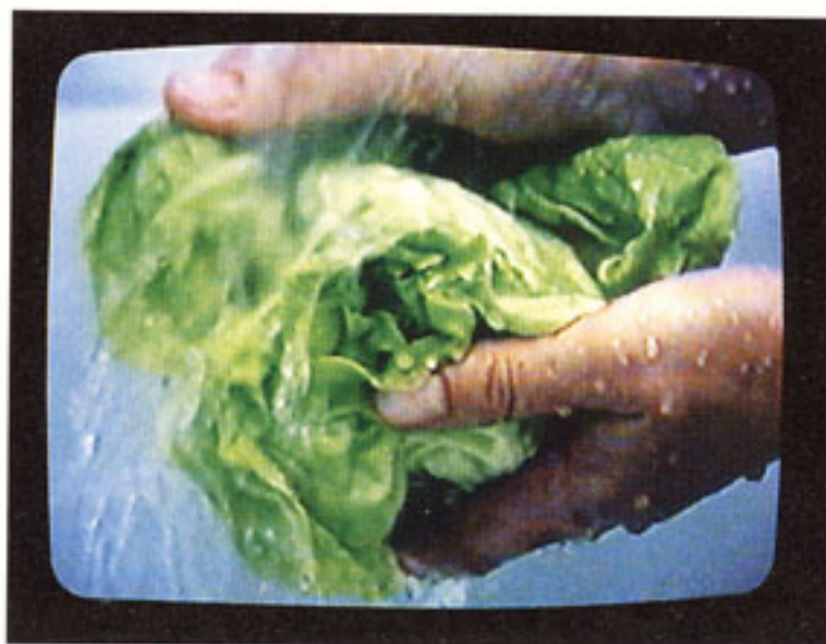
ELLA LAVA LECHUGAS