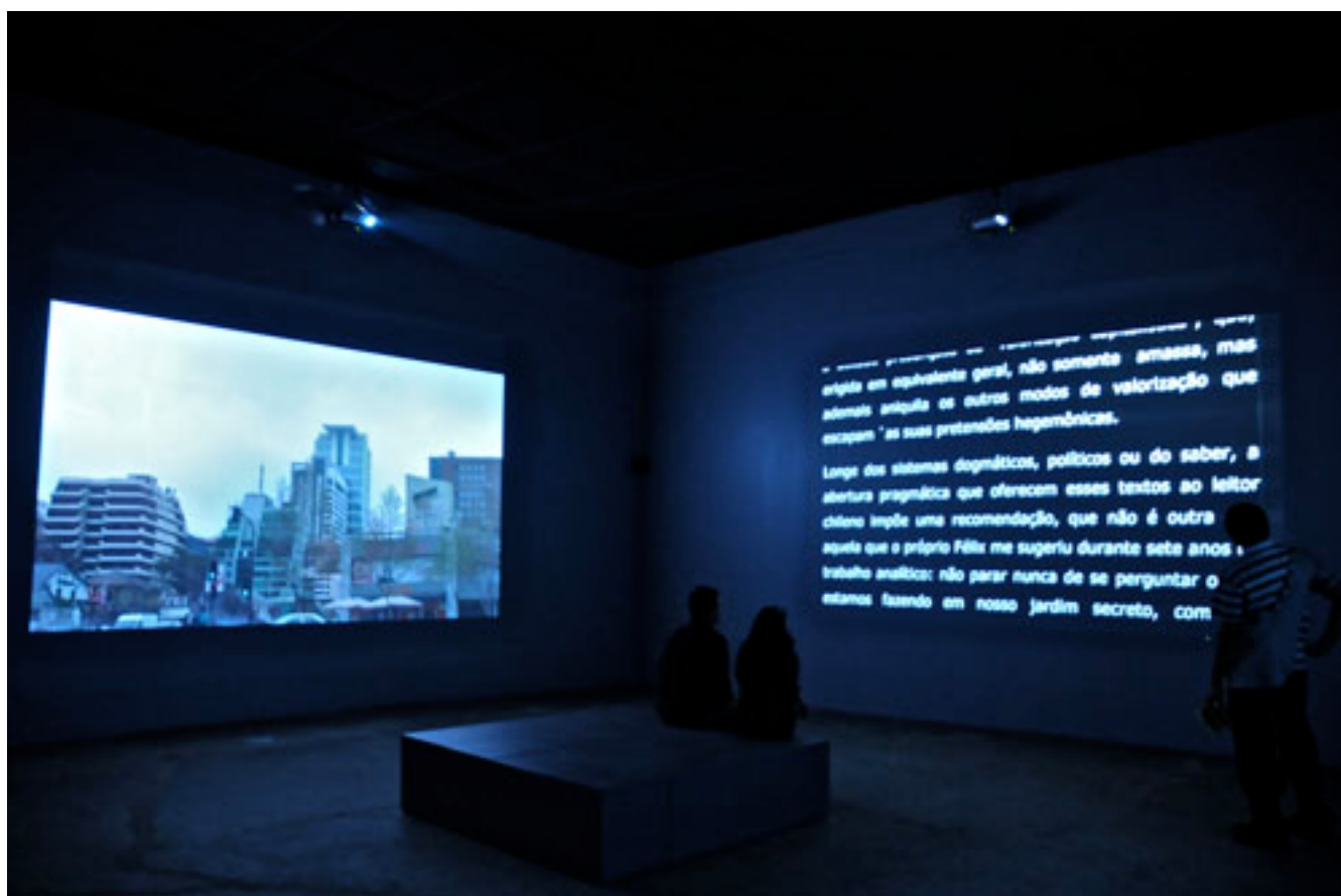
LA ENTREVISTA TERMINADA, ENTREVISTA INTERMINABLE