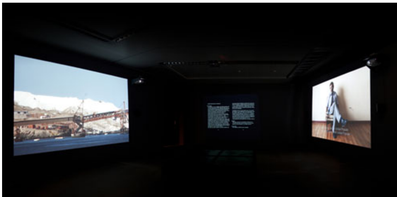
ARICA, NORTE DE CHILE- NO LUGAR Y LUGAR DE TODOS