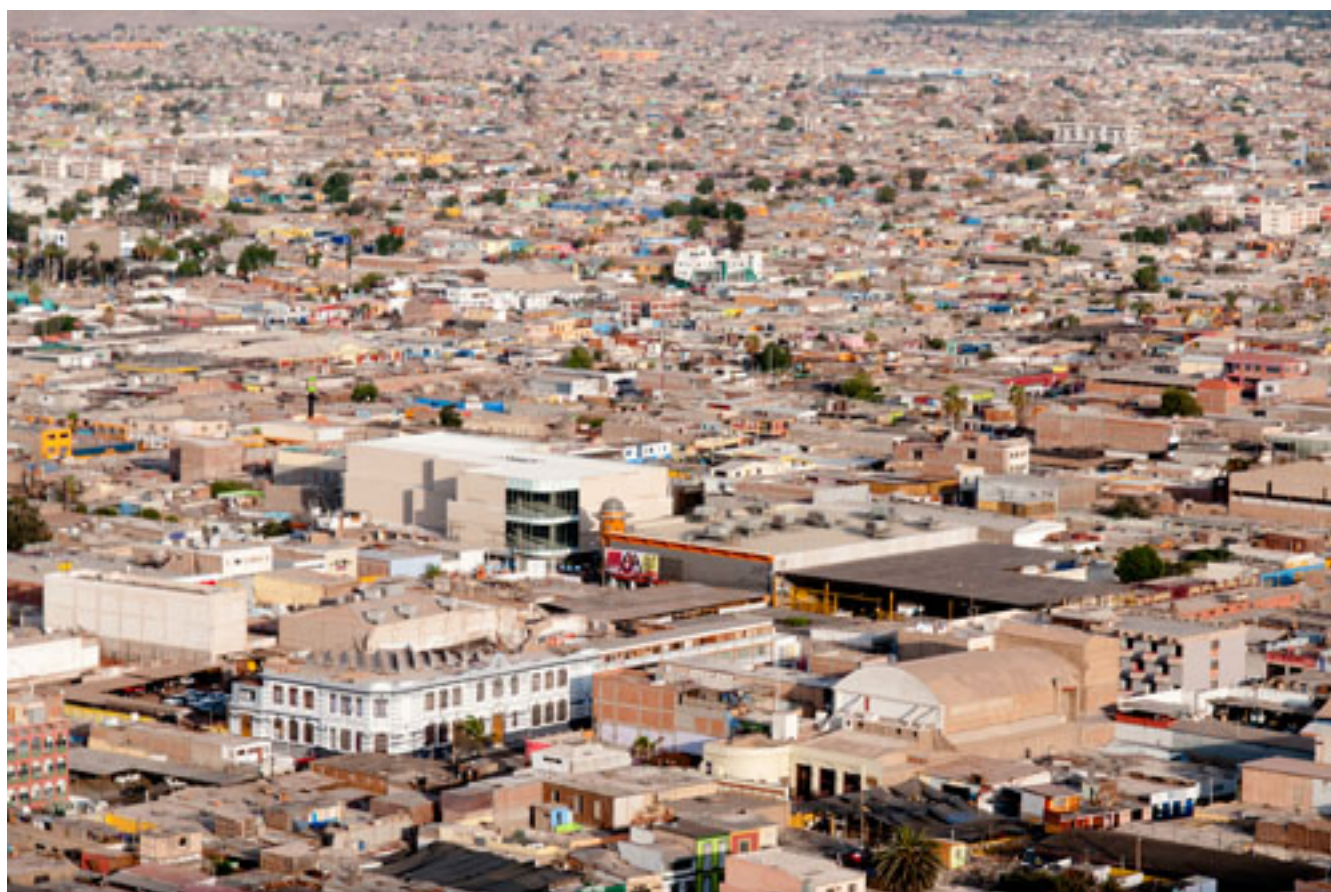
ARICA, NORTE DE CHILE- NO LUGAR Y LUGAR DE TODOS