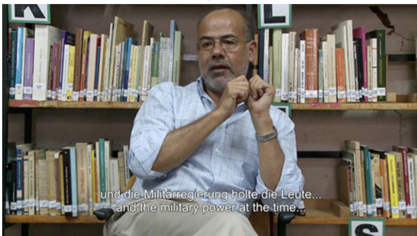
ARICA, NORTE DE CHILE- NO LUGAR Y LUGAR DE TODOS