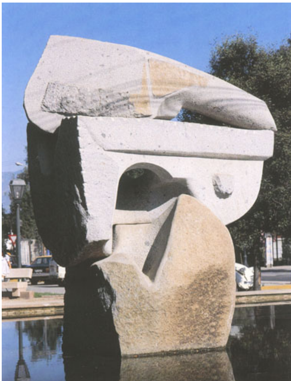
PIEDRAS PARA RANCAGUA