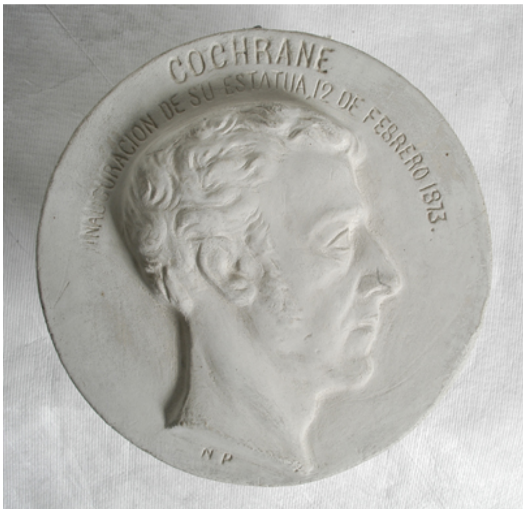
MEDALLÓN DE LORD COCHRANE