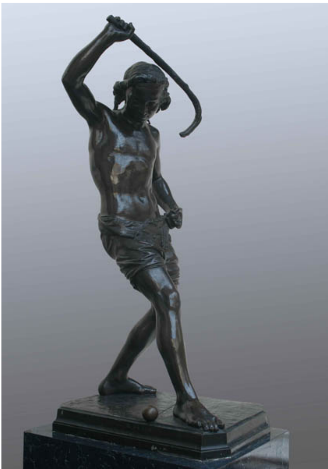
EL JUGADOR DE PALIN