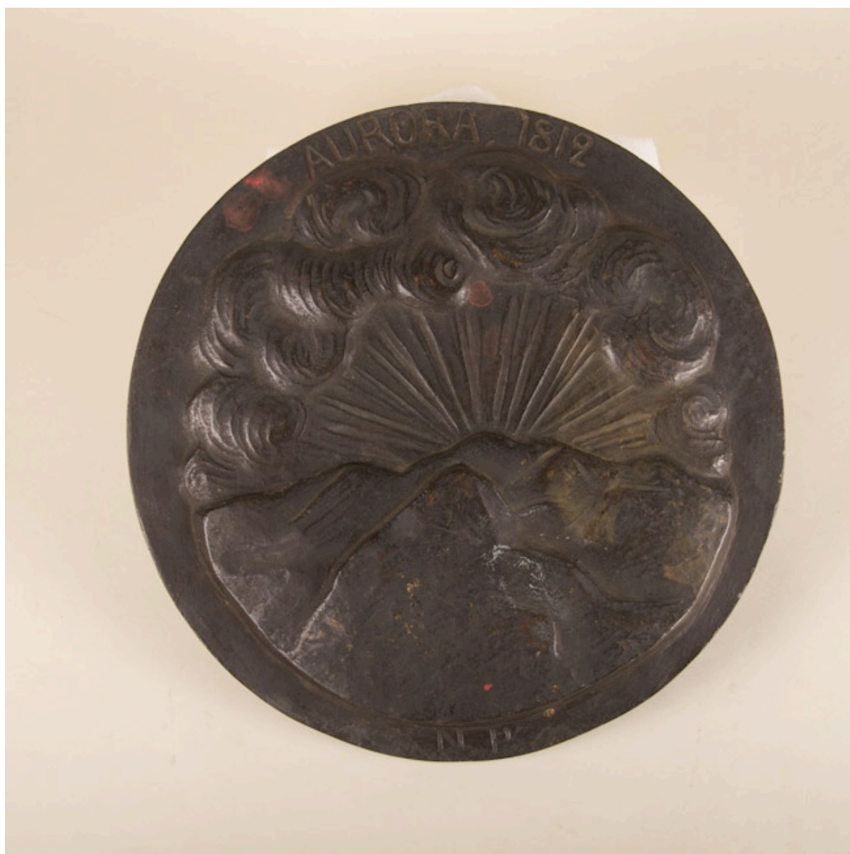
ALEGORÍA A LA AURORA DE CHILE