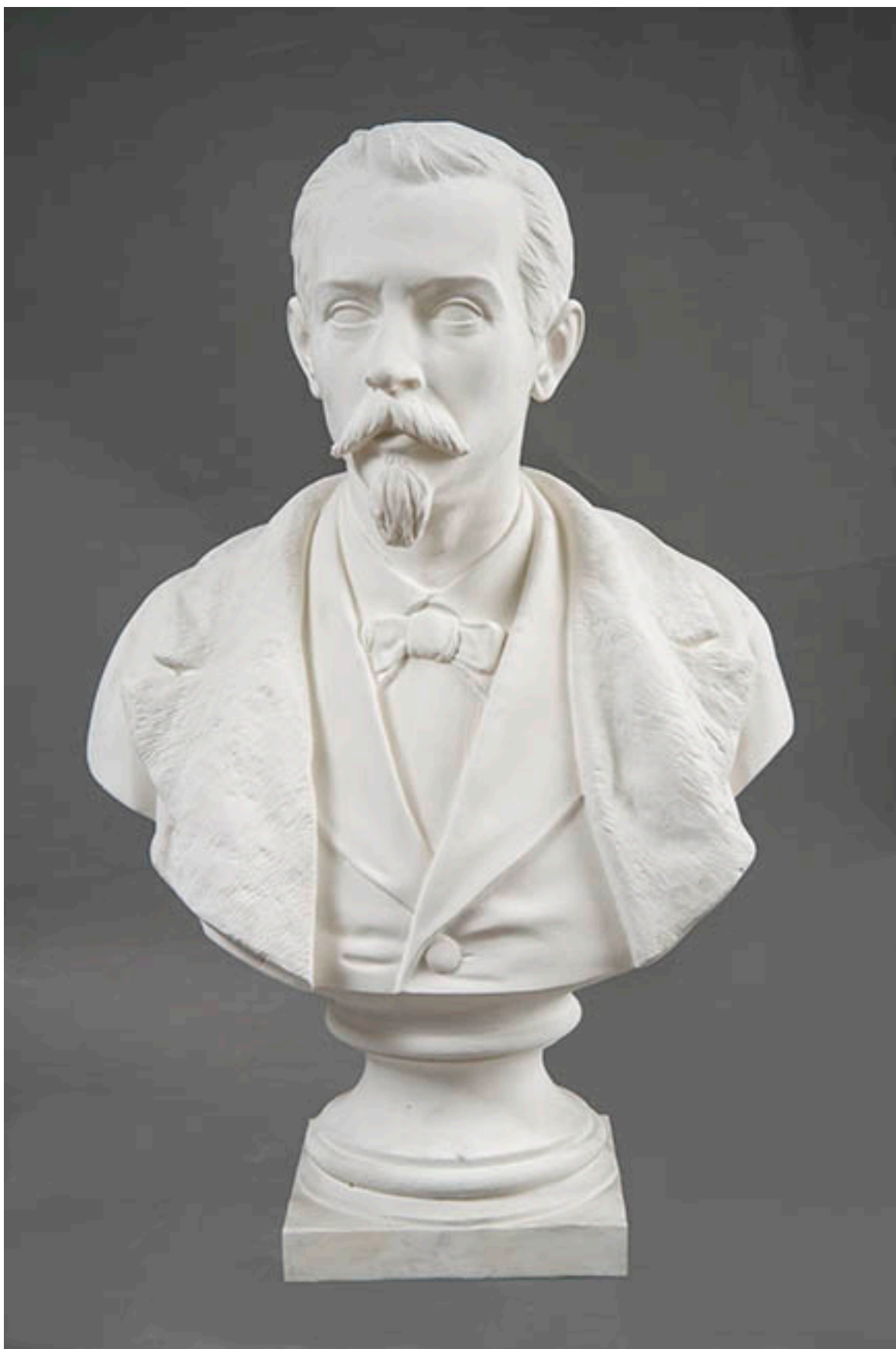
BUSTO DE DON PEDRO LEÓN GALLO GOYENCHEA