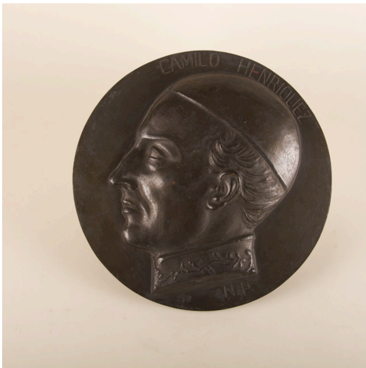
RETRATO DE FRAY CAMILO HENRÍQUEZ GONZÁLEZ