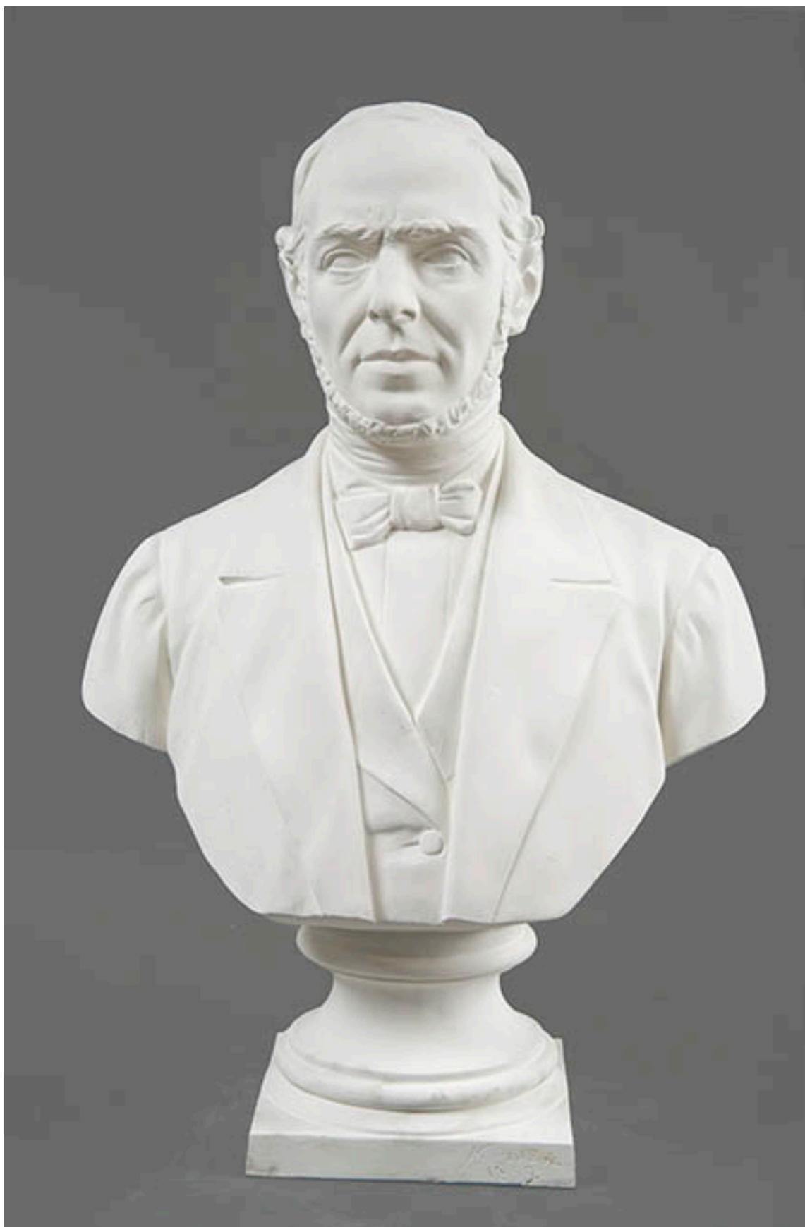
BUSTO DE DON MIGUEL GALLO GOYENECHEA