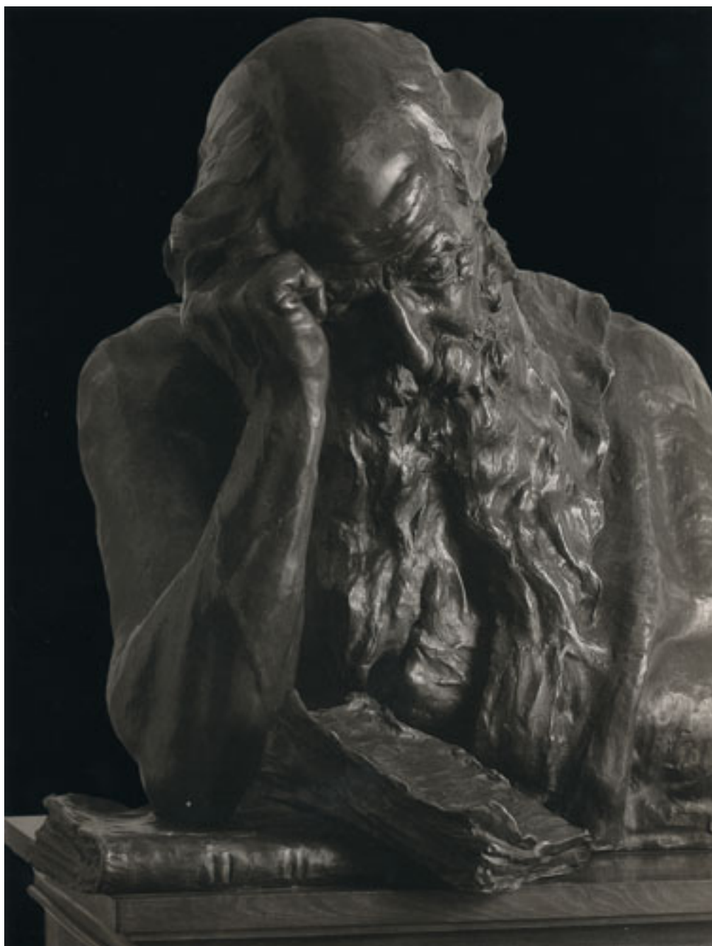
MEDITACIÓN O EL PENSADOR