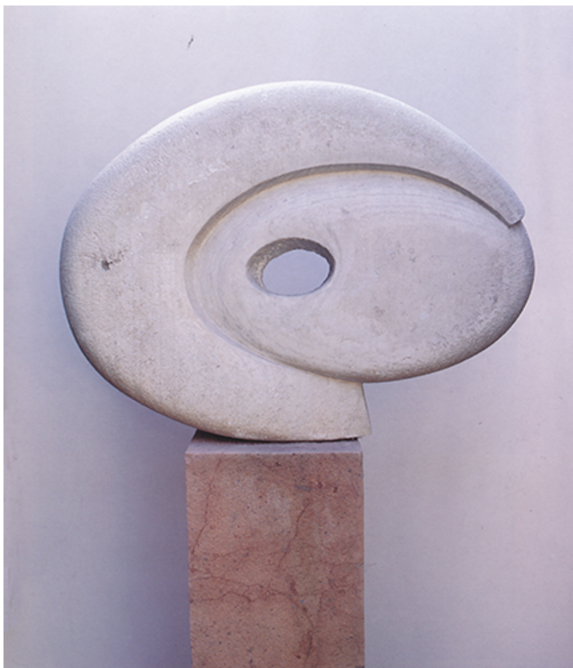
OJO DE DIOS