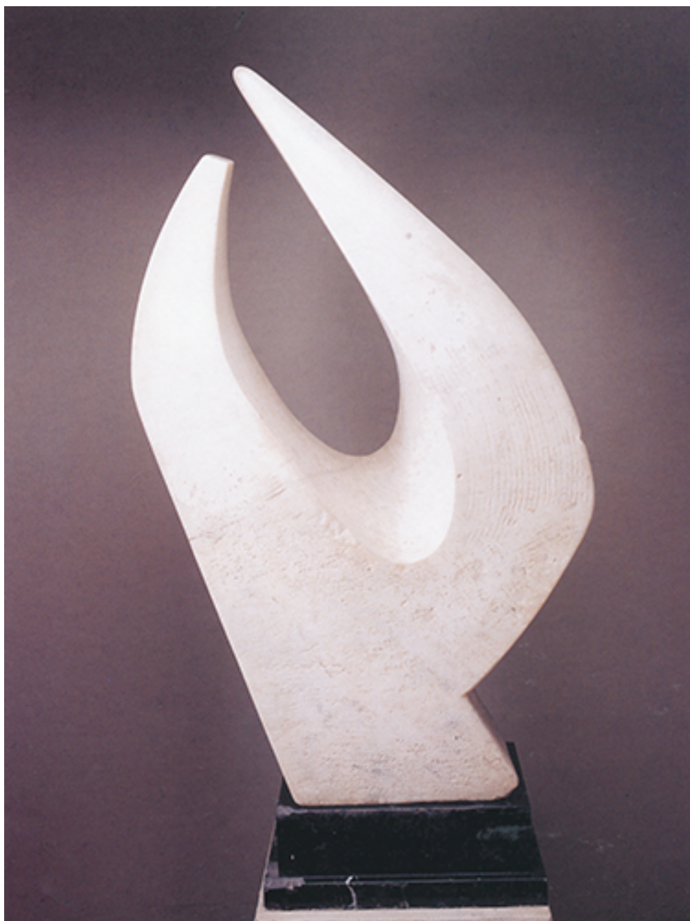
AKU DE LA ANGUSTIA