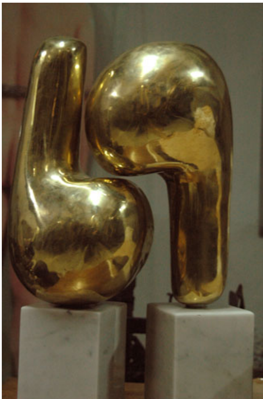
SERIE SIGNO 3-CÓPULA CÓSMICA