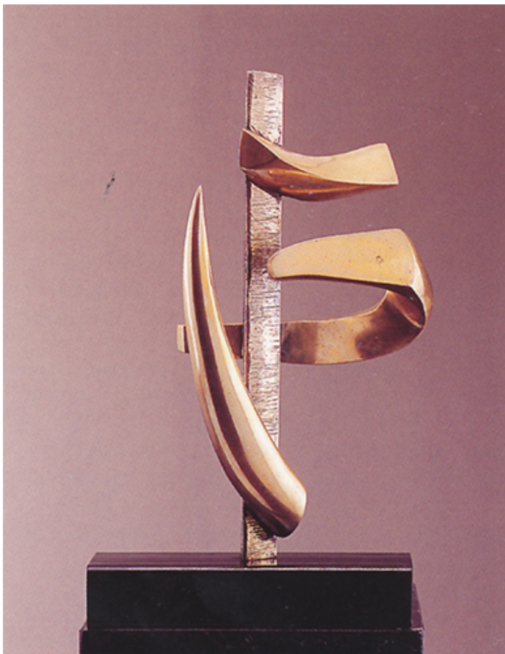
SIGNO IDIOMÁTICO V