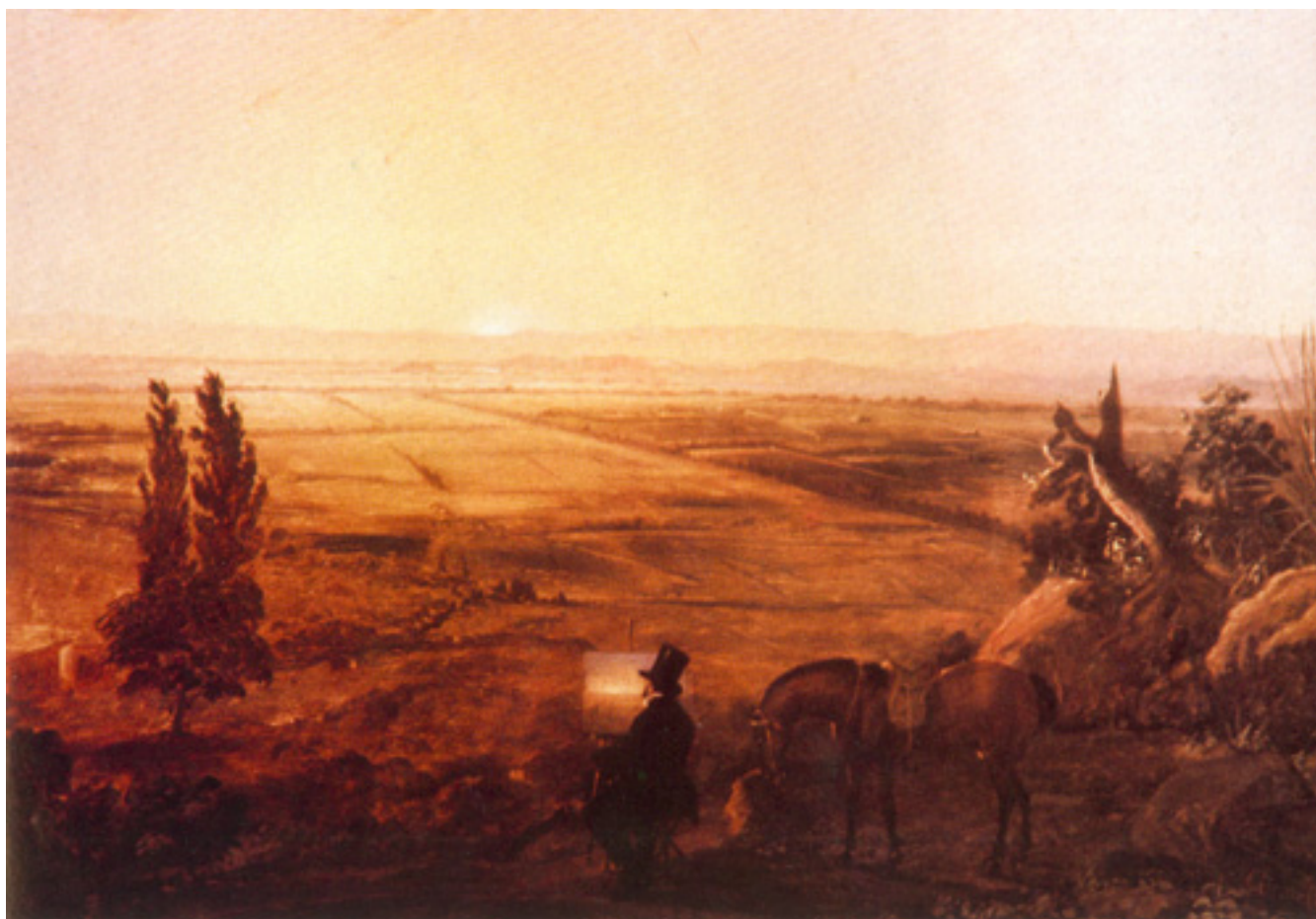
VISTA DE SANTIAGO DESDE PEÑALOLÉN