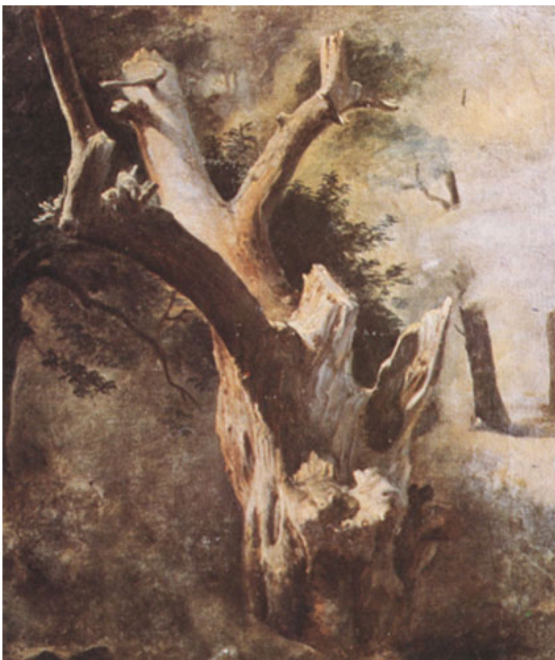
EL ÁRBOL SECO

ZAMORANO, Pedro Emilio, 2012. El discurso de Alejandro Ciccarelli con motivo de la fundación de la Academia de Pintura: claves de un modelo estético de raigambre clásica. En: GUZMÁN, F. y MARTÍNEZ, J. M. eds. Vínculos artísticos entre Italia y América. Silencio historiográfico. VI Jornadas de Historia del Arte , Santiago: MHN, CREA, Facultad de Artes Liberales de la Universidad Adolfo Ibáñez, pp. 197-205.