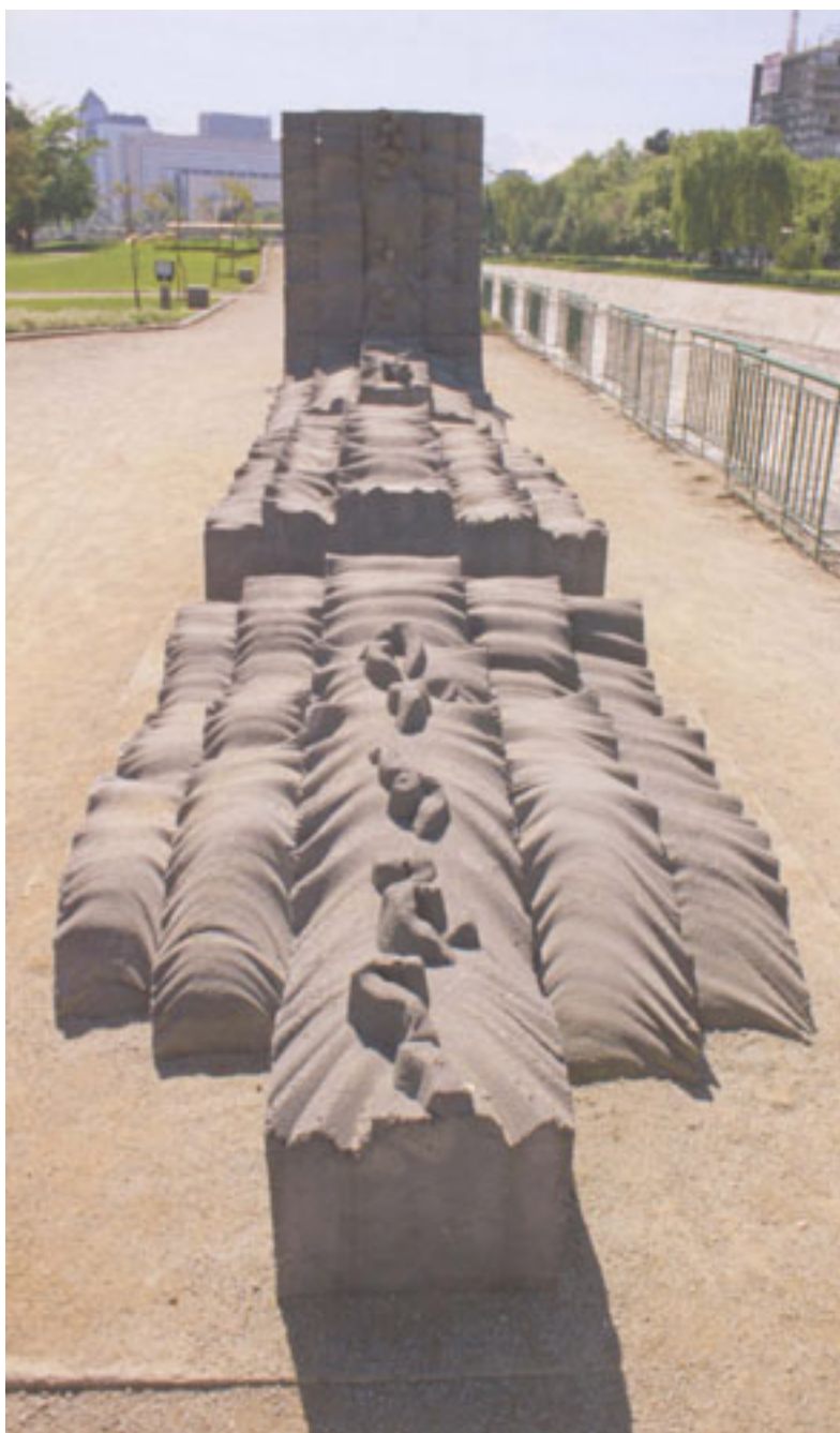
ODA AL RÍO