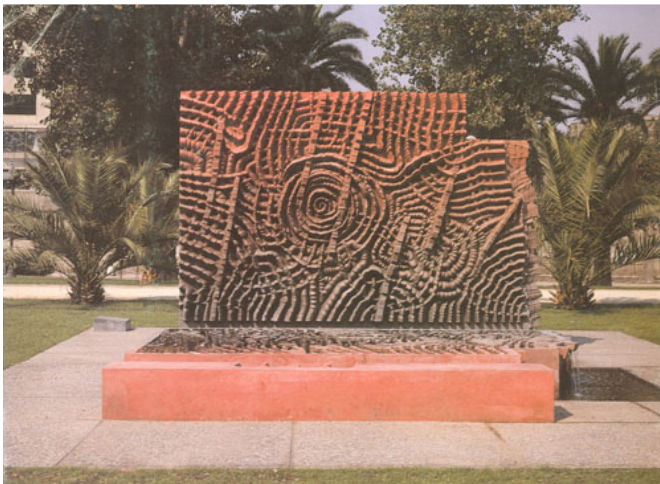
HOMENAJE A JACKSON POLLOCK