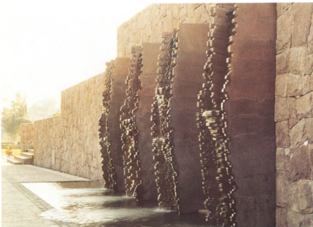
CASA DE PIEDRA