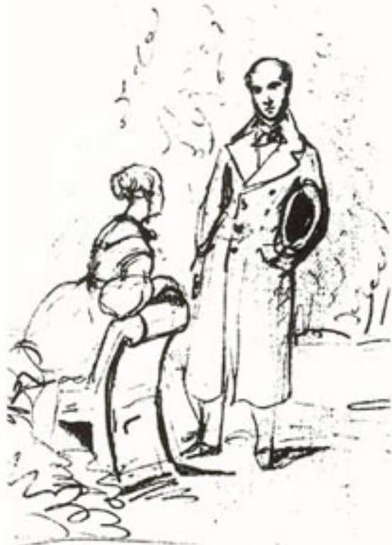
RETRATO DE MAURICIO RUGENDAS