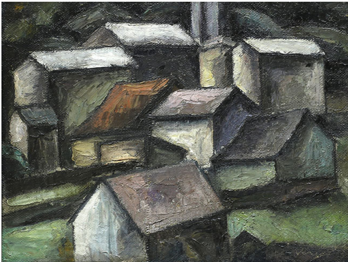
TECHOS DE PUERTO MONTT