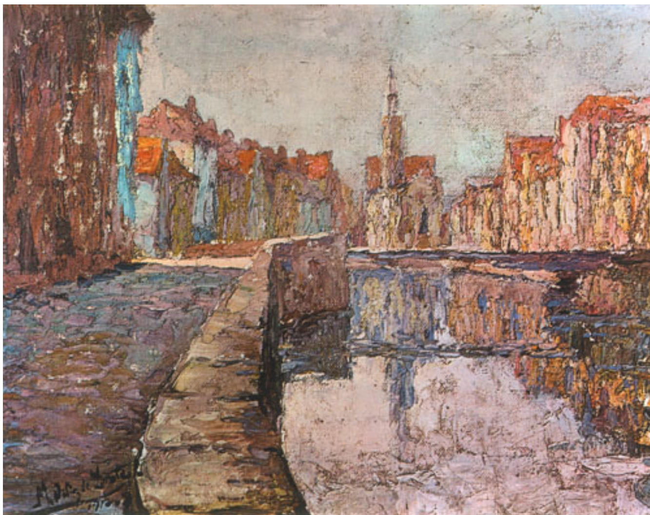
PAISAJE DE VENECIA