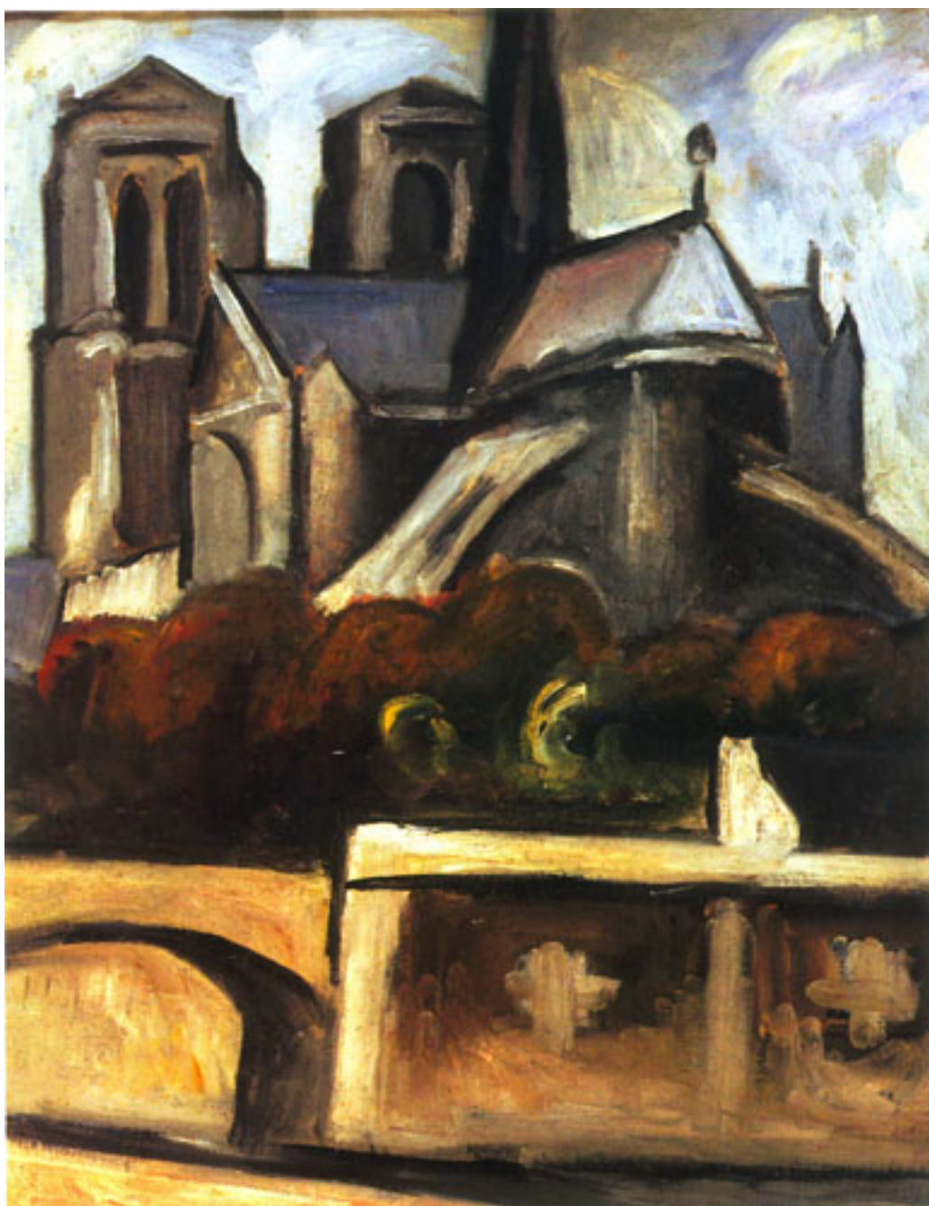
NOTRE DAME DE PARÍS