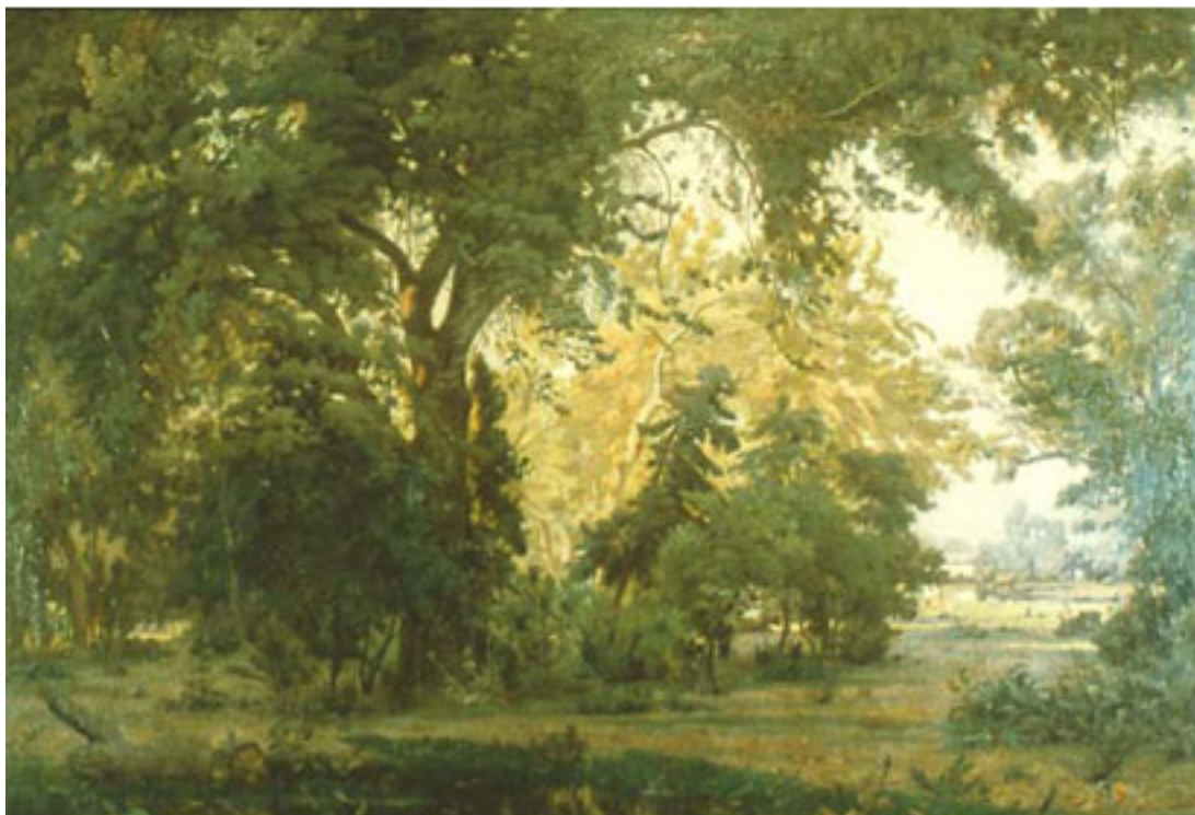
EN LA QUINTA NORMAL