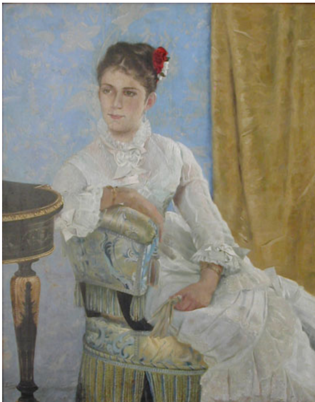
RETRATO DE LA HIJA DEL GENERAL BULNES