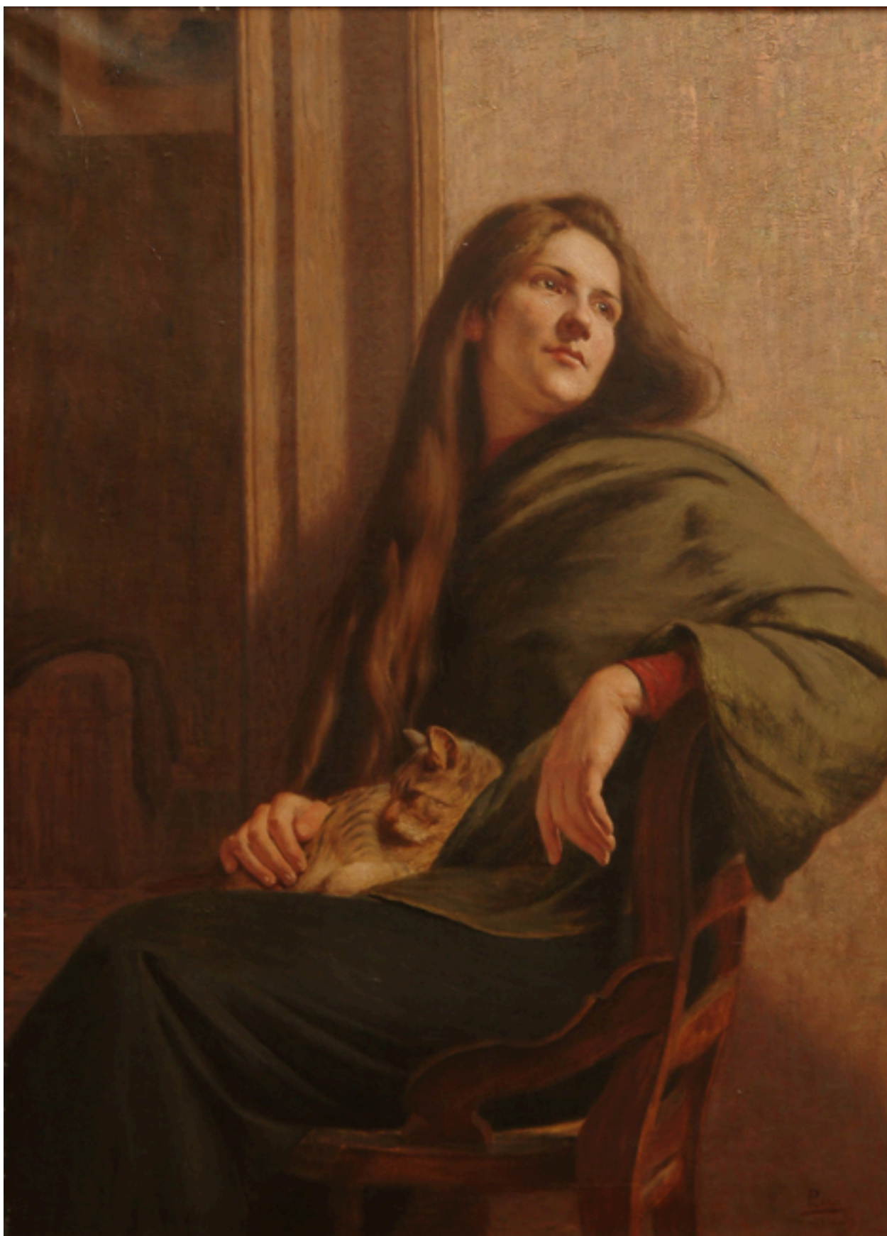
LA NIÑA DEL GATO