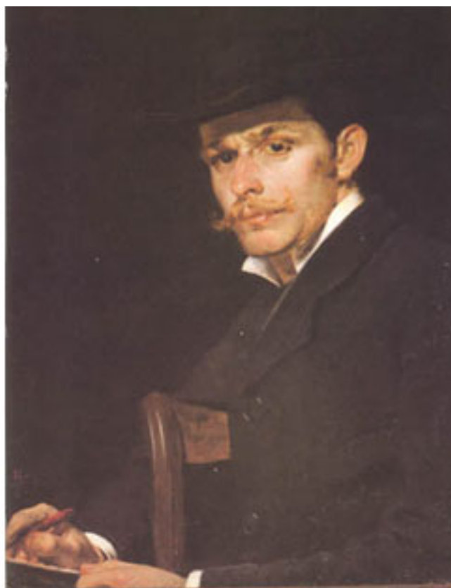
RETRATO DE DON PABLO BURCHARD