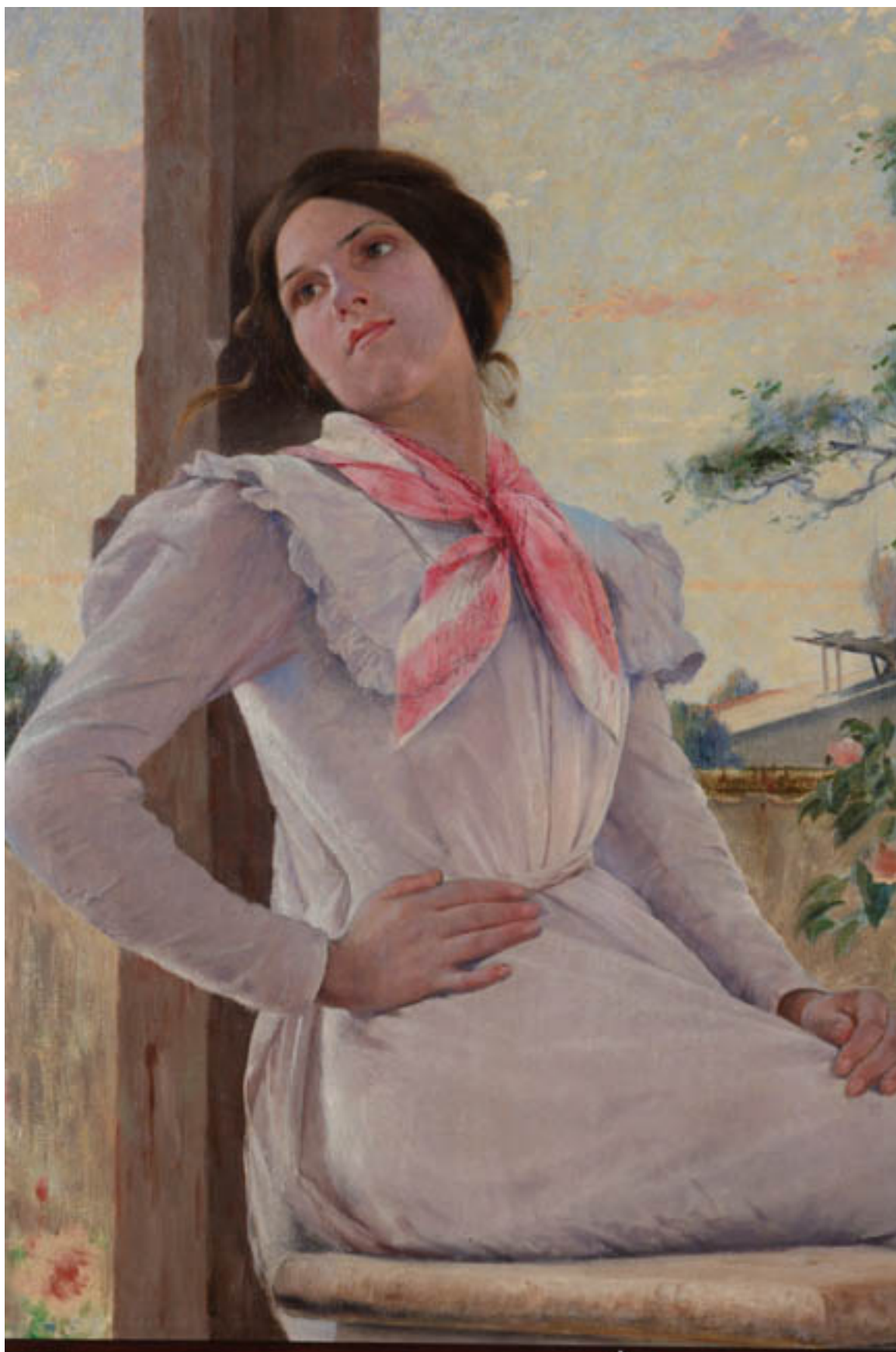
EN EL BALCÓN