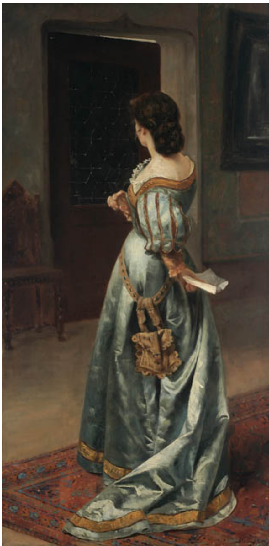
LA CARTA DE AMOR