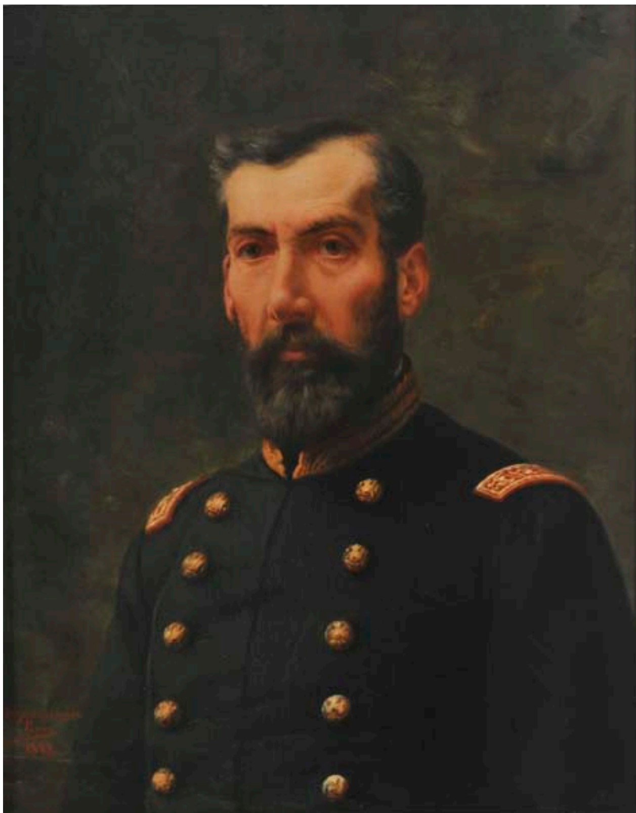
GENERAL MARCOS II MATURANA