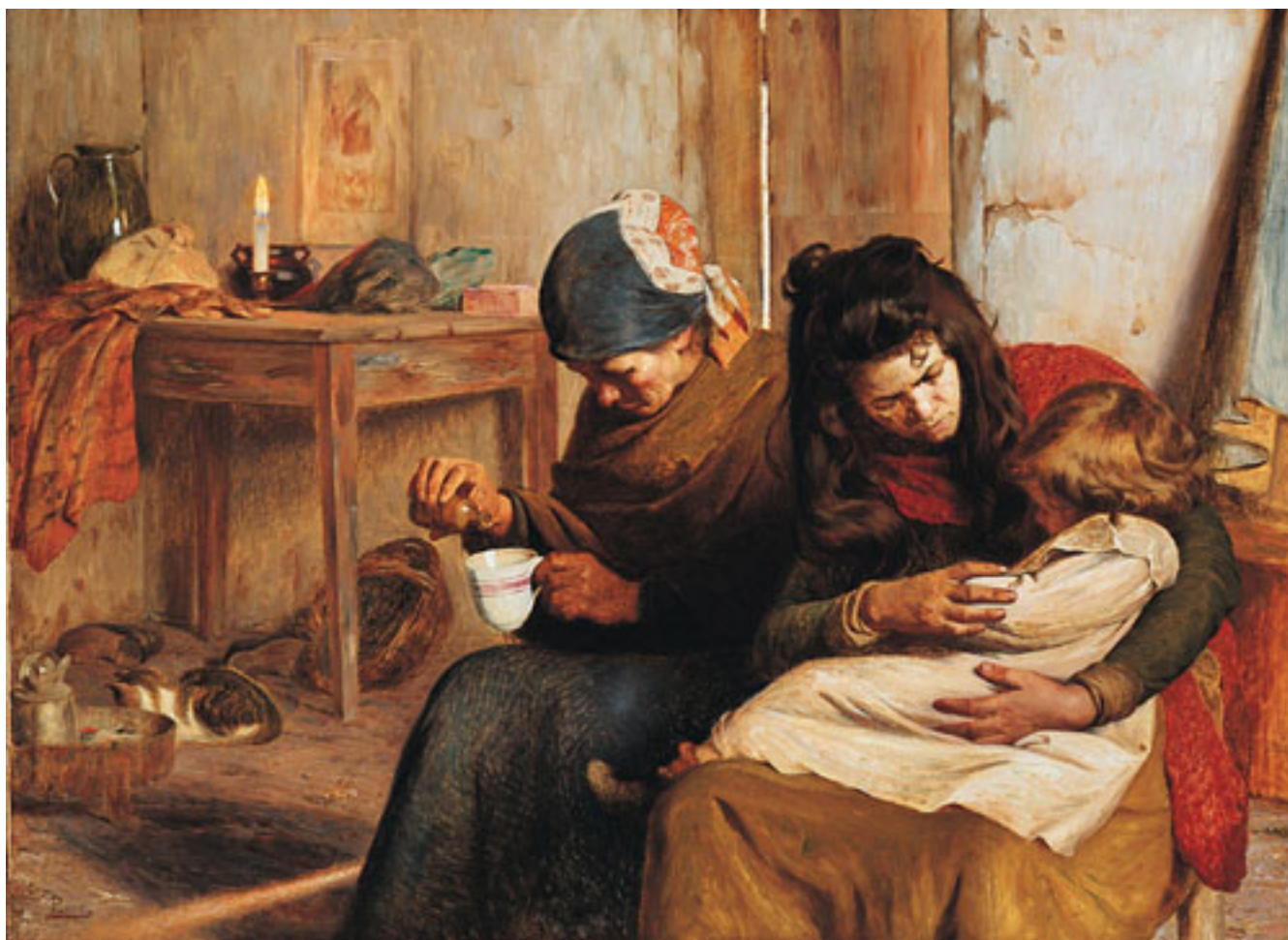
EL NIÑO ENFERMO