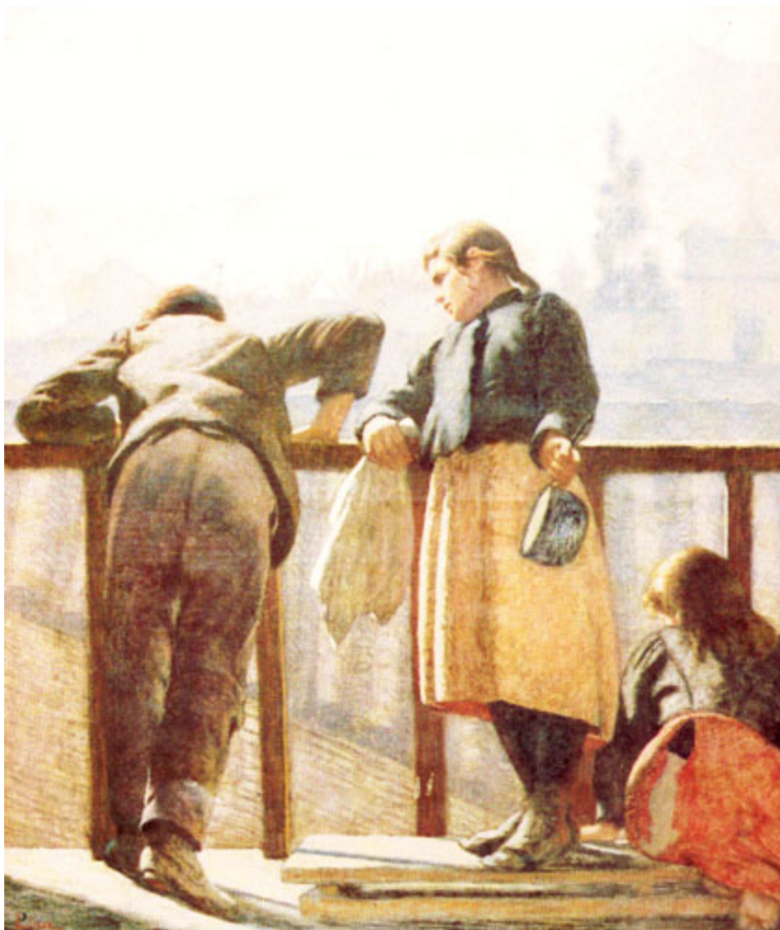
LOS VECINOS CURIOSOS