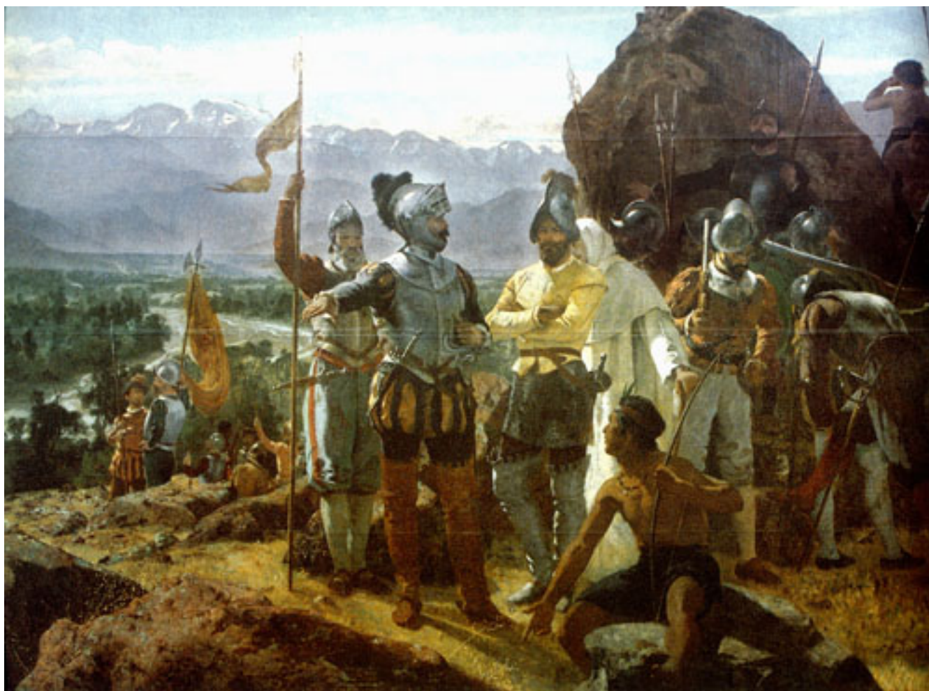
LA FUNDACIÓN DE SANTIAGO