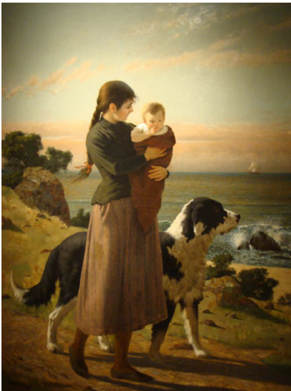
ESCENA DE PLAYA CON FIGURA