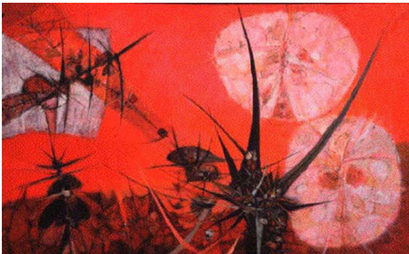
AMÉRICA EMPIEZA AHORA