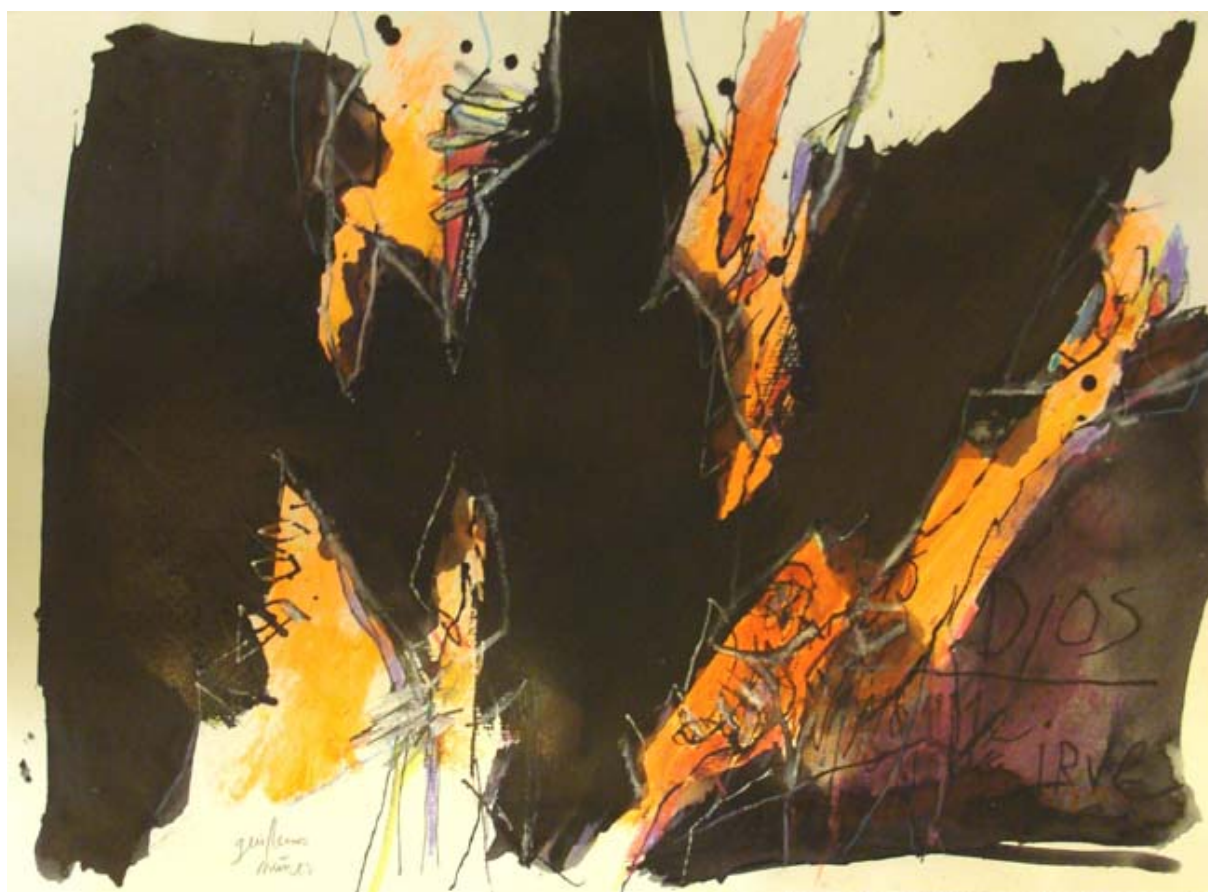
DE LA SERIE "EL CIELO COMO ABISMO" 4