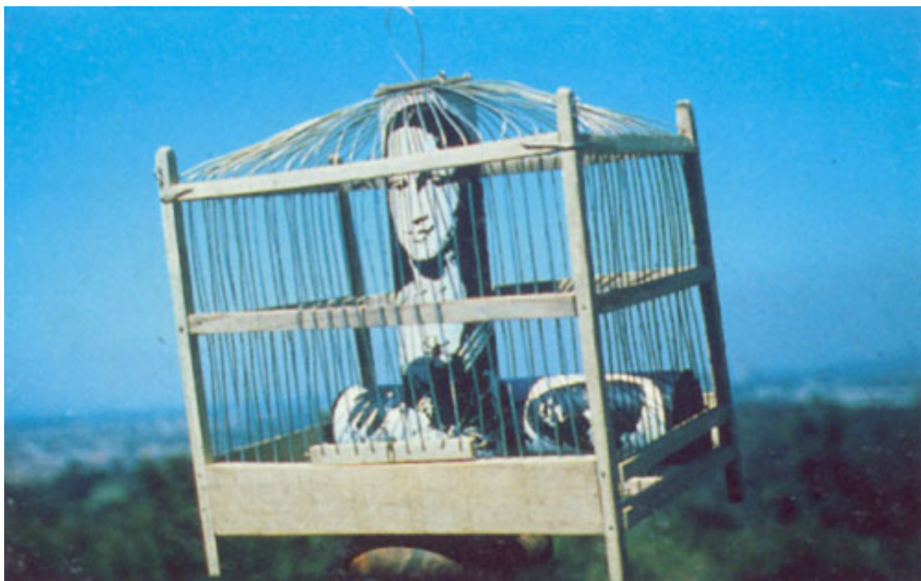
LA GIOCONDA EN JAULADA