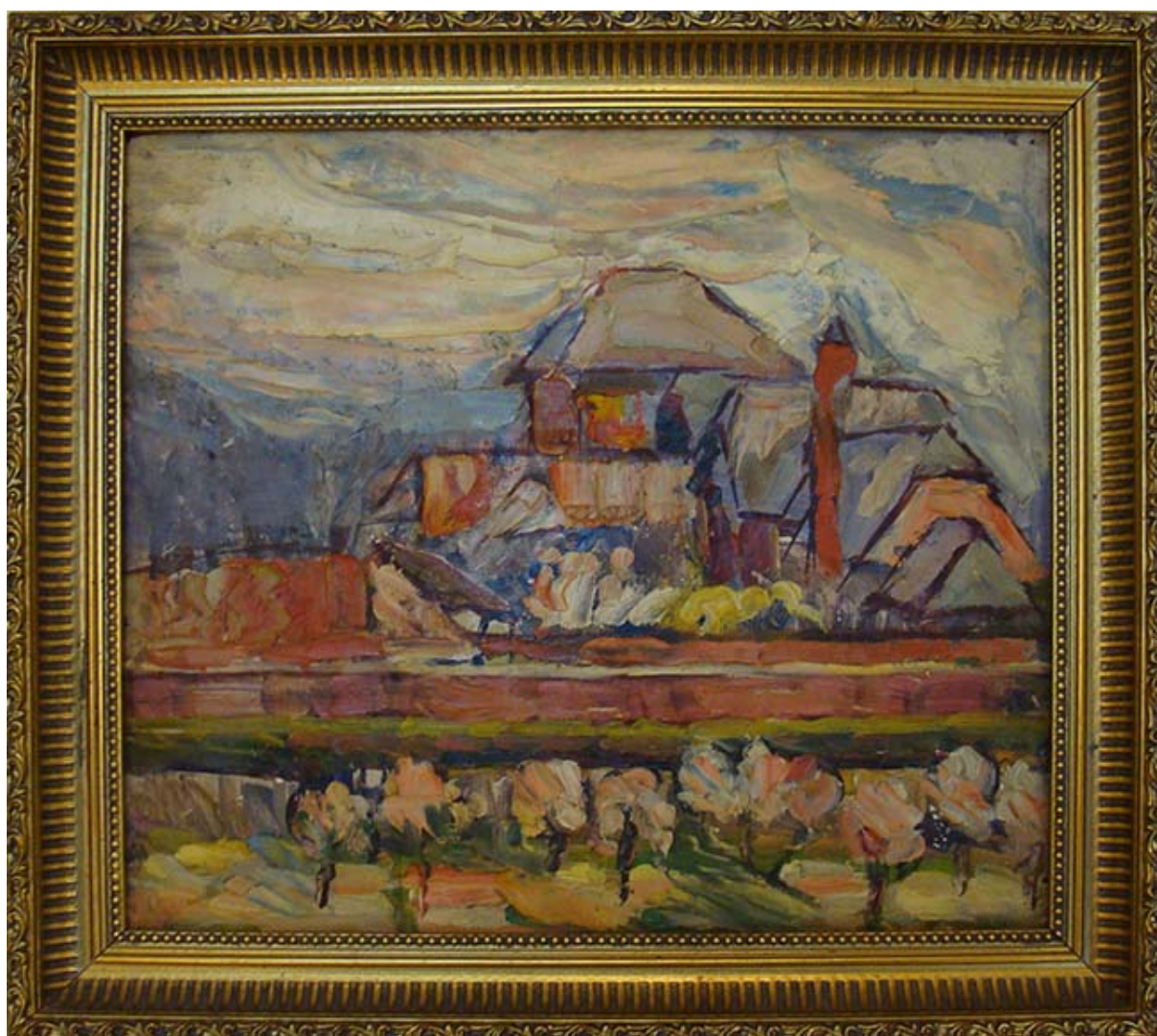
PAISAJE ALEMÁN O PATIO ALEMÁN