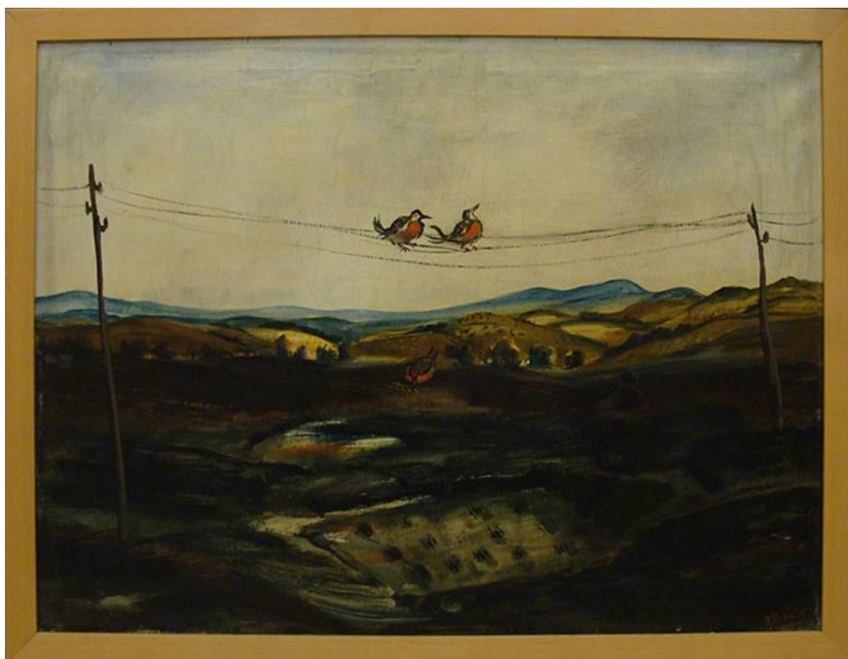
LOICAS EN ANGOL