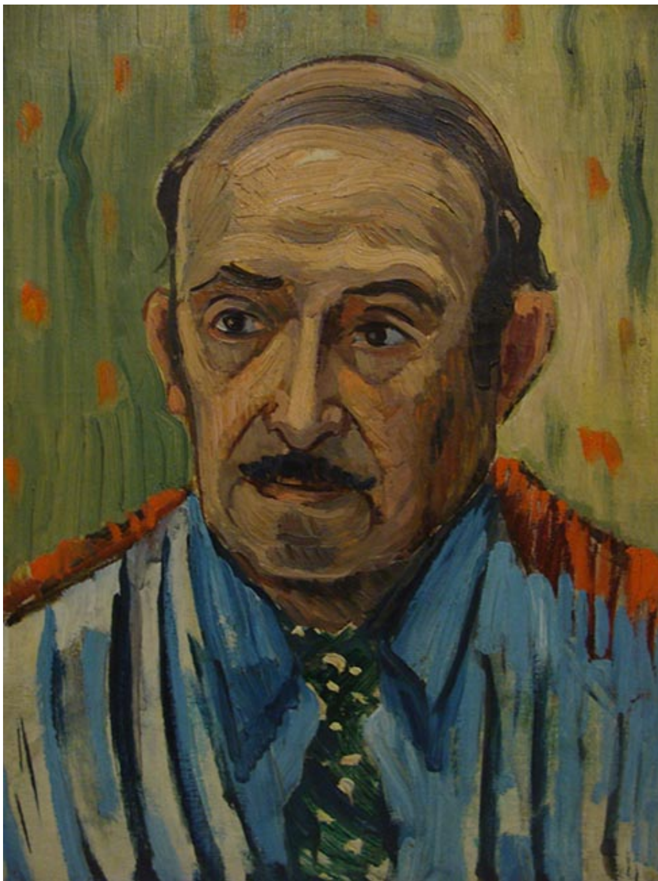
RETRATO DE ISAÍAS CABEZÓN