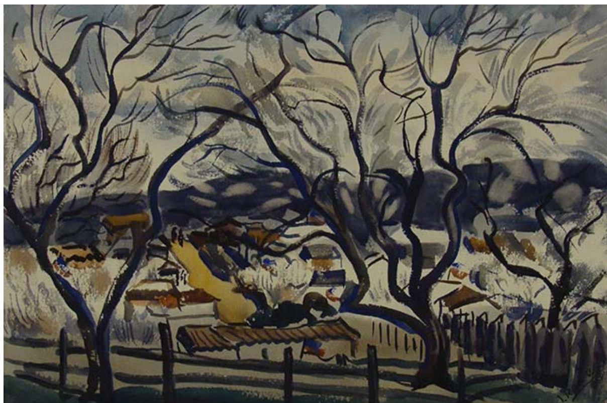
PAISAJE, INVIERNO CON BANDERAS