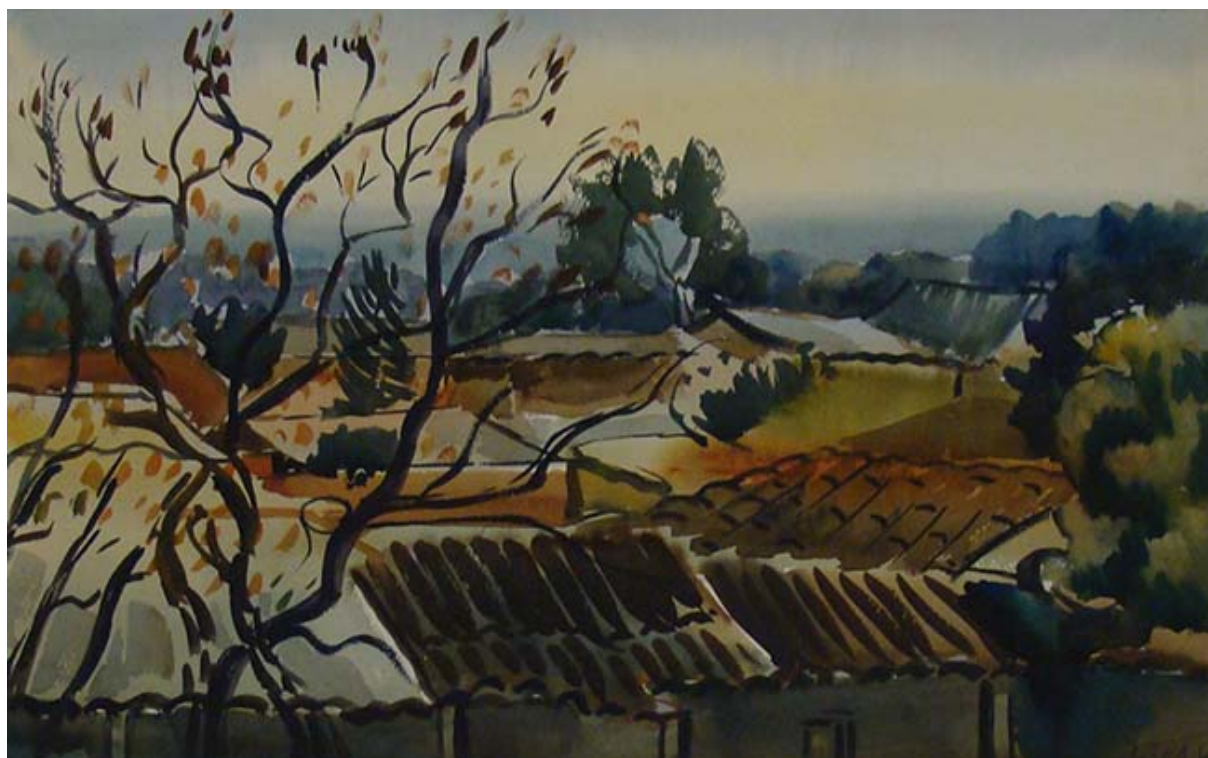
TECHOS EN OTOÑO