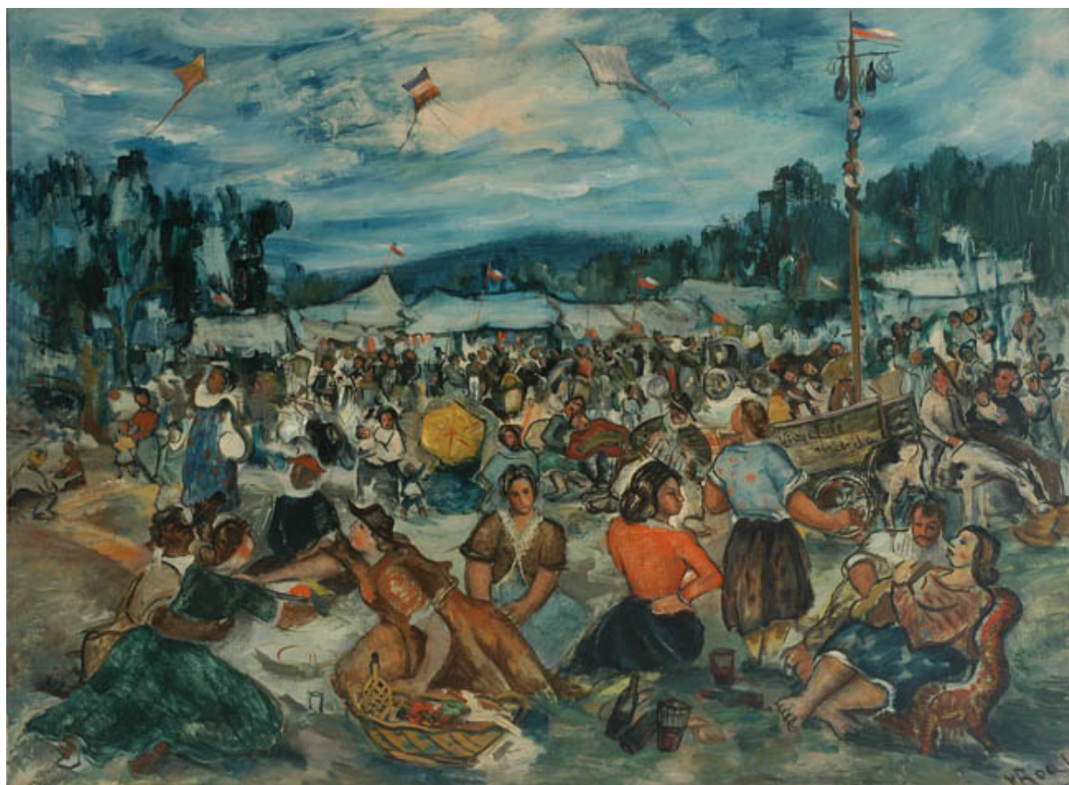
EL DIECIOCHO DE SEPTIEMBRE