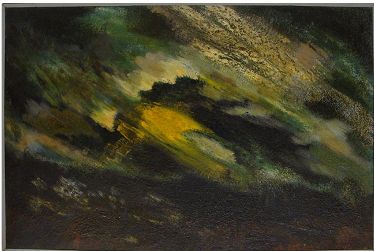
NUBES DE ANGOL