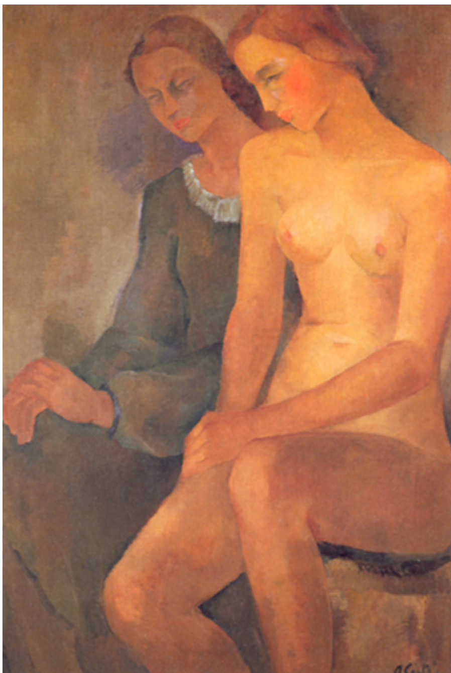
RUBOR E INOCENCIA