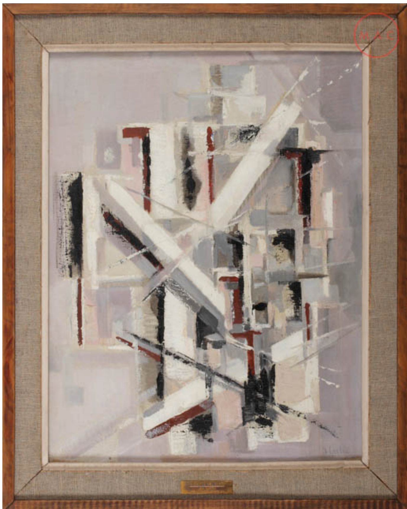
ANDAMIOS DEL SUEÑO