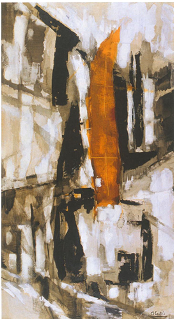
SISMO N° 10