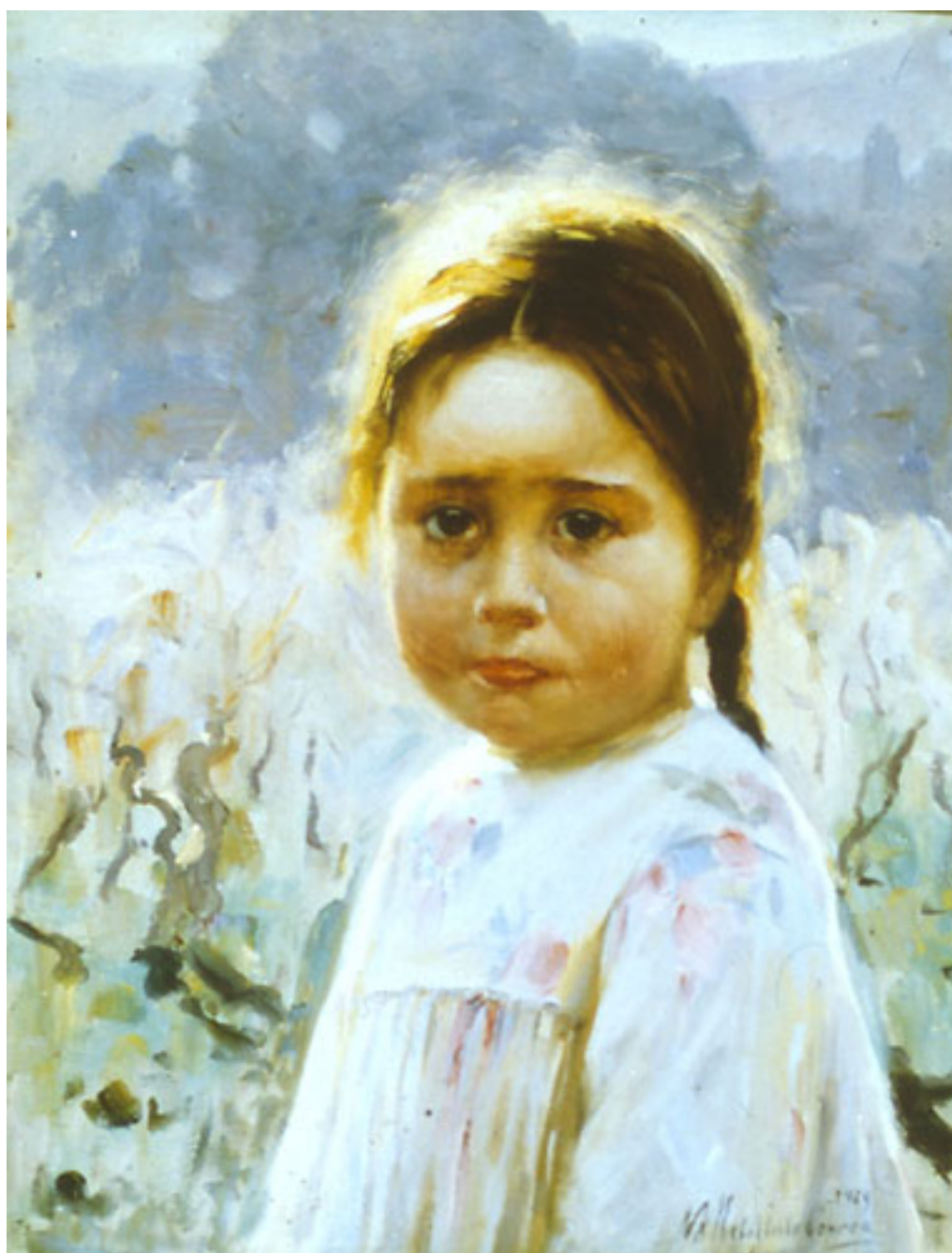
LA NIÑA TAIMADA