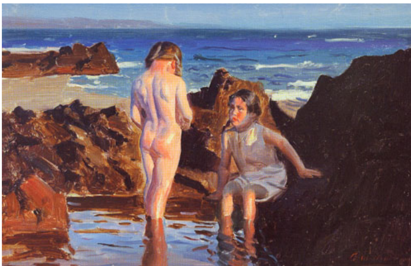
BAÑISTA EN REÑACA