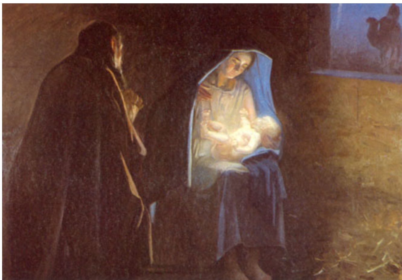
NACIMIENTO DE JESÚS