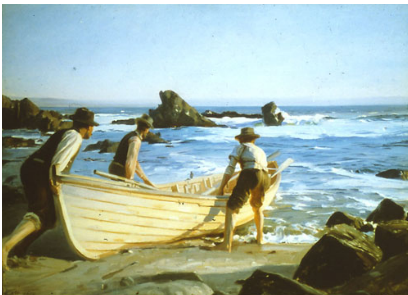
SALIENDO DE PESCA