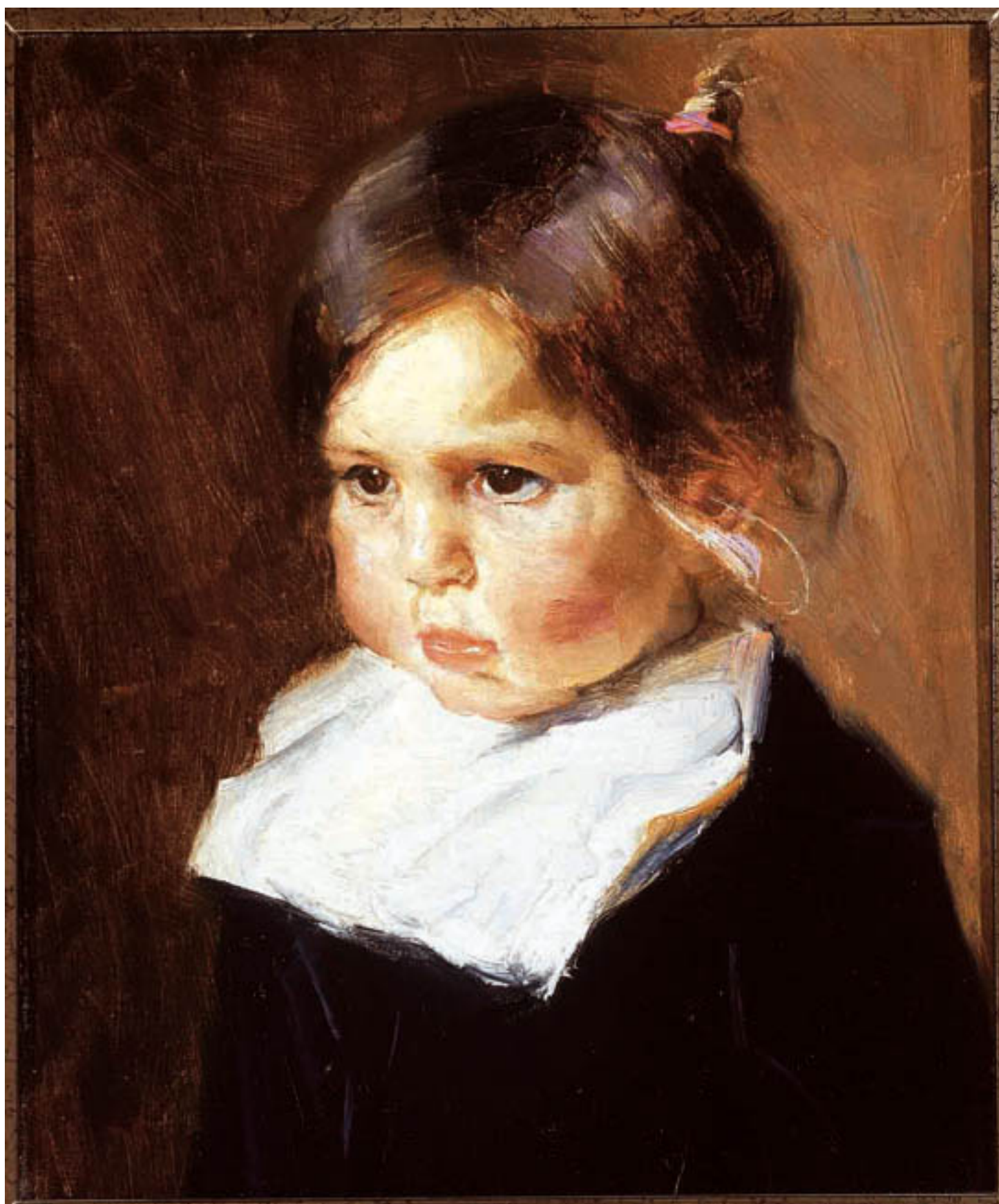
CABEZA DE NIÑA