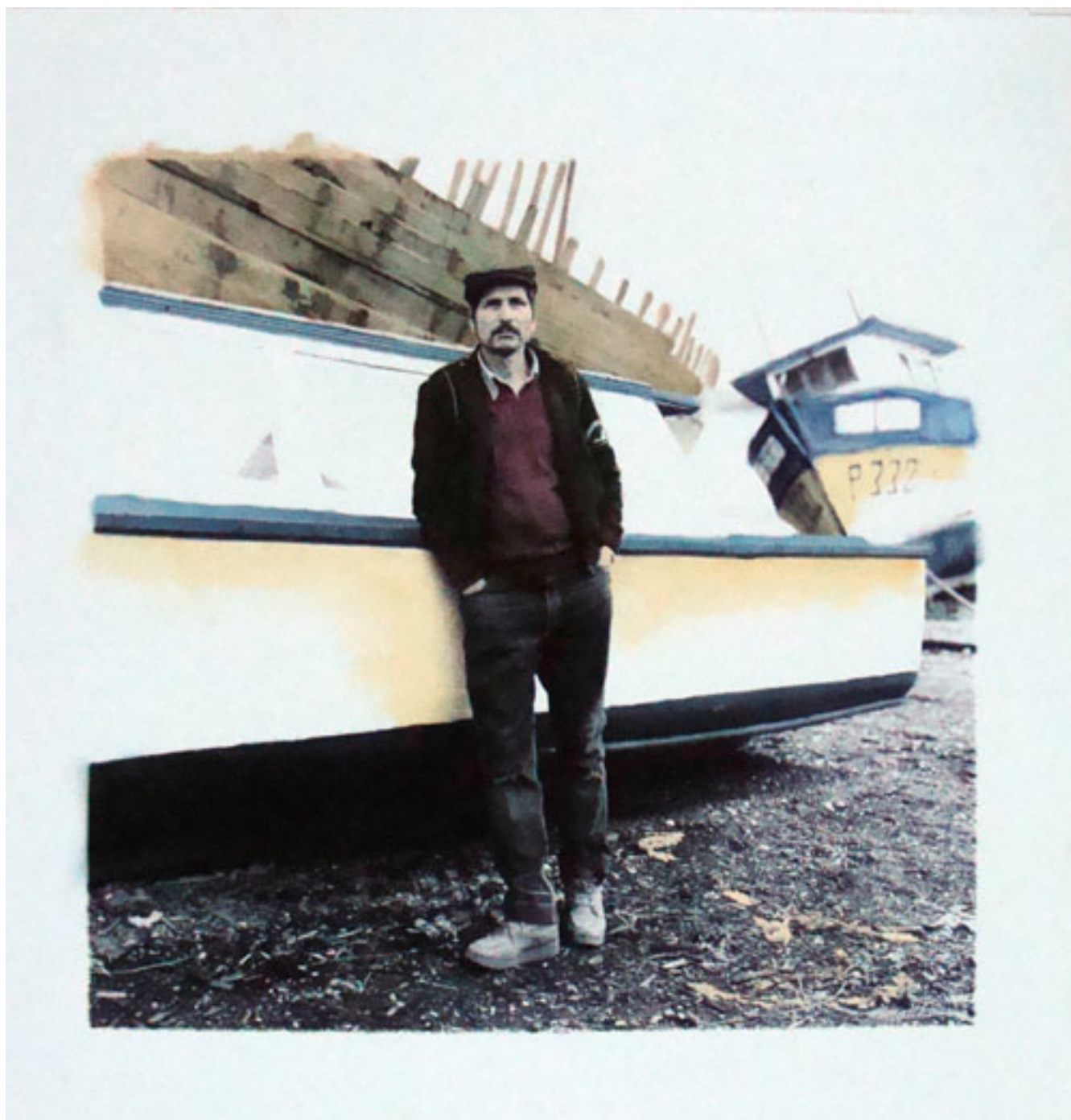
SIN TÍTULO. DE LA SERIE "ROSTROS Y ENCUENTROS CHILOTES"