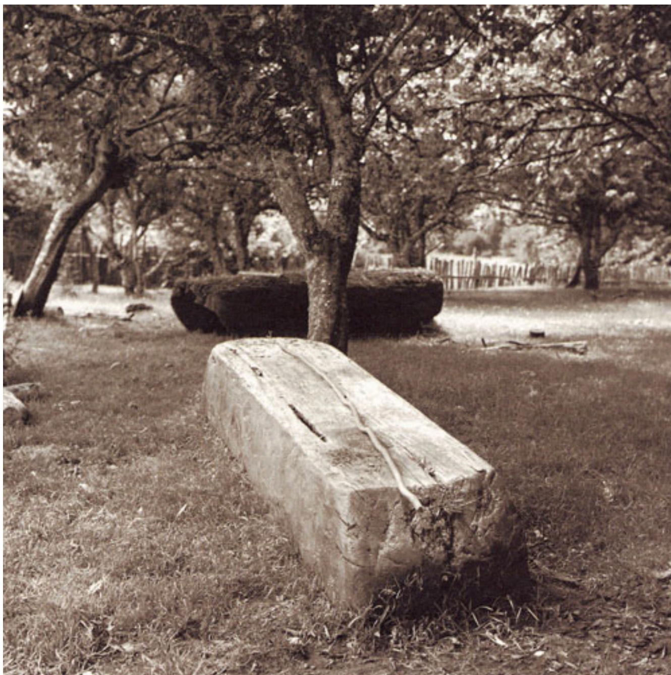
SERIE MAJA 4