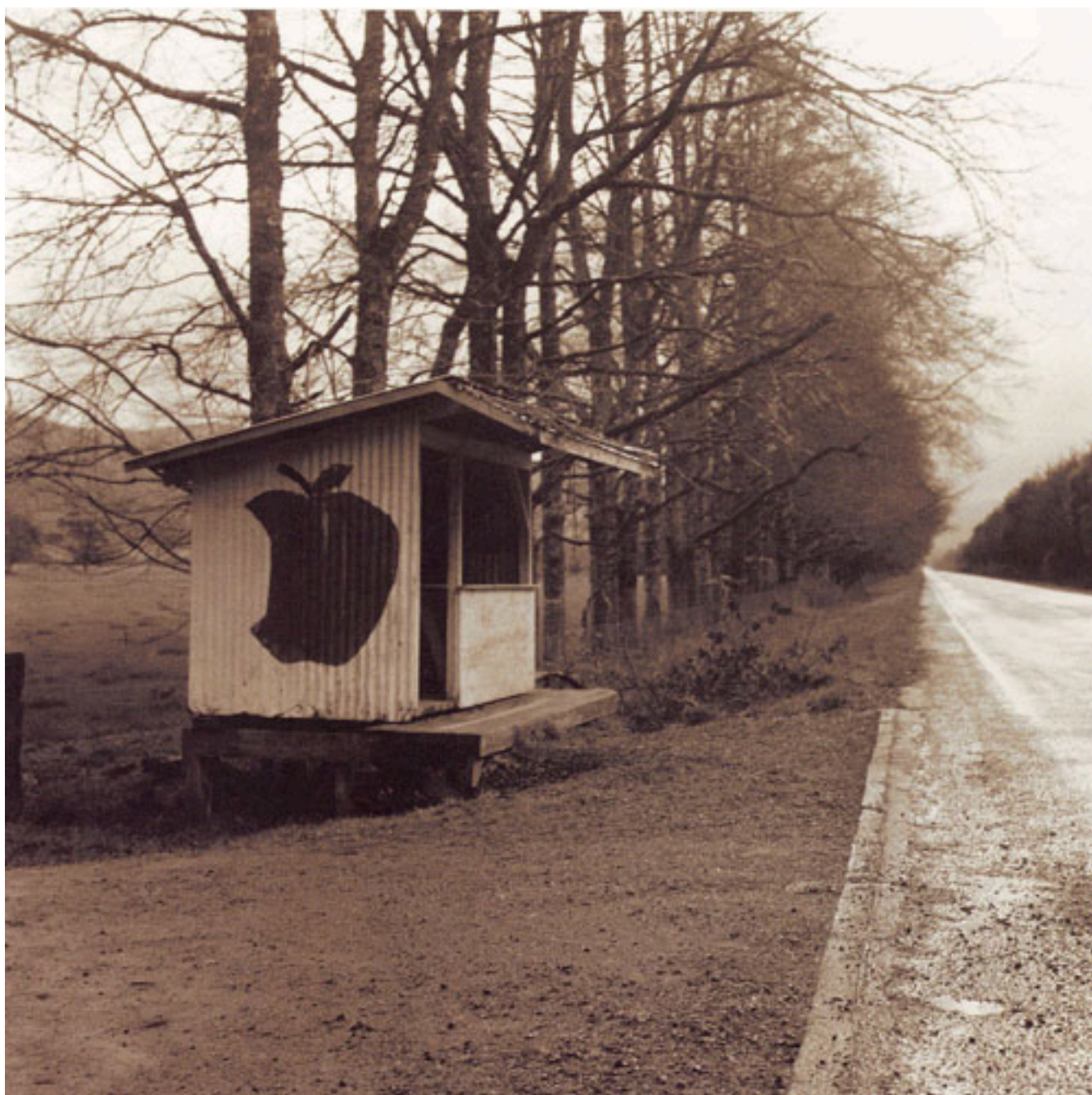
SERIE MAJA 5