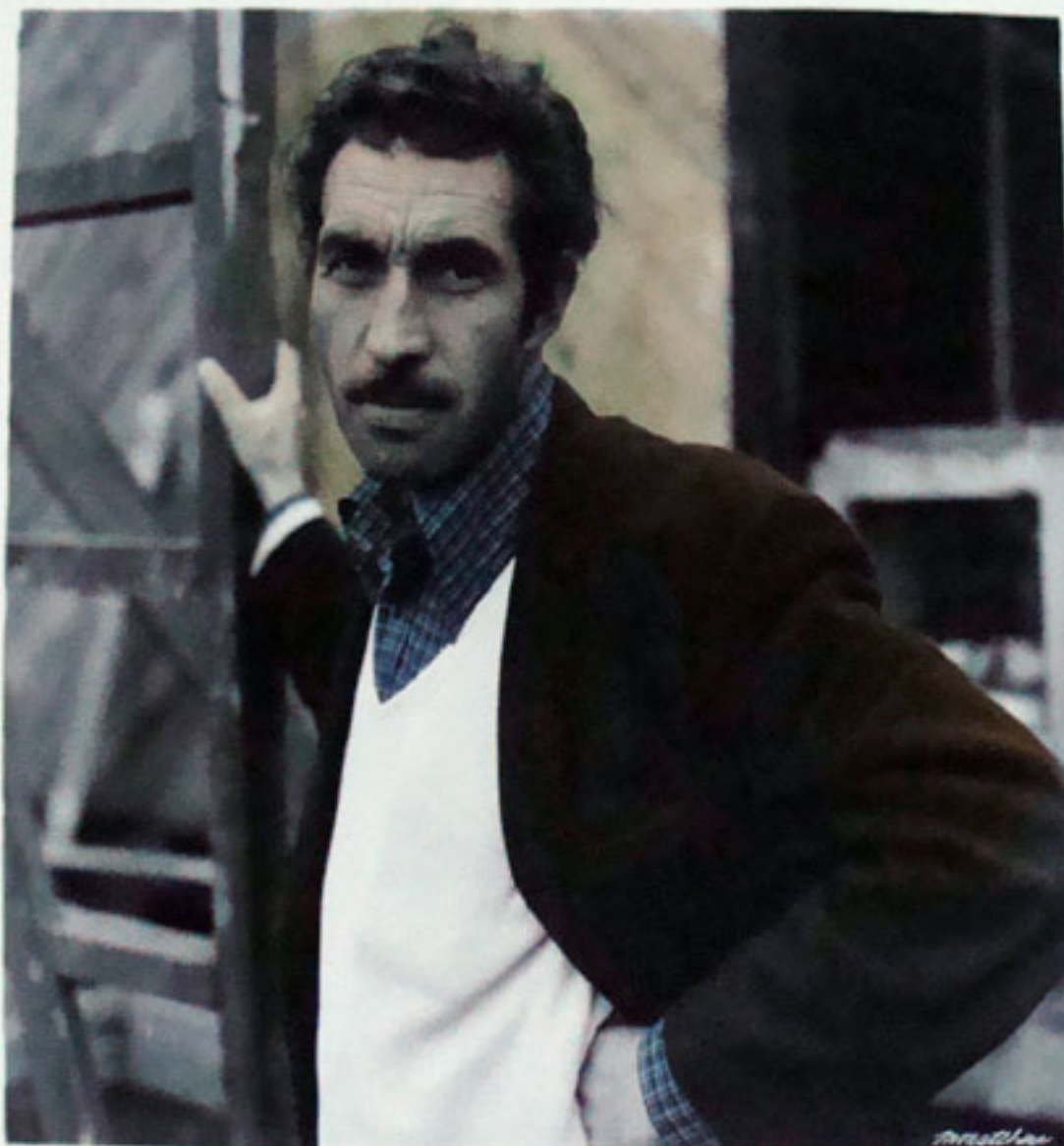
SIN TÍTULO. DE LA SERIE "ROSTROS Y ENCUENTROS CHILOTES"