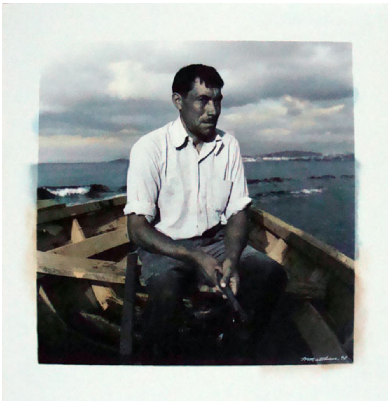
SIN TÍTULO. DE LA SERIE "ROSTROS Y ENCUENTROS CHILOTES"