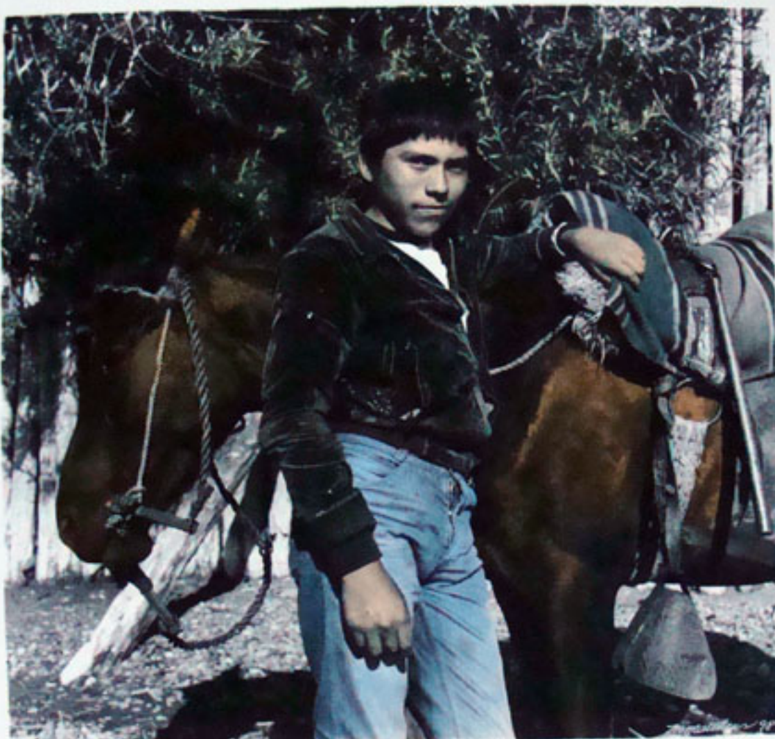
SIN TÍTULO. DE LA SERIE "ROSTROS Y ENCUENTROS CHILOTES"