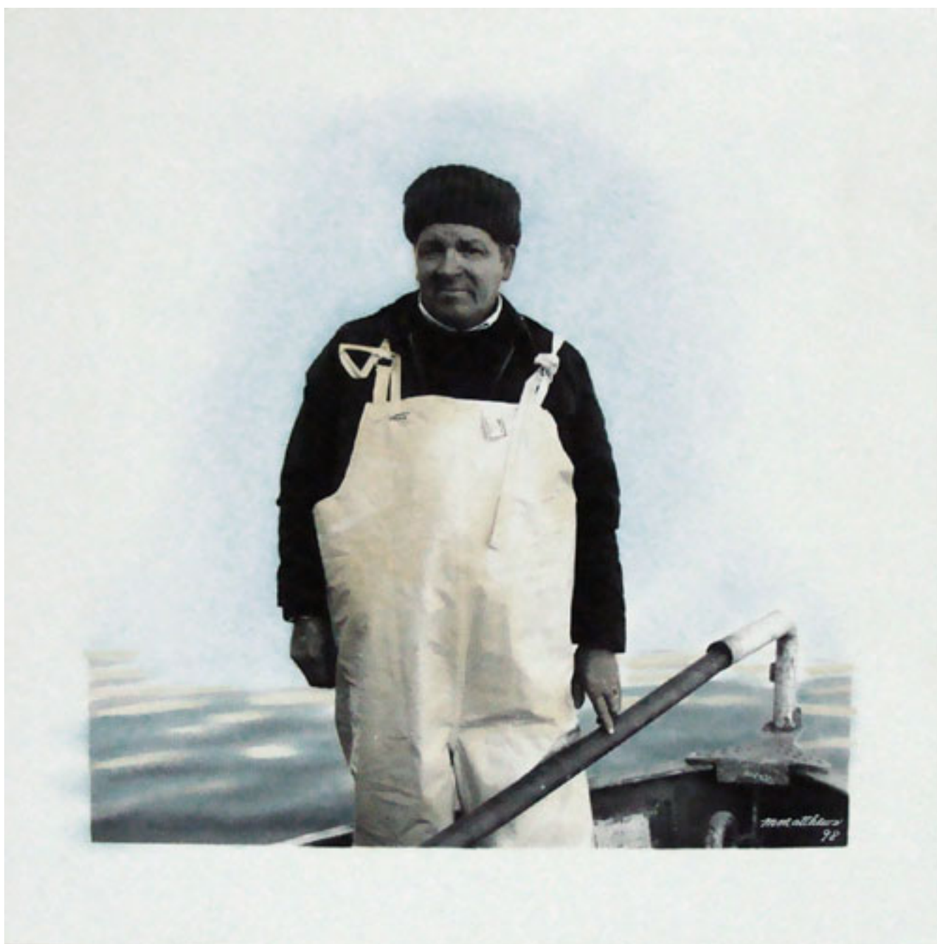
SIN TÍTULO. DE LA SERIE "ROSTROS Y ENCUENTROS CHILOTES"

UNIVERSIDAD FINIS TERRAE, 2007. Alas y raíces. Fotografía I . Santiago de Chile: Facultad de Artes, Universidad Finis Terrae, N° 7, pp. 42-43.