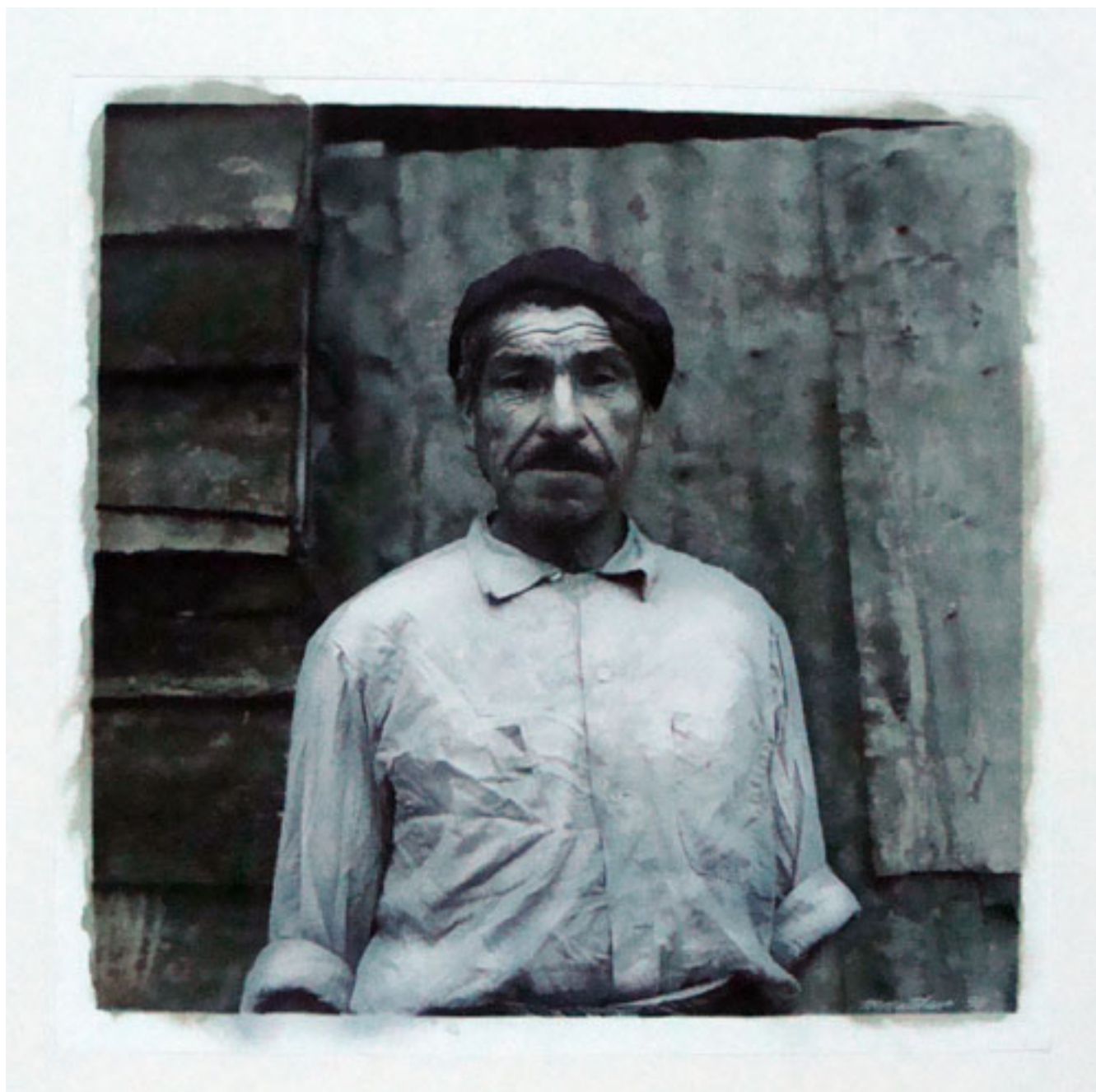
SIN TÍTULO. DE LA SERIE "ROSTROS Y ENCUENTROS CHILOTES"