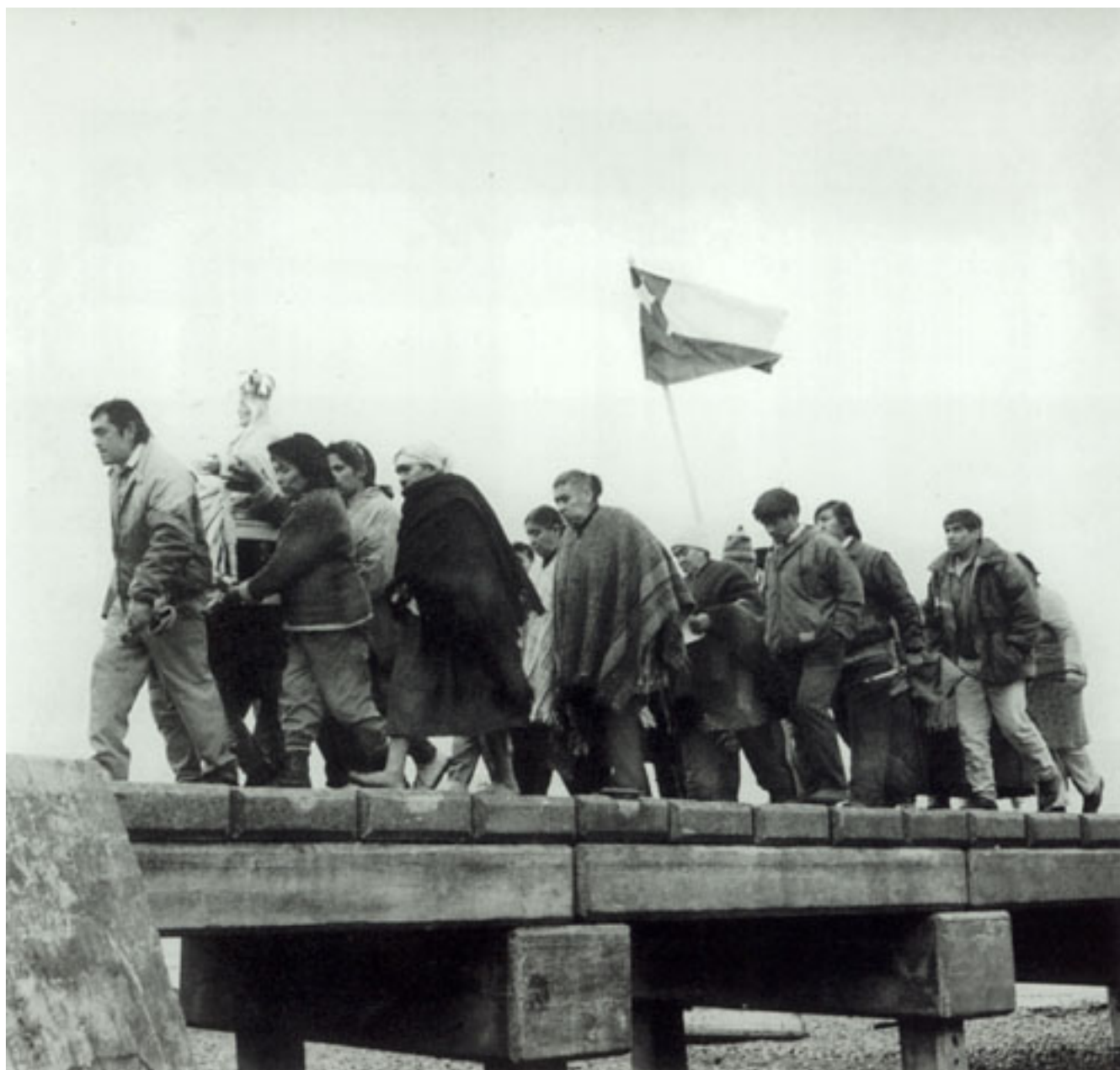
FIESTA DEL NAZARENO ISLA CAHUACH