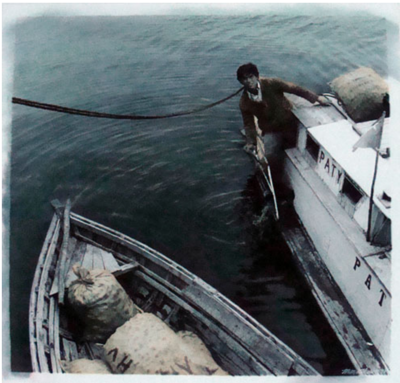
SIN TÍTULO. DE LA SERIE "ROSTROS Y ENCUENTROS CHILOTES"