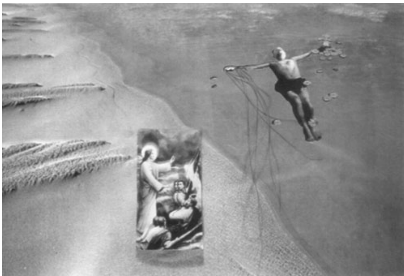
LA PESCA MILAGROSA