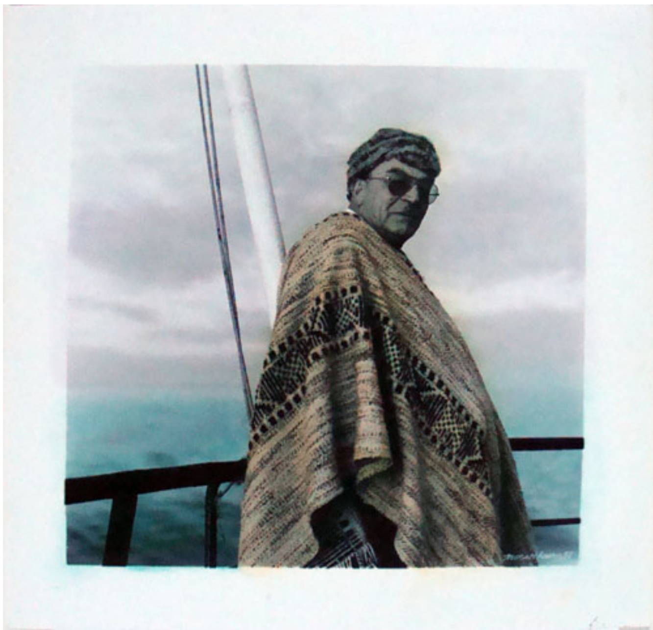
SIN TÍTULO. DE LA SERIE "ROSTROS Y ENCUENTROS CHILOTES"