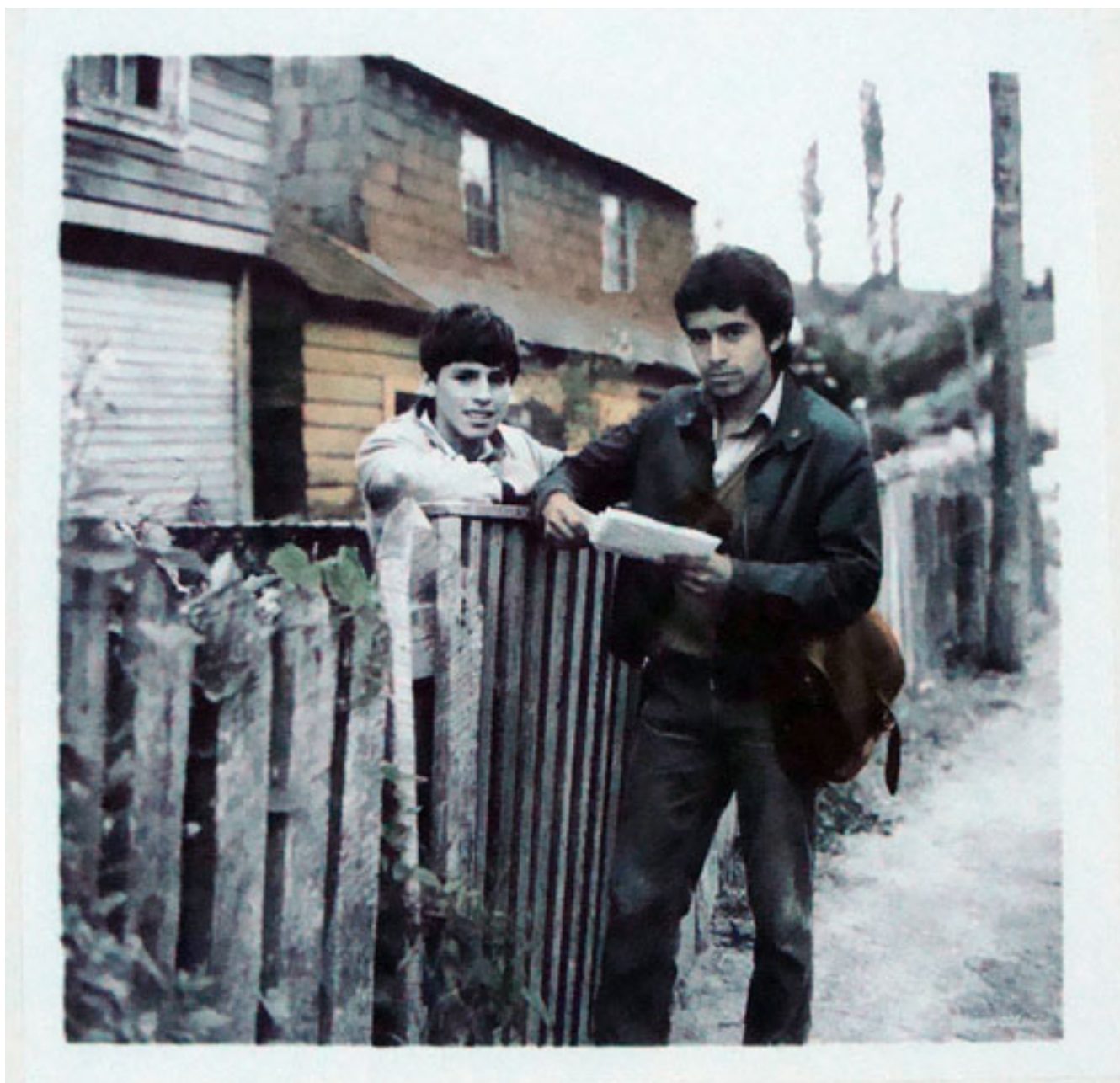
SIN TÍTULO. DE LA SERIE "ROSTROS Y ENCUENTROS CHILOTES"