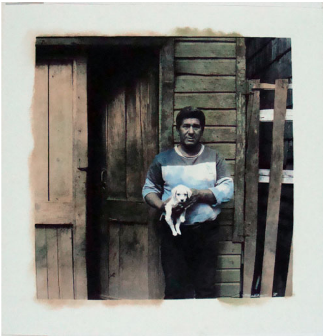
SIN TÍTULO. DE LA SERIE "ROSTROS Y ENCUENTROS CHILOTES"