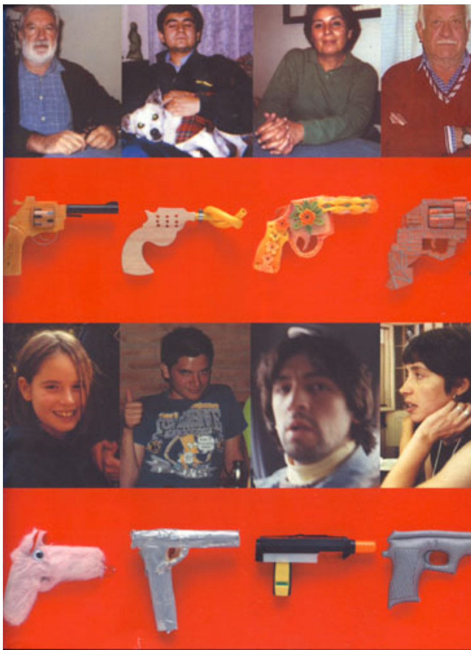
THE NEW IDEAL LINE (RED FAMILIA)