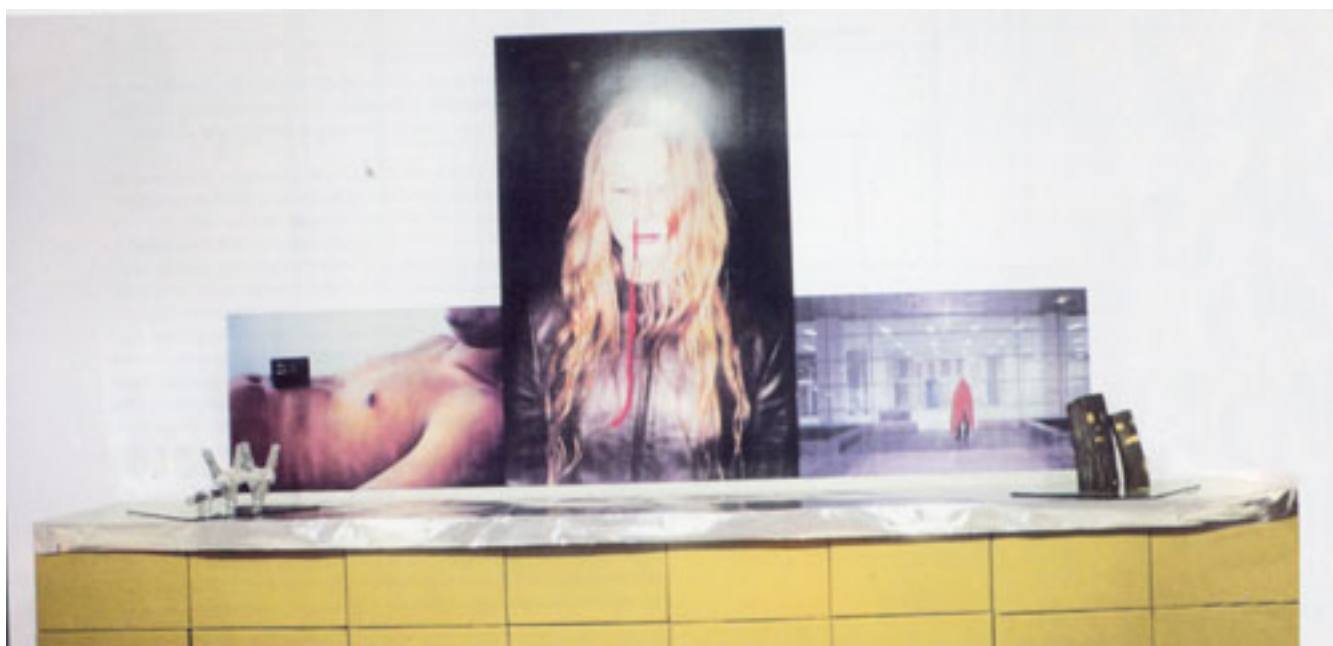
THE NEW IDEAL LIVE