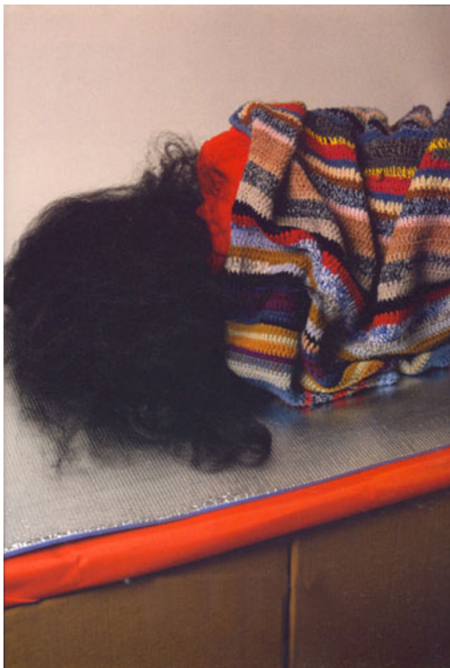
THE NEW IDEAL (EL ATAJO)