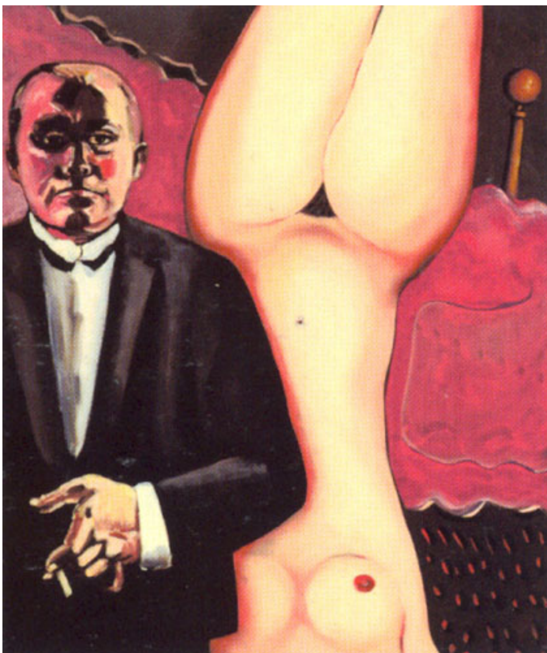
MAX Y LA MODELO