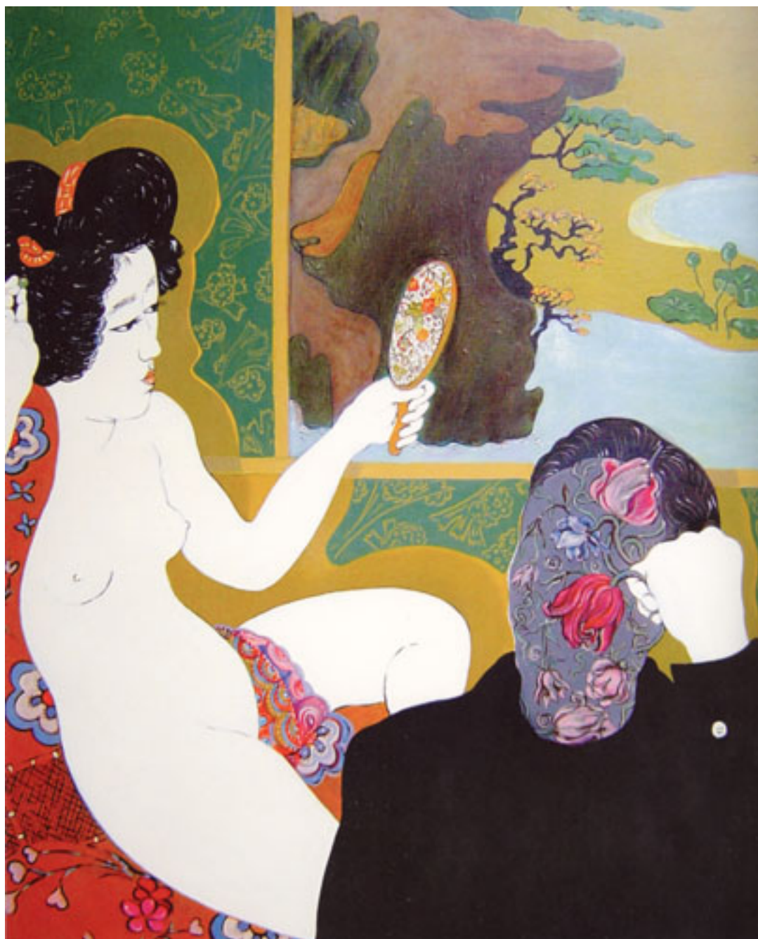
BALTHUS EN SETSUKO