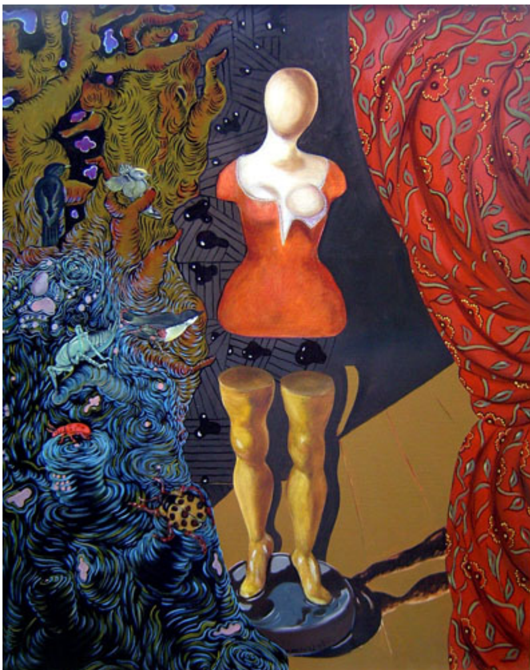
LA BELLE AU BOIS VIVANT