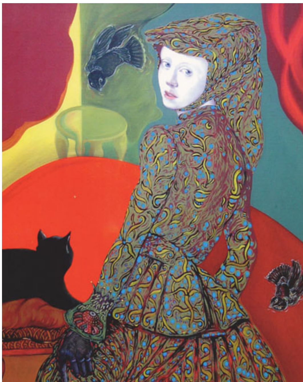
MEISJE ZONDER PAREL