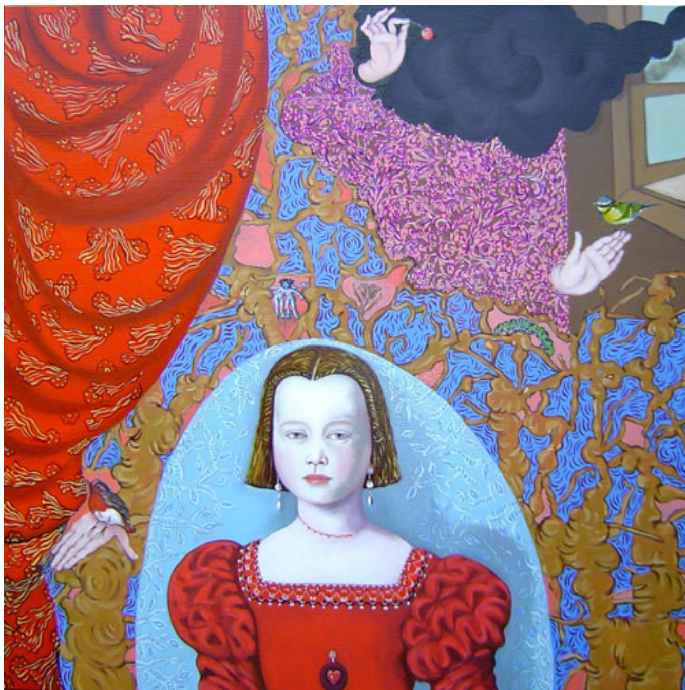
L' AGE DE L'INNOCENCE