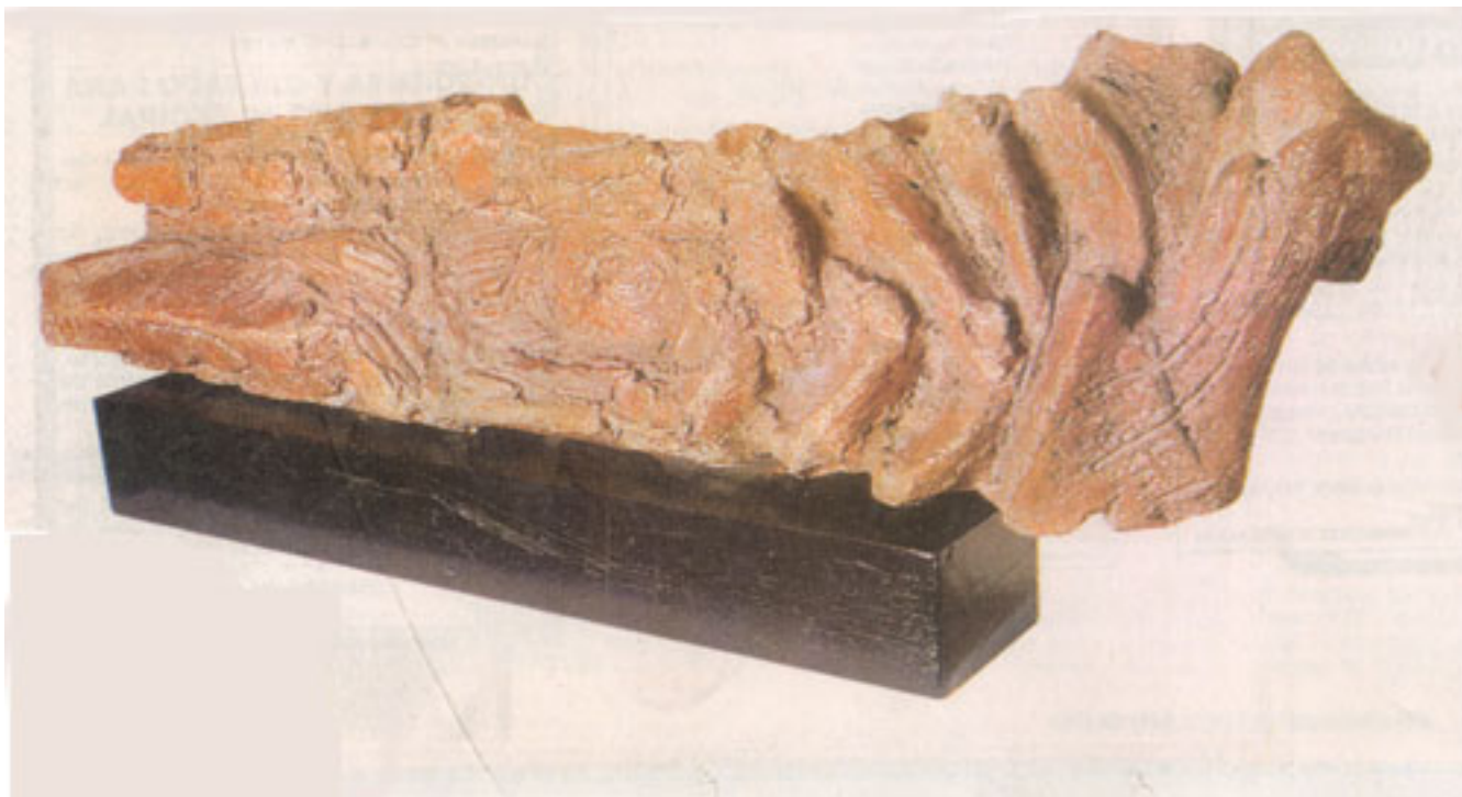
FIGURA (TÓTEM) GRIS