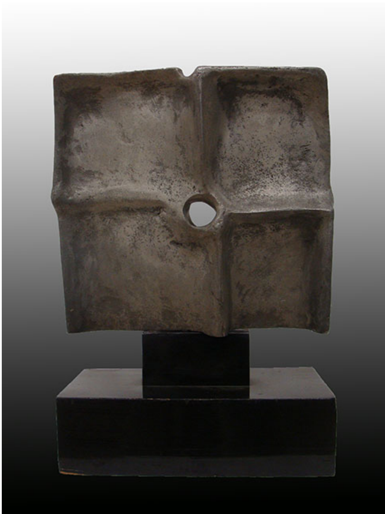
CUADRADO DE LA MELANCOLÍA

BIBLIOTECA MNBA. Colección de Artículos de Prensa de la Artista ROSA VICUÑA publicados en diarios y revistas entre 1973 y 2007.